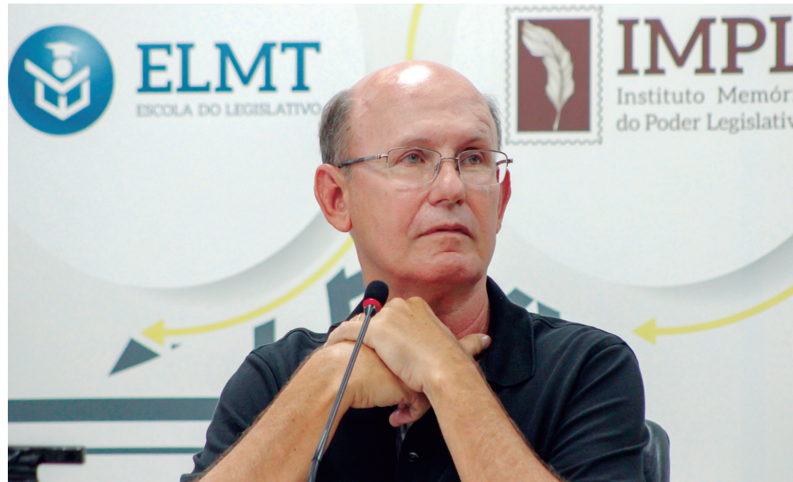
Avallone afirma que foi pressionado pelo interior do estado a desistir da disputa pela prefeitura de Cuiabá