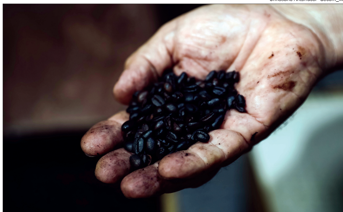
Em MT, por exemplo, a produtividade por hectare plantado cresceu 185%, colocando o estado em 9º lugar no ranking de maior produção

Os municípios que mais se destacam na produção de cafés são Colniza, Nova Bandeirantes, Juína, Co-