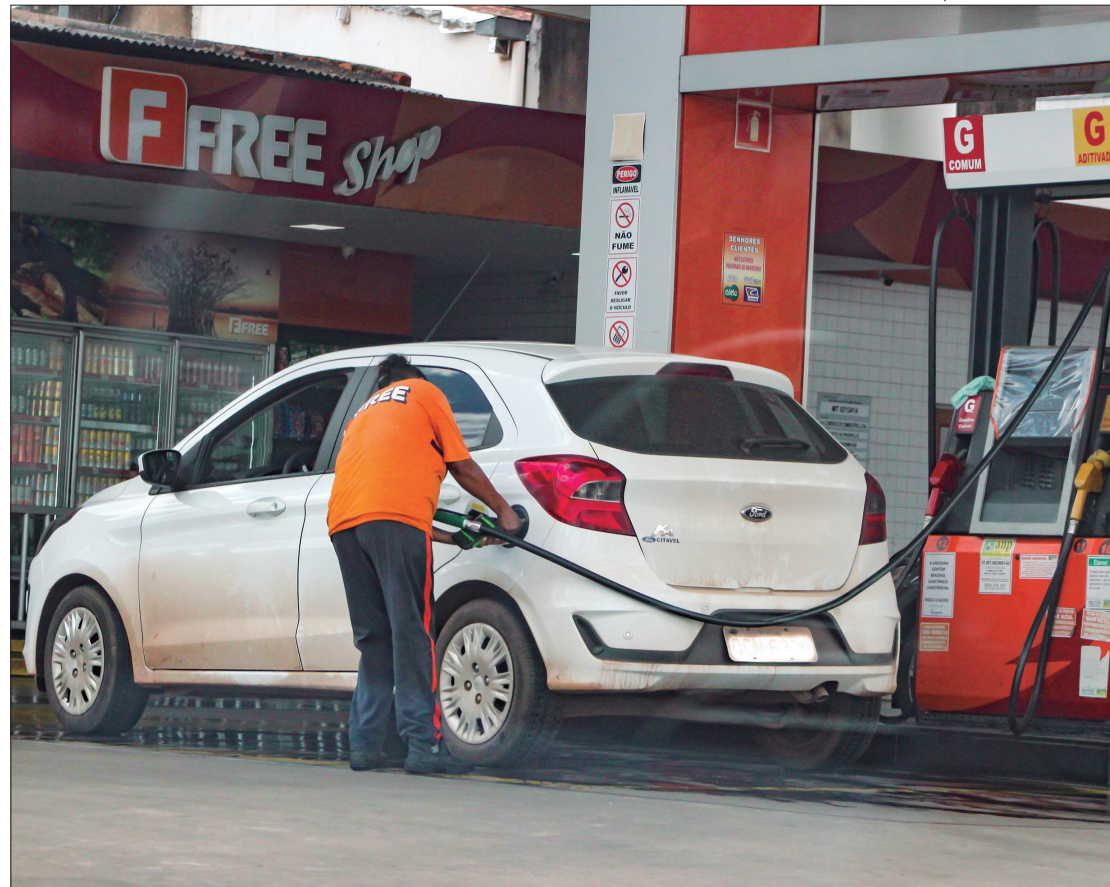
Em relação aos combustíveis, todos registraram queda nos preços: etanol, gás veicular, óleo diesel e gasolina