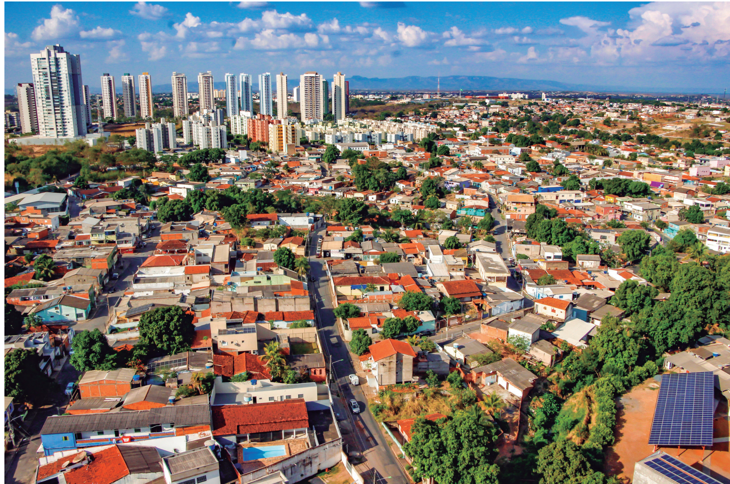
No ranking de melhores capitais para se viver, Cuiabá aparece na 8ª posição