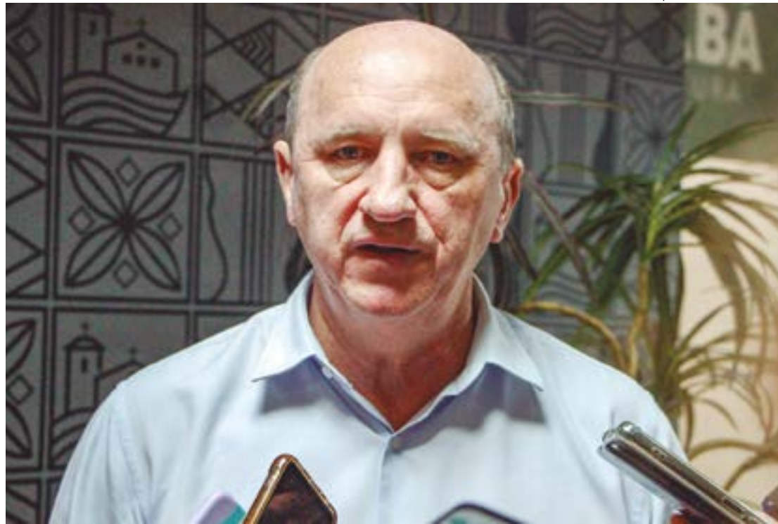
Lupion avalia que Neri Geller foi 'sacrificado' para que o PT escape da crise causada pelo 'escândalo do arroz'