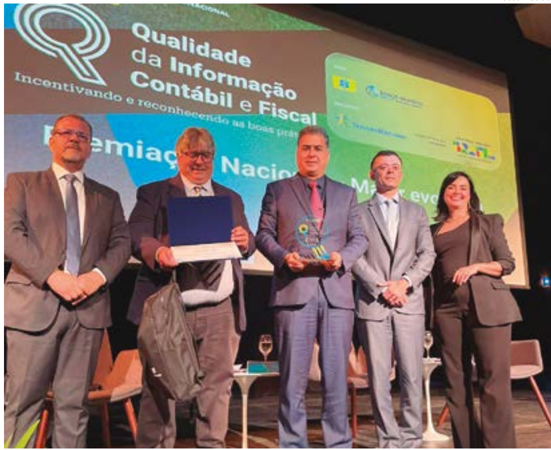
Emanuel destacou que a premiação derruba todas as mentiras que foram ditas sobre a saúde fiscal da Prefeitura

Emanuel ainda fez questão de agradecer aos profissionais de outros órgãos que ajudaram a alcançar esse resultado.