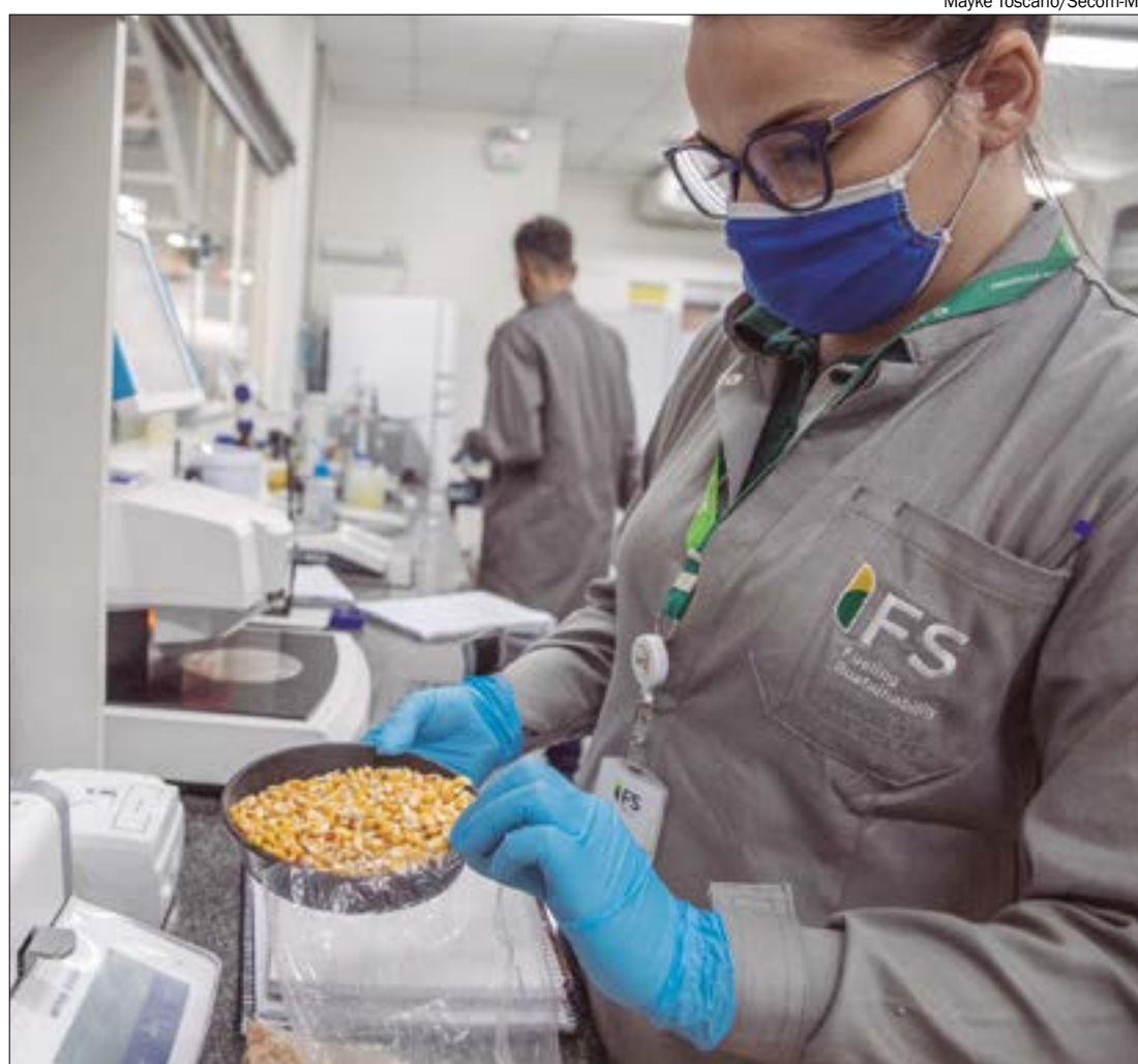
Da lavoura à cidade, etanol de milho gera centenas de milhares de emprego em Mato Grosso