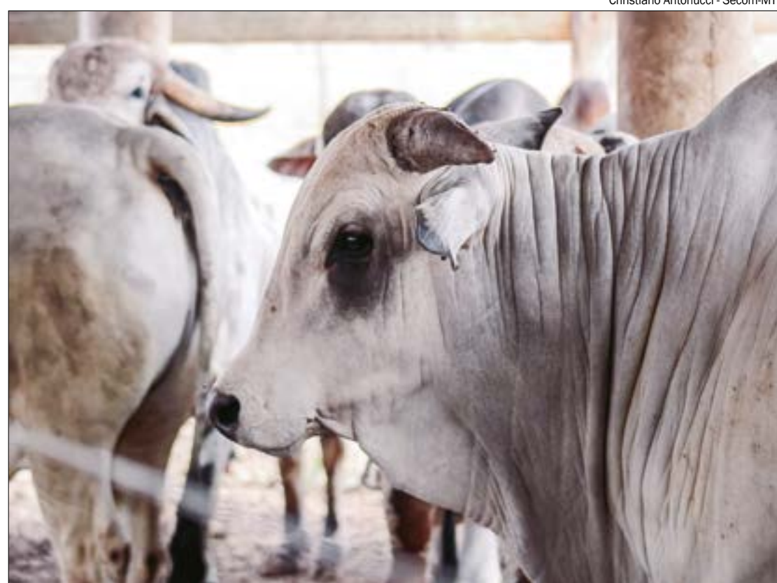
Christiano Antonucci - Secom-MT

“A decisão de abater ou manter as fêmeas influencia diretamente a produção de carne bovina. Com mais fêmeas no pasto, isso pode levar a um aumento na oferta de carne no futuro, com o nascimento de bezerros e novilhas. Por outro lado, com mais fêmeas abatidas, a oferta de carne aumenta, contudo, a tendência da produção de carne para o futuro pode ser de queda, podendo causar uma valorização da arroba paga ao produtor de carne bovina”, apontou Juan Barrientos.