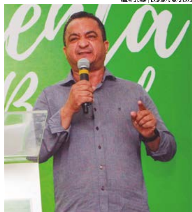
Segundo o médico, Marcrean teria tentado dar uma "carteirada" para conseguir informações sobre uma paciente internada na UTI 2

O presidente da Comissão de Ética, Rodrigo Arruda e Sá (PSDB), afirmou que ainda não tinha conhecimento dos detalhes sobre o caso e que iria analisá-lo antes de fazer qualquer apontamento sobre a possibilidade de abertura de um processo contra Marcrean.