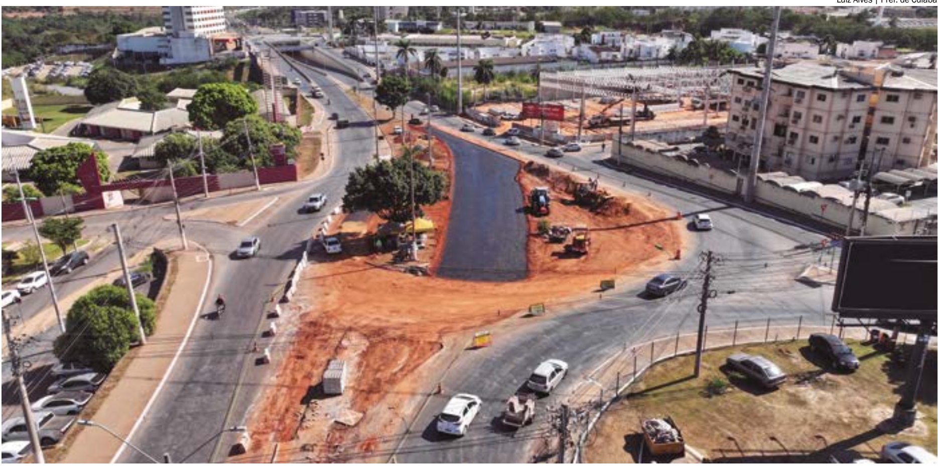
Luiz Alves | Pref. de Cuiabá

o trânsito mais eficiente e agradável para moradores e visitantes da nossa capital", avaliou o prefeito de Cuiabá, Emanuel Pinheiro (MDB).