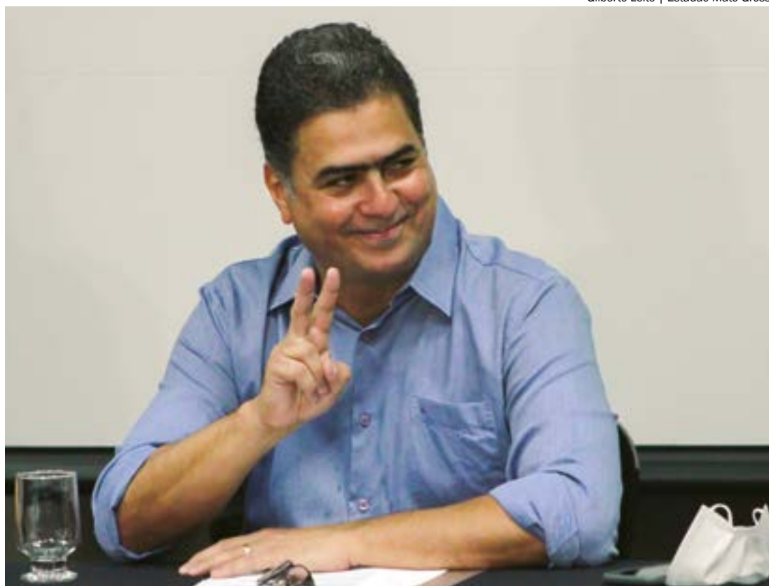
Os vereadores rejeitaram a abertura da comissão que investigaria um suposto calote de R$ 30 milhões em emendas impositivas