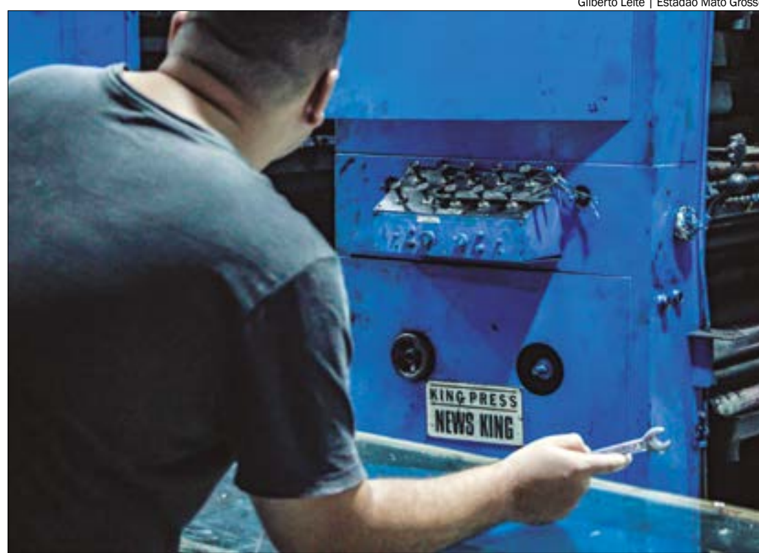
Apesar da queda, o setor apresenta crescimento de 3,5% no ano e de 1,5% em 12 meses

"A indústria de transformação teve o quinto mês seguido com resul-