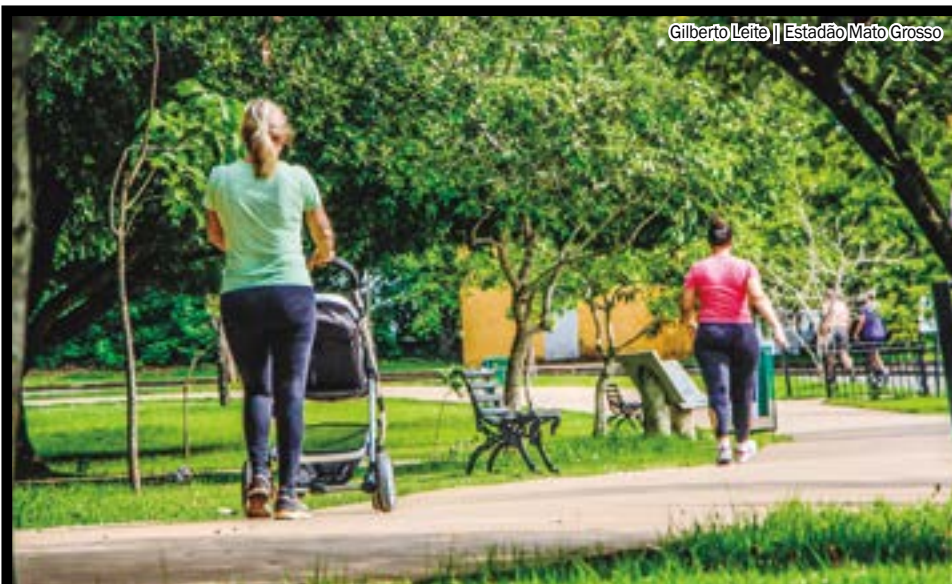
Gilberto Leite | Estadão Mato Grosso

SEMANA DO MEIO AMBIENTE SERÁ CELEBRADA EM PARQUES DE CUIABÁ