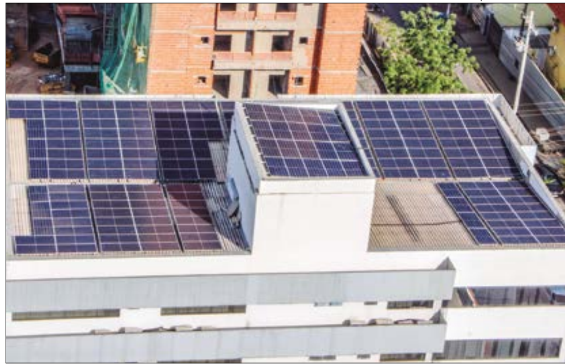
Energia solar já é a segunda maior fonte de energia do Brasil, superada apenas pelas hidrelétricas