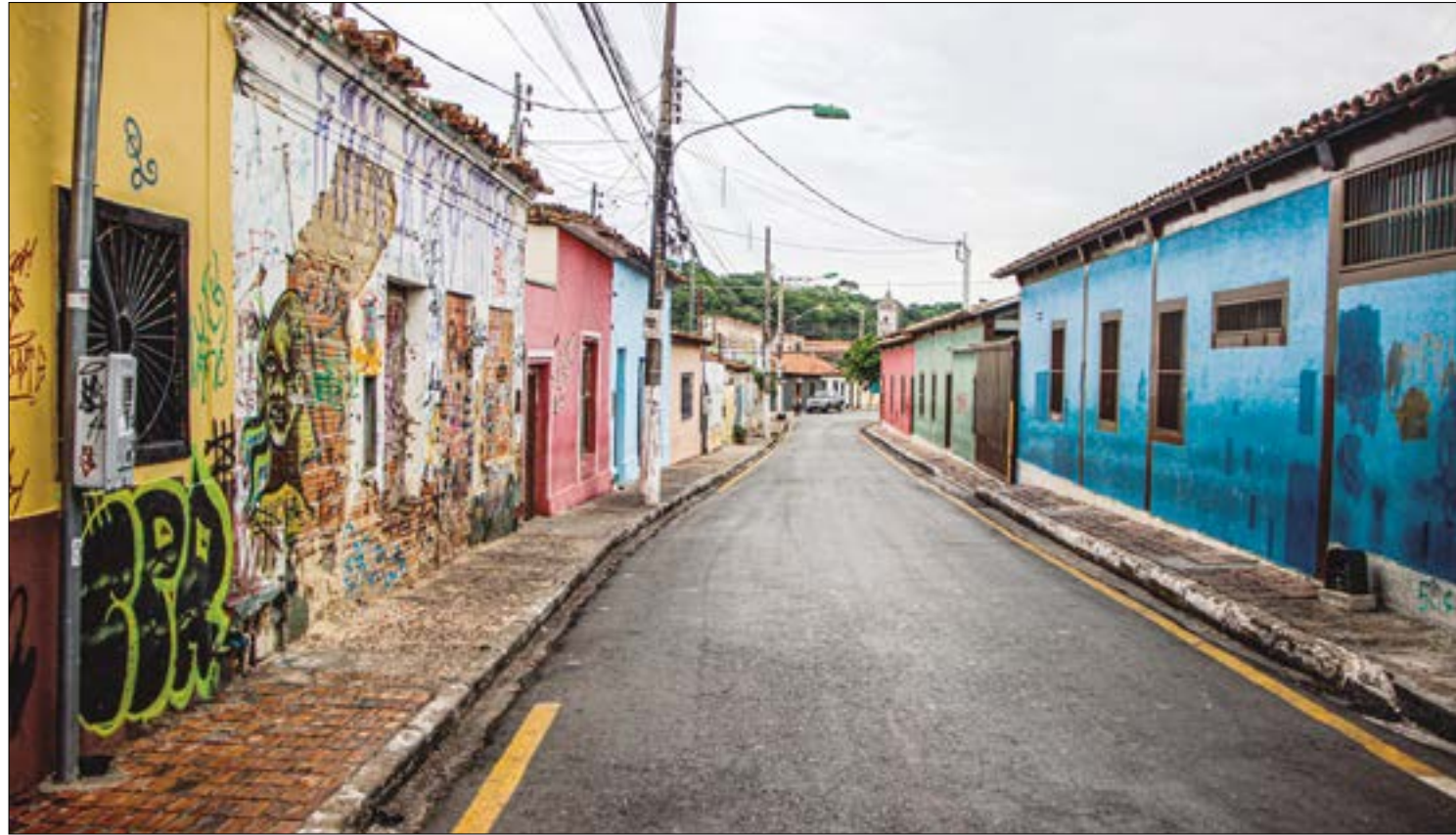
A ideia do Ministério Público é devolver o protagonismo ao Centro Histórico