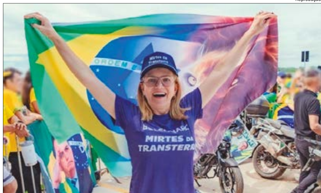
O débito da empresária, são oriundos de impostos municipais não recolhidos nos últimos anos