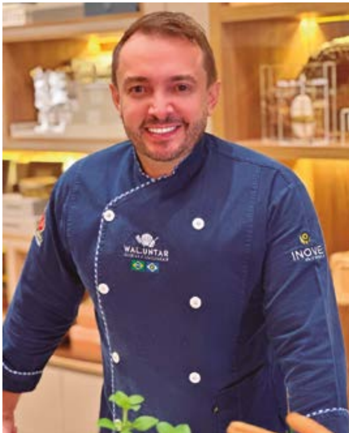
O famoso Chef Waldemar Untar que está preparando muitas novidades que em breve serão apresentadas no Programa Estilo. Aguardem!