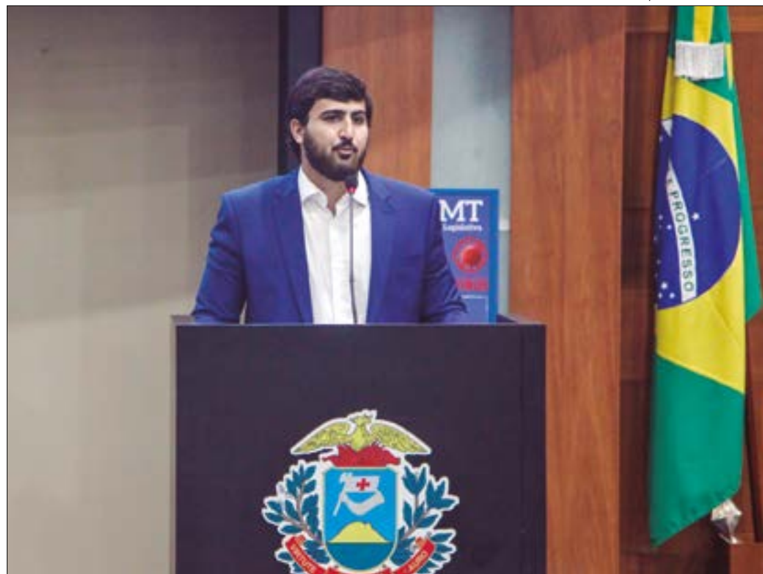
Emanuelzinho também afirmou que, além dos R$ 60 milhões, o governo federal pretende repassar R$ 4 milhões todos os meses para Cuiabá