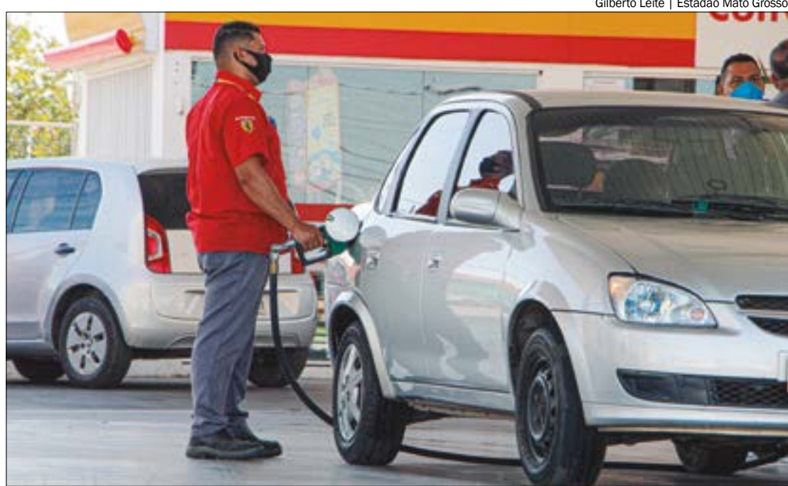
O levantamento mostrou que o maior recuo foi para os consumidores do óleo diesel que caiu R$ 0,11

ETANOL - O etanol praticamente se manteve estável em relação à segunda semana de maio. O combustível subiu de R$ 3,54 para R$ 3,55.