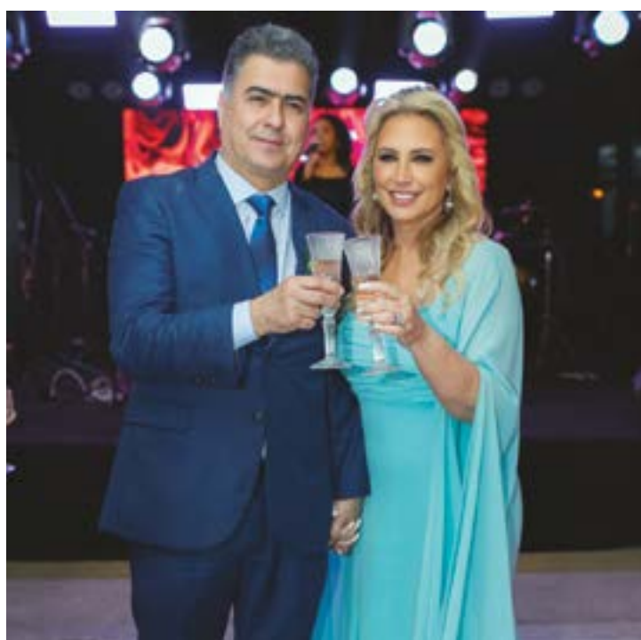
Prefeito Emanuel Pinheiro e a Primeira-dama Márcia Pinheiro