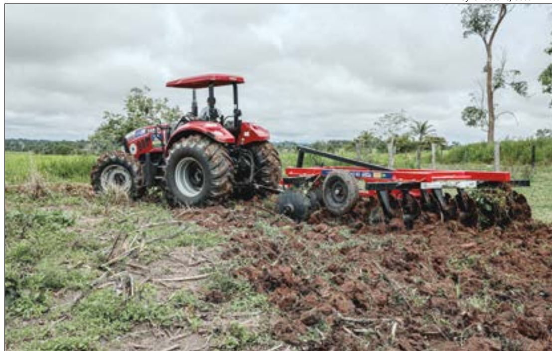
Os recursos do fundo serão destinados a operações de crédito, financiamento e subsídios diferenciados