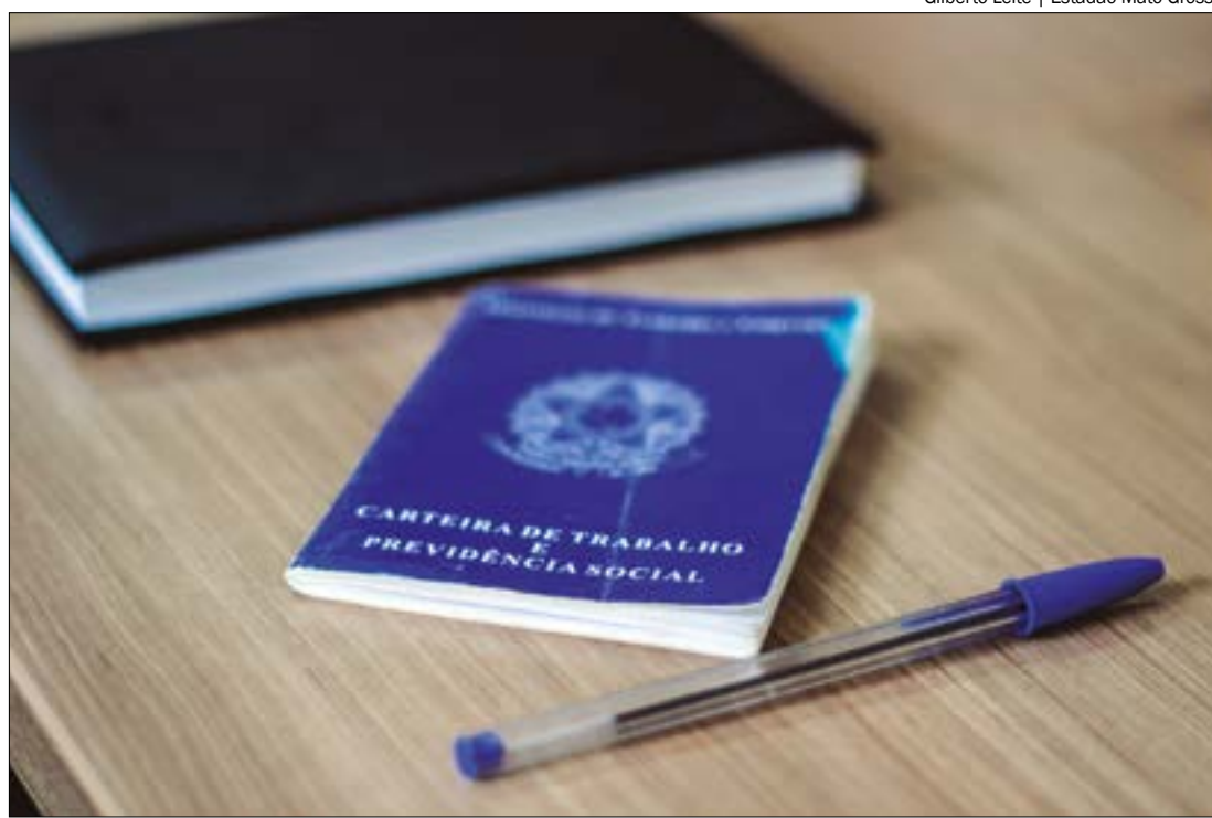
O desempenho de Mato Grosso vai na contramão do país, que teve aumento na taxa de desemprego em oito estados