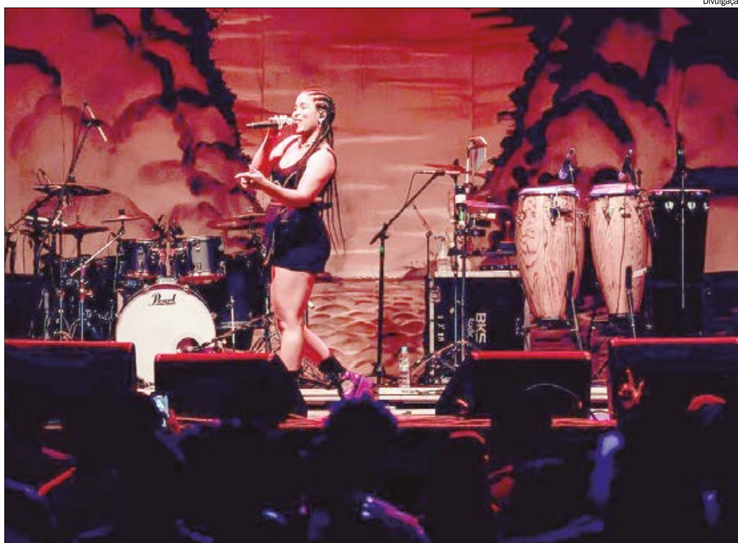
Drik Barbosa é uma artista brasileira que ficou conhecida pela participação na música Mandume, de Emicida

DRIK BARBOSA - Drik Barbosa é uma artista brasileira que ficou conhecida pela participação na música Mandume, de Emicida, entre outras parcerias com o artista. Em 2018, lançou o EP de rap Espelho, que também tem influências de soul, funk e