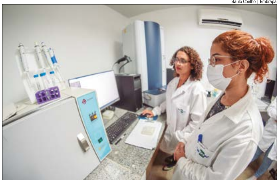
É de interesse trabalhos como bioinsumos, agricultura de baixo carbono, agricultura digital, gestão hídrica agrícola

A partir da assinatura, pesquisadores das duas instituições podem estabelecer projetos de cooperação técnica (PCT) ou científica (PCC), nas áreas estabelecidas, facilitando a atuação conjunta. Com duração prevista de dez anos, renovável por igual período, o memorando facilita o relacionamento entre a Embrapa e Inrae ao estabelecer diretrizes e dar oficialização jurídica.