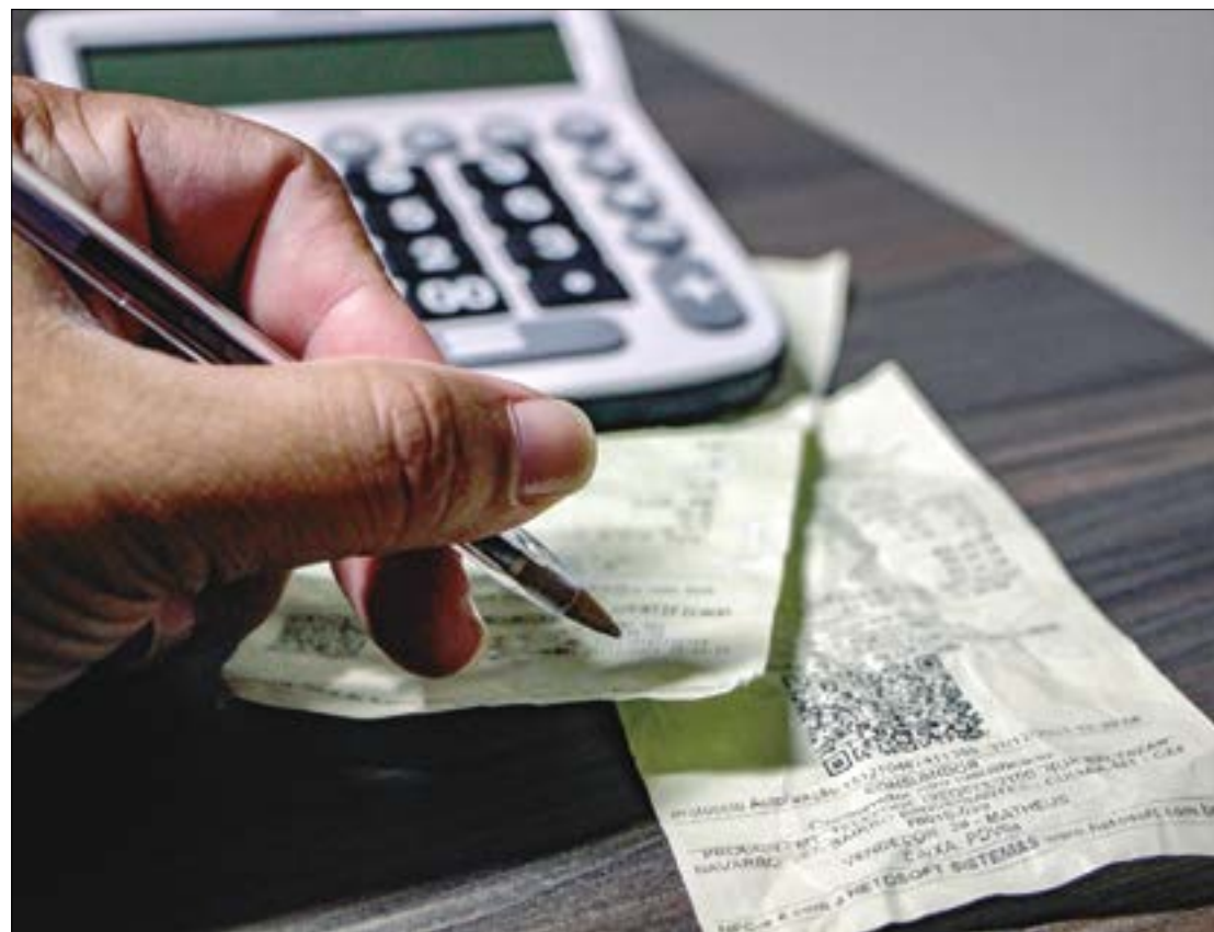
A projeção da semana passada era de que a Selic terminasse o ano em 9,75%