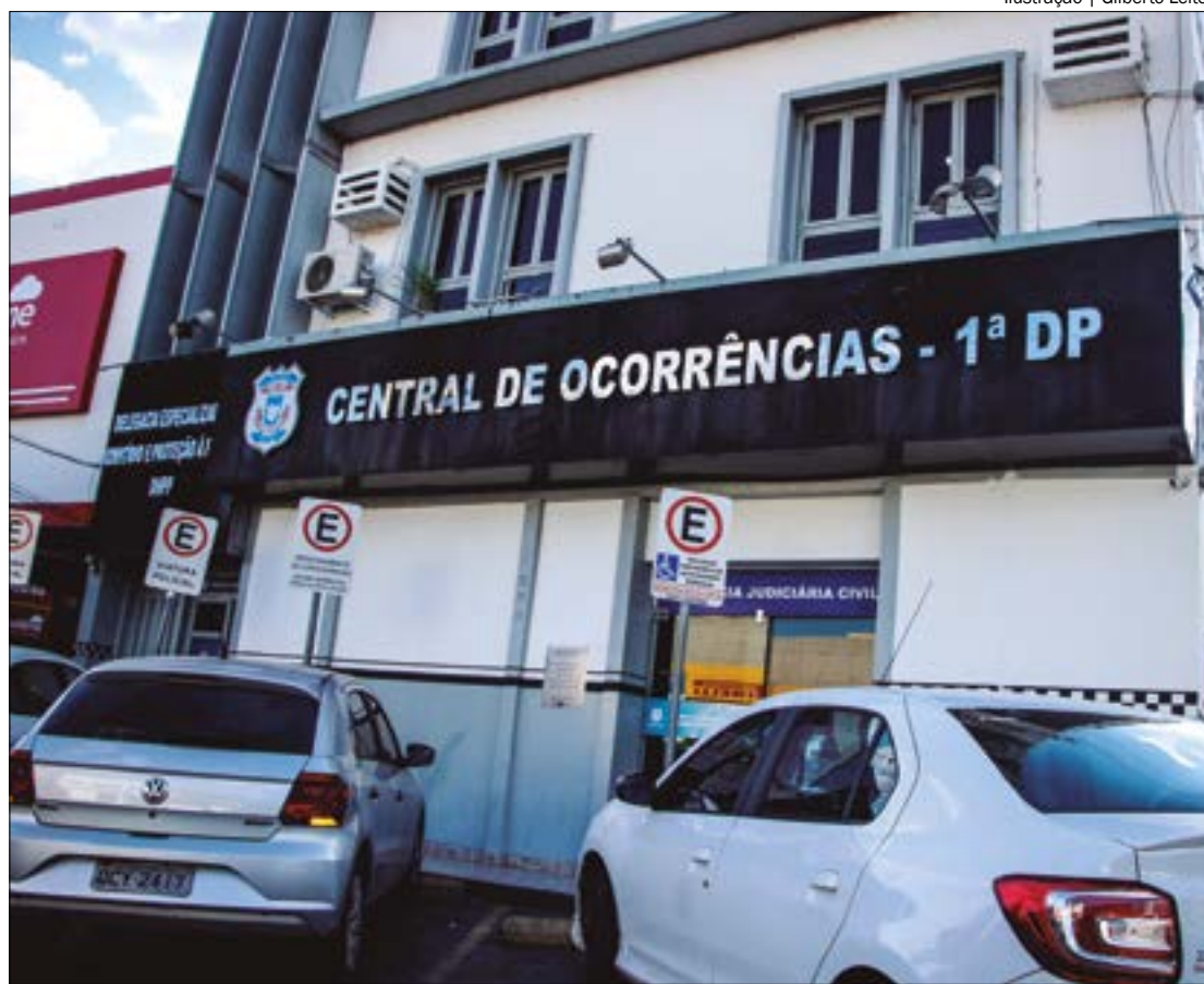
Ilustração | Gilberto Leite

Na sexta-feira, 17, a Polícia Civil divulgou a conclusão do inquérito e o indiciamento de duas pessoas por homicídio