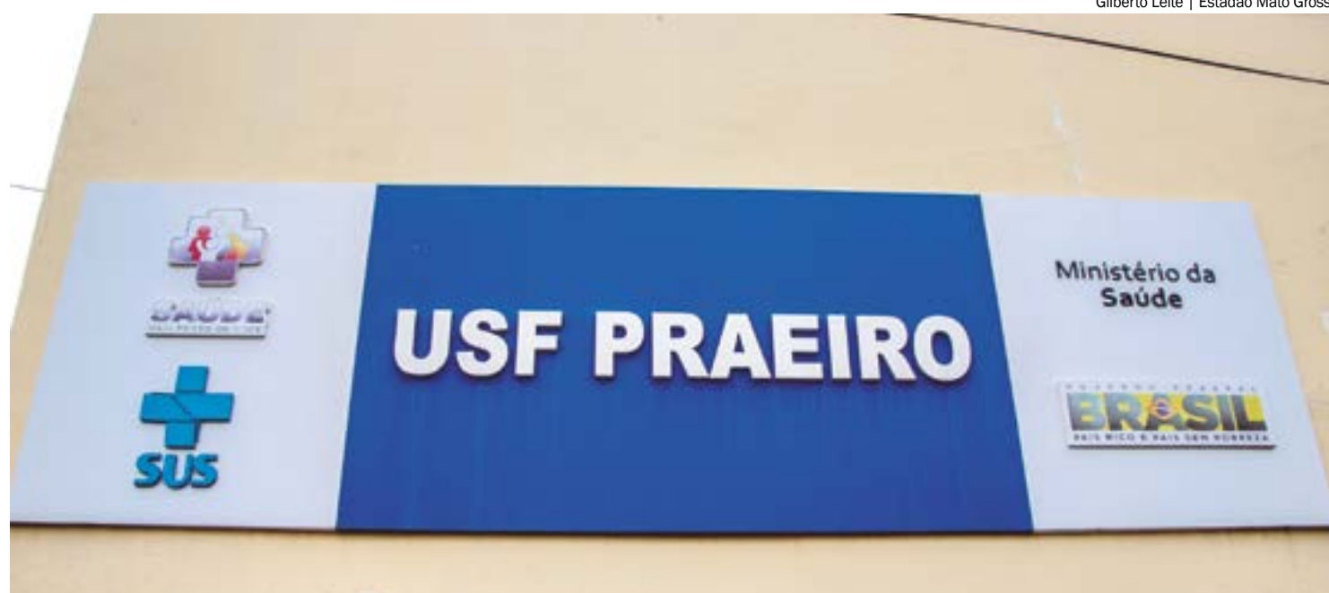
Repasse representa um incremento de 33% em relação ao ano passado. A iniciativa visa aprimorar o atendimento nas UBSs do estado

Toda a expansão resultou em um acréscimo de 16% no número de consultas médicas realizadas e de 29% nos dados de procedimentos em relação a 2022. Com o novo modelo, será valorizada a qualidade do atendimento realizado na atenção primária e as pessoas irão avaliar como foi esse atendimento.