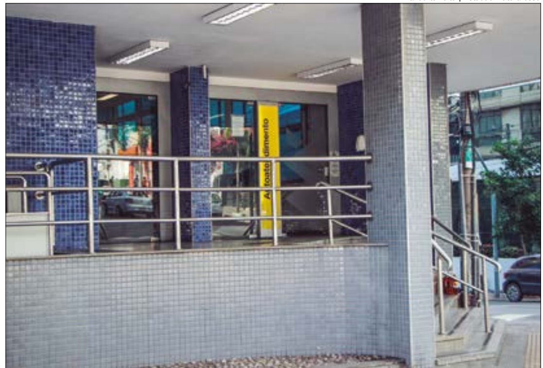
Gilberto Leite | Estadão Mato Grosso

— bronze, prata e ouro — podem visualizar as ofertas de negociação e parcelar o pagamento. Caso o cidadão opte por canais parceiros, não há necessidade de uso da conta Gov.br