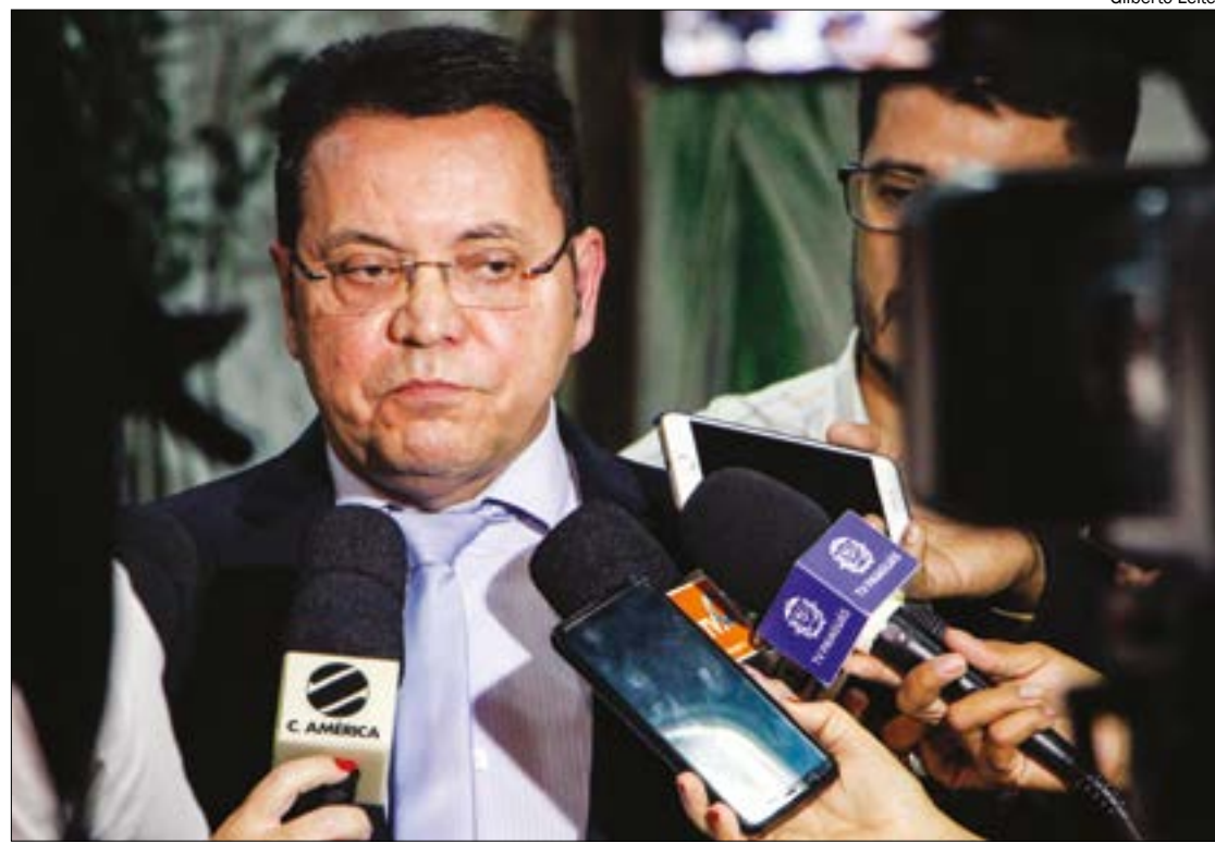
Presidente da AL critica ação de produtores contra o Fethab: “é mais uma prova de que eles não querem contribuir com o Estado”

A arrecadação de Mato Grosso com o Fethab em 2019 ultrapassou R$ 1,5 bilhão. Em 2020, a previsão é que atinja até R$ 2 bilhões.