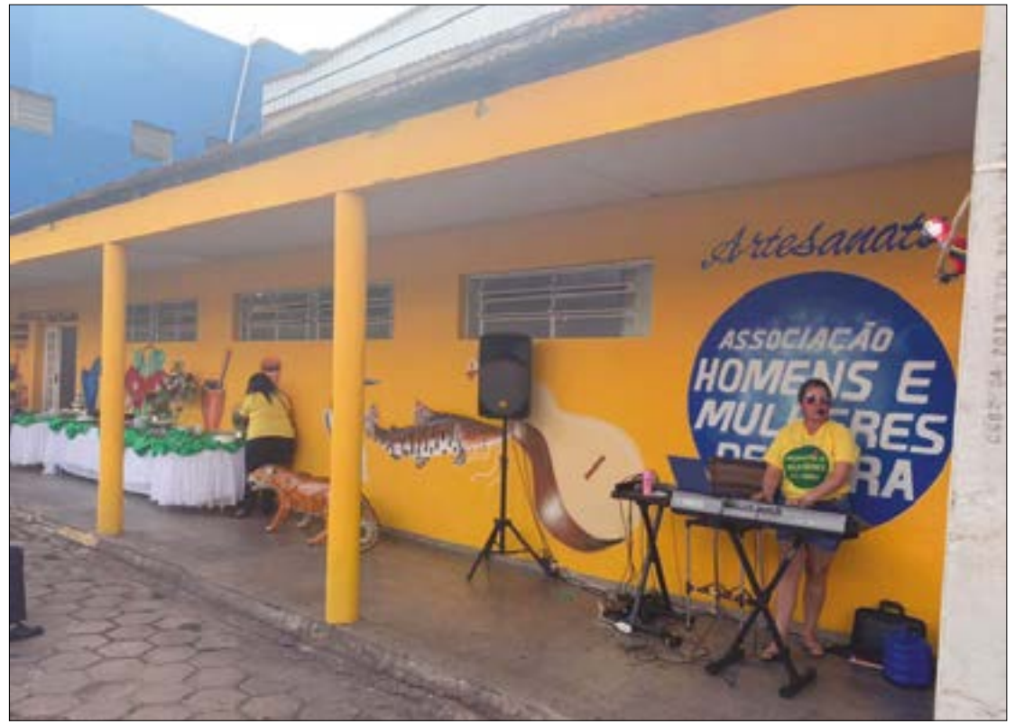
A empresa tem 120 dias para apresentar o levantamento, que deve contar com informações técnicas, econômicas, financeiras e jurídicas

(Com informações da Assessoria de Imprensa)