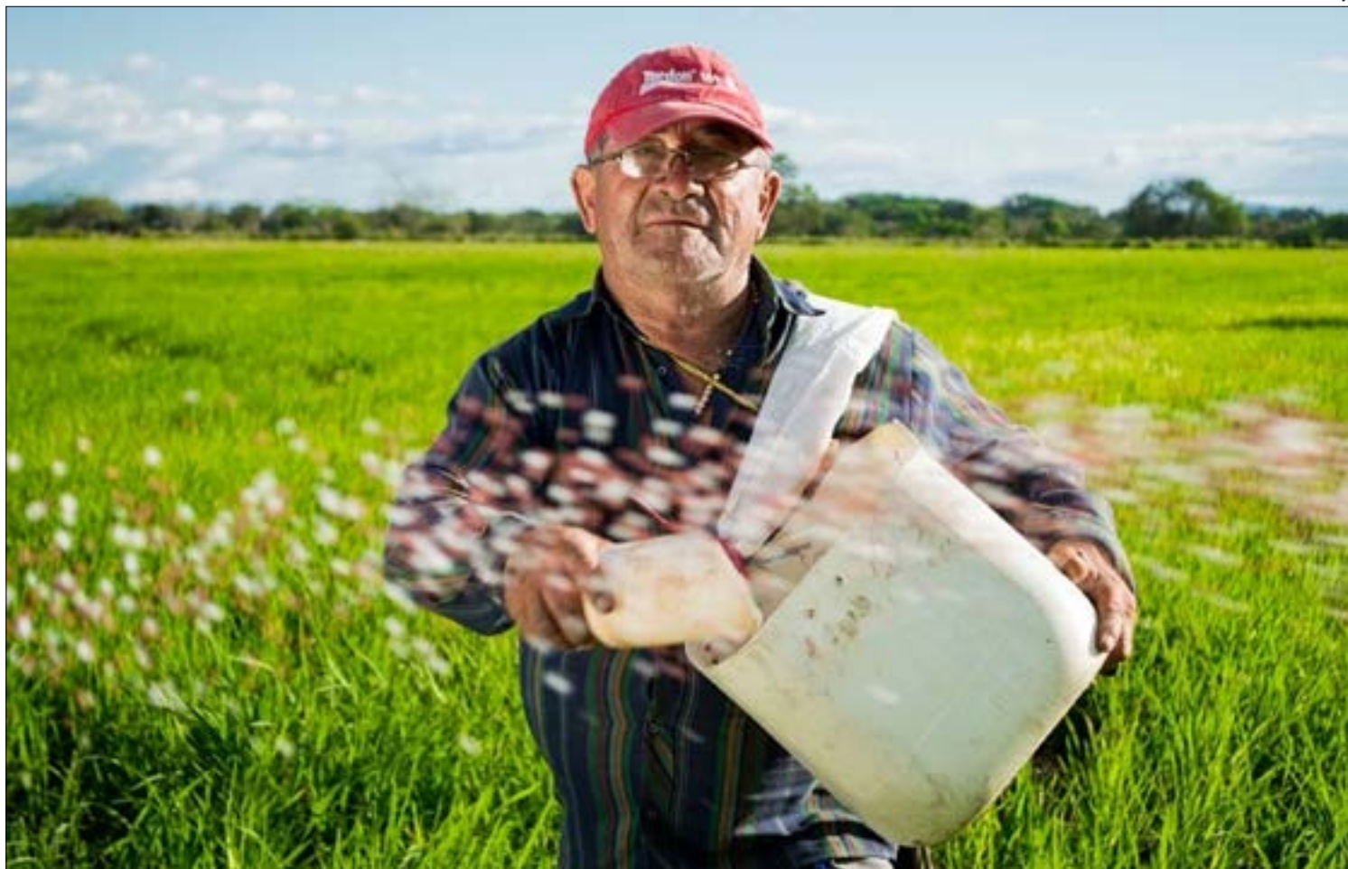
Indústria faz estoque garantir arroz até a próxima safra, mas preço pode mudar nos próximos 30 dias

Mesmo ocupando a segunda colocação no ranking de produção de arroz do país, Mato Grosso produz bem menos do que suas indústrias são capazes de processar. O parque industrial tem capacidade de beneficiar mais de 700 mil toneladas, mas a produção local alcança pouco mais da metade, cerca de 55%. No ano passado, o estado produziu 380 mil toneladas de arroz.