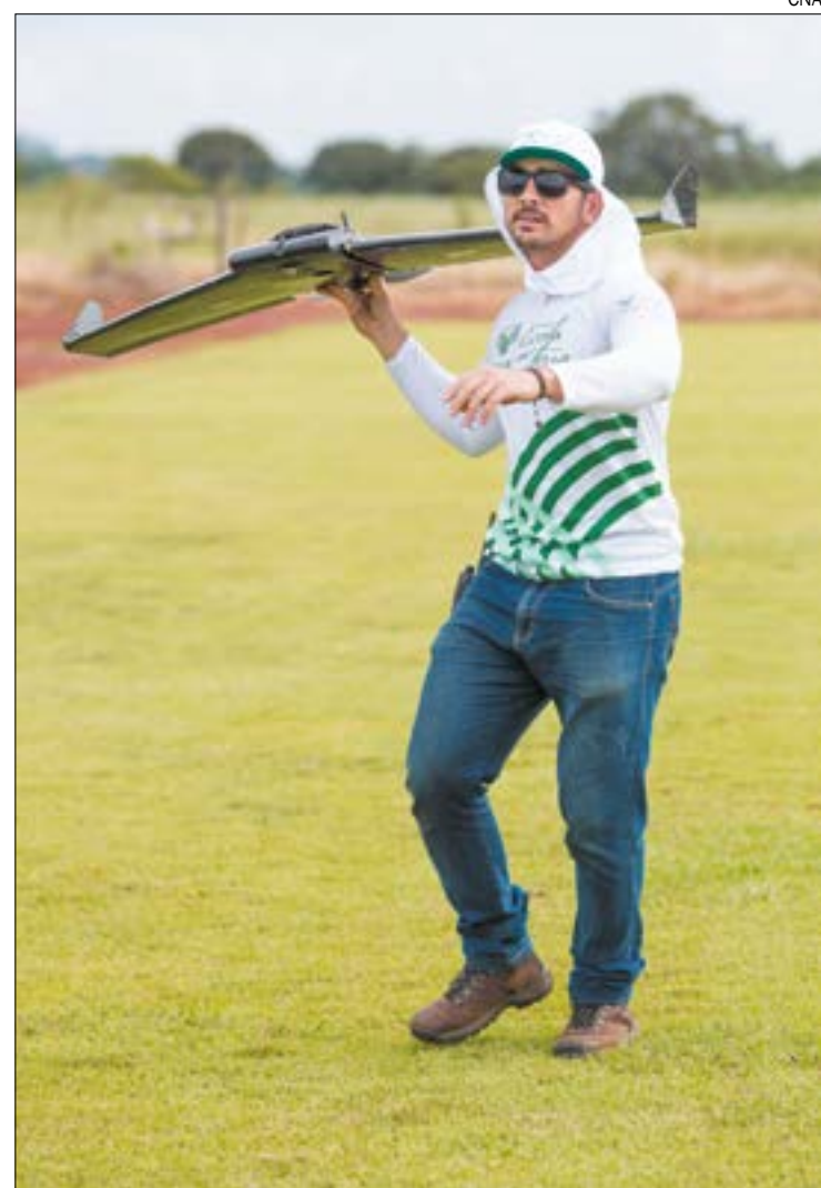
Curso de operação e manutenção de drones é um dos mais procurados no Senar