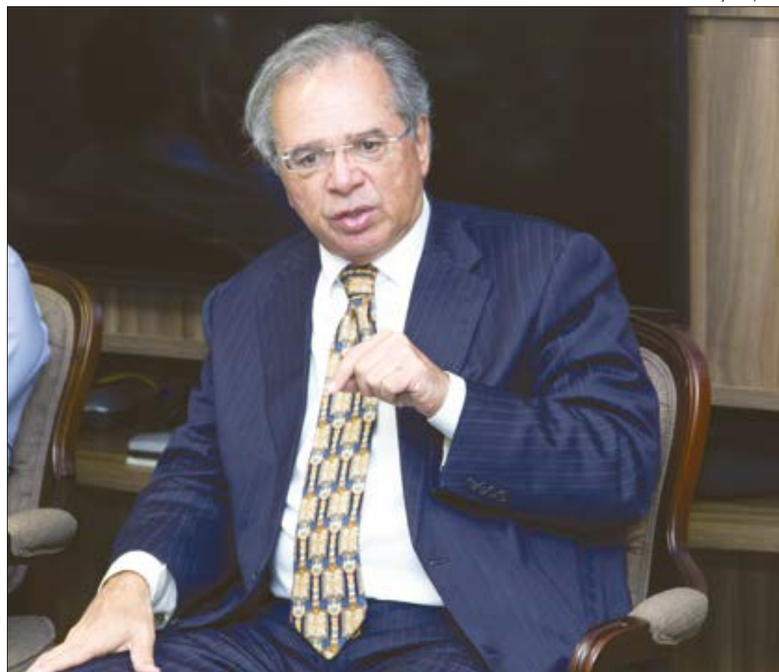
Ministro Paulo Guedes diz que enviará proposta da reforma tributária em duas semanas

Fonteles acrescentou que a reforma tributária gera necessidade de compensação para alguns estados e municípios e isso poderá ser resolvido com uma descentralização de recursos.