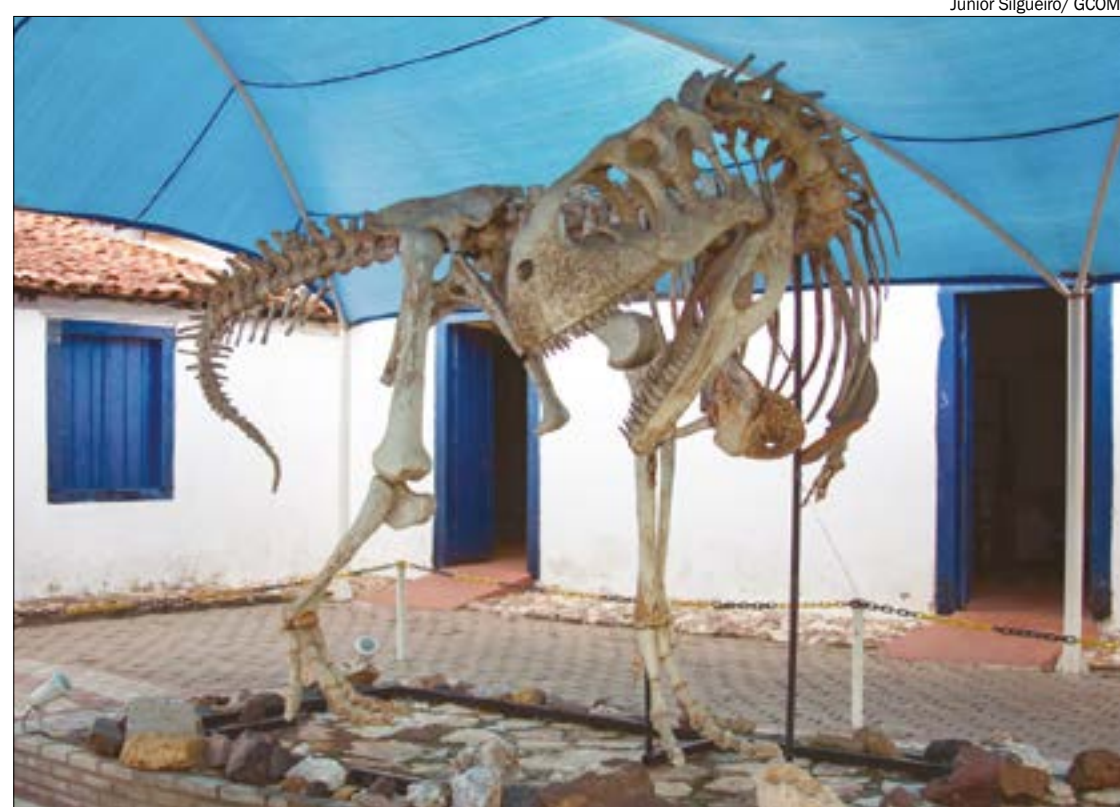
A programação conta com diversas atividades gratuitas e outras a preços populares

(Com informações da Assessoria de Imprensa)