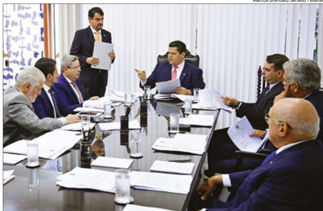
Mesa Diretora do Senado está dividida quanto à execução da cassação de Selma Arruda