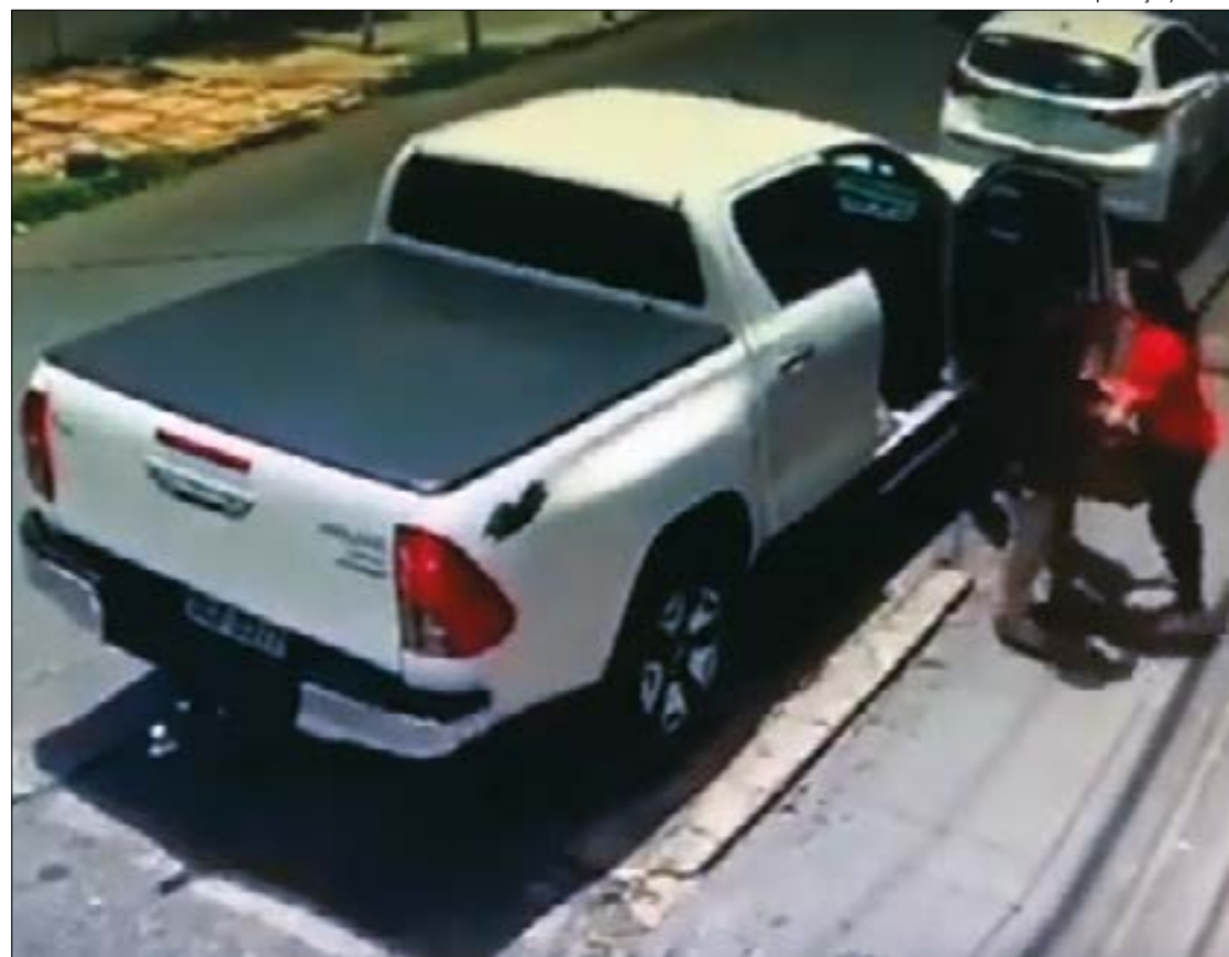
Nas imagens gravadas pela câmara de segurança é possível ver toda a ação dos assaltantes que agem com violência contra as duas mulheres