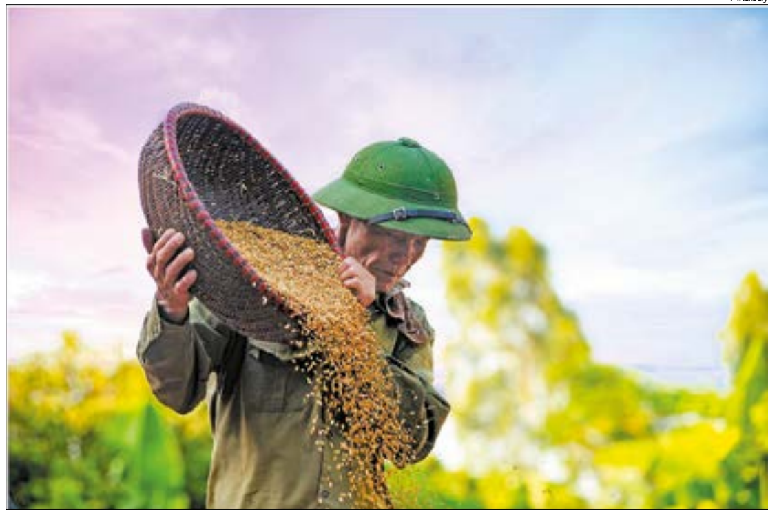
Safra deste ano é estimada em 400 mil toneladas, das quais Mato Grosso consome apenas 250 mil