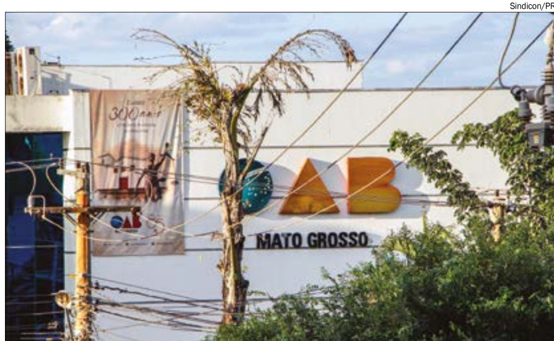
Advogados que integram o Conselho Federal agora poderão concorrer à vaga de desembargador