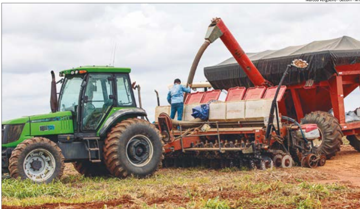
Marcos Vergueiro - Secom - MT

“Esse cenário foi pautado pela falta de chuva no período de desenvolvimento das lavouras com cultivares de ciclos pre-