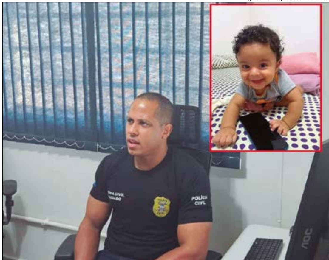
O delegado não deu detalhes sobre os possíveis indiciamentos, mas afirmou que irá indiciar os responsáveis por homicídio culposo

“Pelos crimes culposo e provavelmente falsidade ideológica. A gente está juntando essa documentação para ver se consegue finalizar direitinho”, disse.