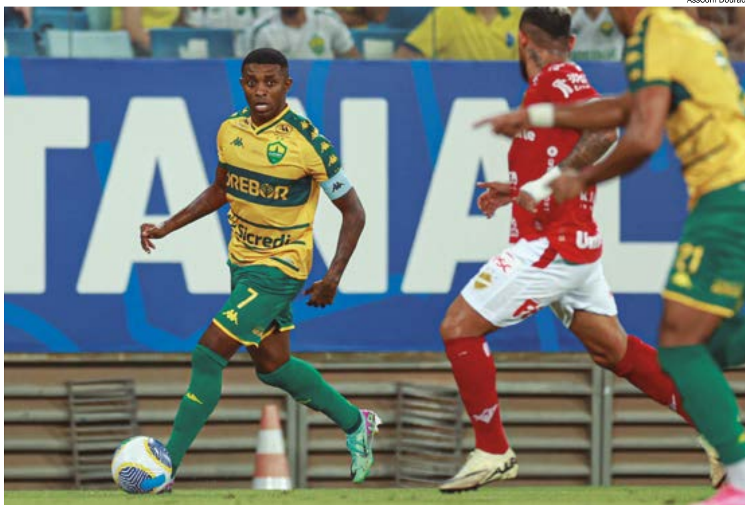
Cuiabá chegou a abrir quatro gols de vantagem, mas desgaste físico pesou e levou à eliminação na Copa Verde

Apesar do controle exercido pelo Cuiabá na primeira parte do jogo, o Vila Nova encontrou espaço para reagir na segunda etapa, explo-