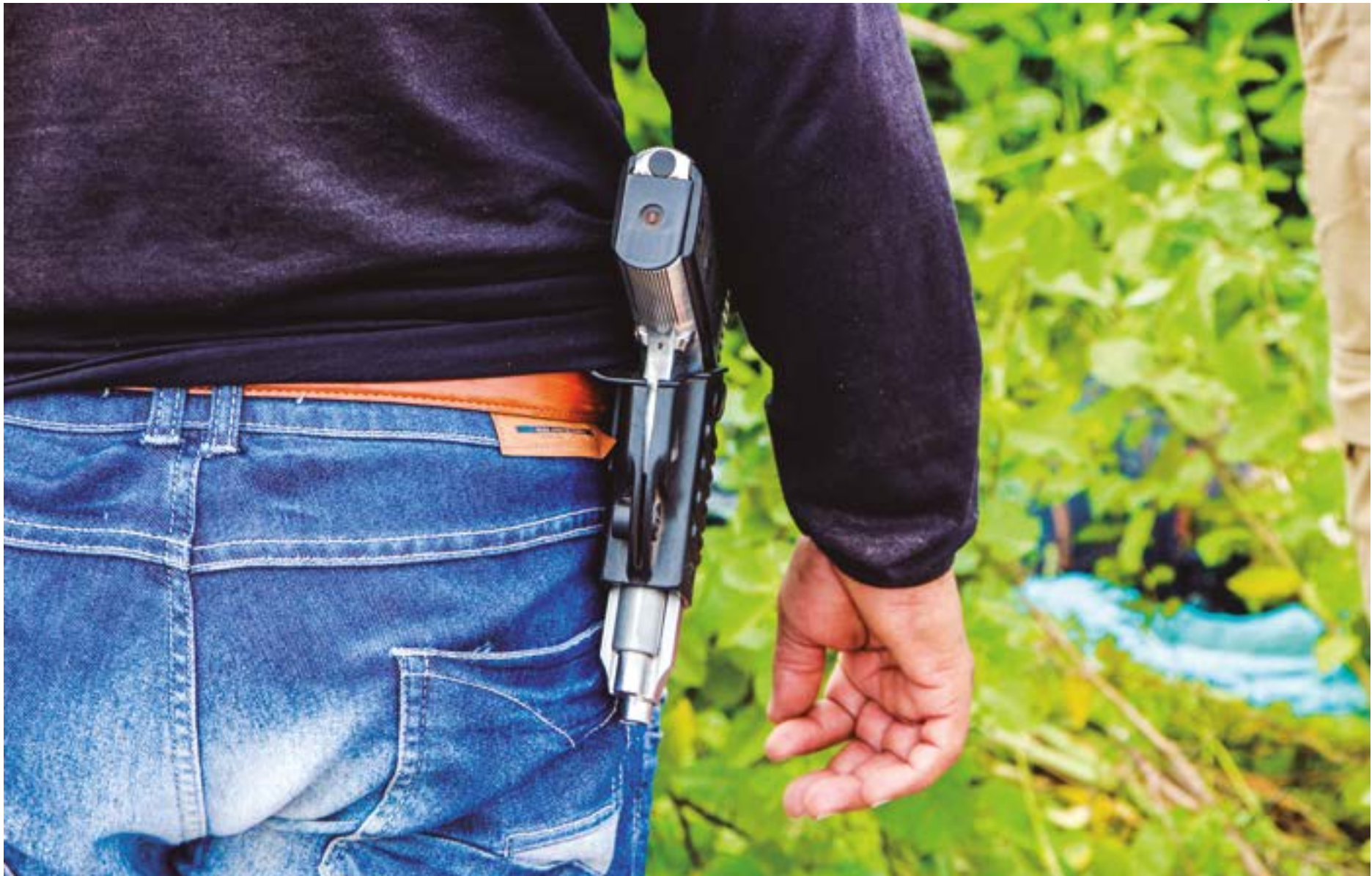
Ilustração | Gilberto Leite