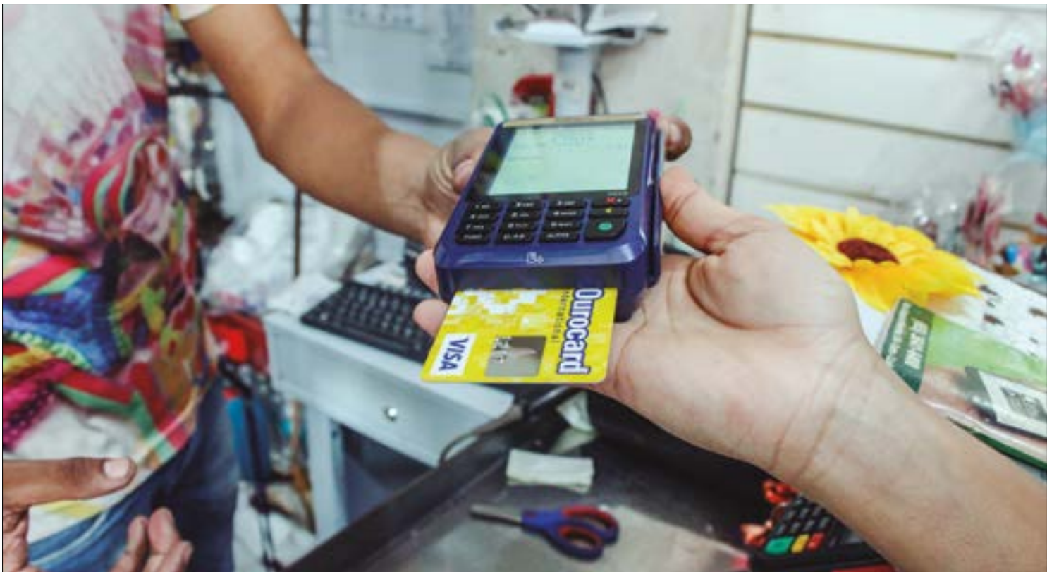
O cartão de crédito segue como principal tipo de dívida das famílias, respondendo por 82,3% dos endividados

Dos lares com dívidas parceladas, 43,8% afirmaram estar pouco endividados, enquanto 33,7% se consideraram mais ou menos endividados, e 10,0% declararam estar muito endividados. Apesar desse recuo nos números gerais, o índice de endividamento