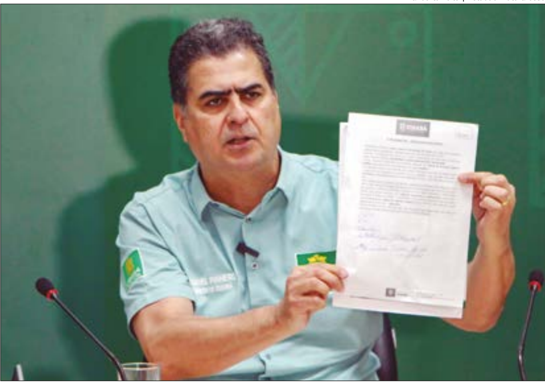
Gilberto Leite | Estadão Mato Grosso