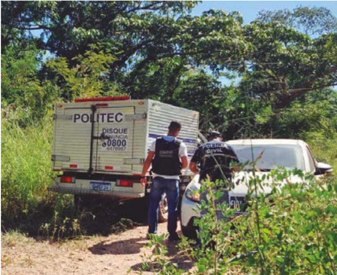
João Carlos | Estadão Mato Grosso

Celso foi visto pela última vez ao sair de sua residência, no bairro Dom Aquino, com destino a Santo Antônio do Leverger, onde iria passar o final de semana. Celso di-