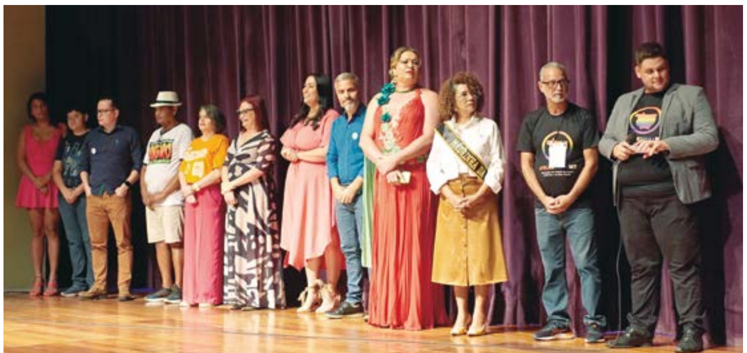
Autoridades e representantes de classes presentes no Evento de Lançamento da 21ª Parada do Orgulho de MT