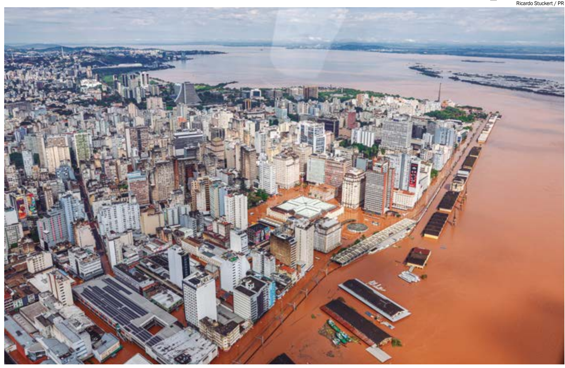
Ricardo Stuckert / PR