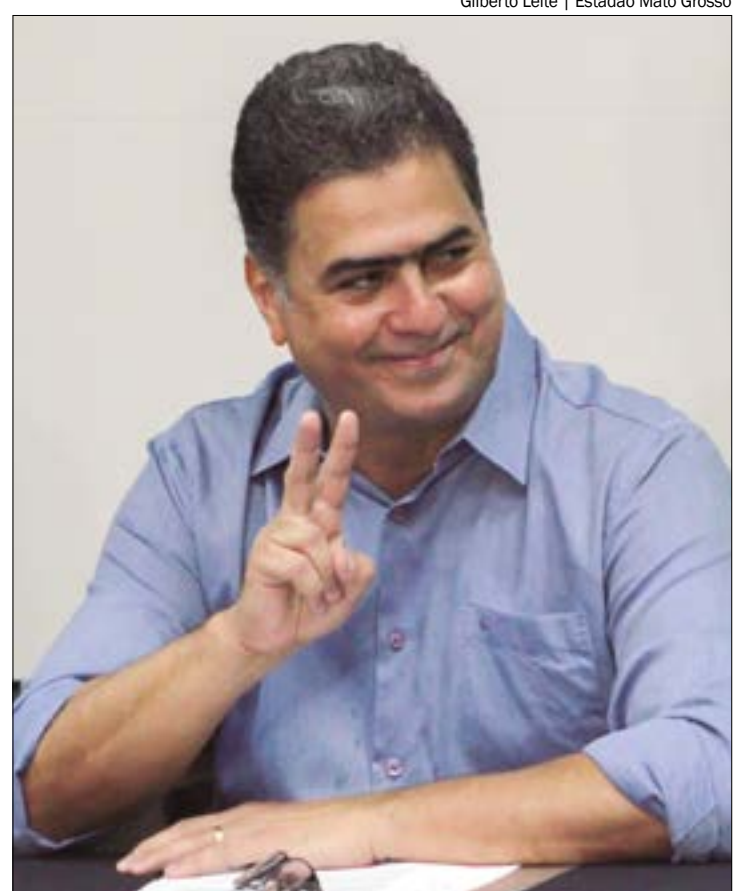
A defesa do prefeito Emanuel Pinheiro apontou uma série de erros e inconsistências no processo do TCE

No relatório do Ministério Público de Contas (MPC), a dívida consolidada líquida da Prefeitura de Cuiabá alcançou R$ 1,2 bilhão no ano de 2022, registrando um aumento de 255% no período entre 2017 e 2022. O MPC emitiu parecer favorável pela reprovação, apresentando quatro irregularidades "graves" e uma "gravíssima" durante o exercício passado. A Prefeitura chegou a apresentar defesa para cada um dos pontos, mas as considerações foram mantidas.