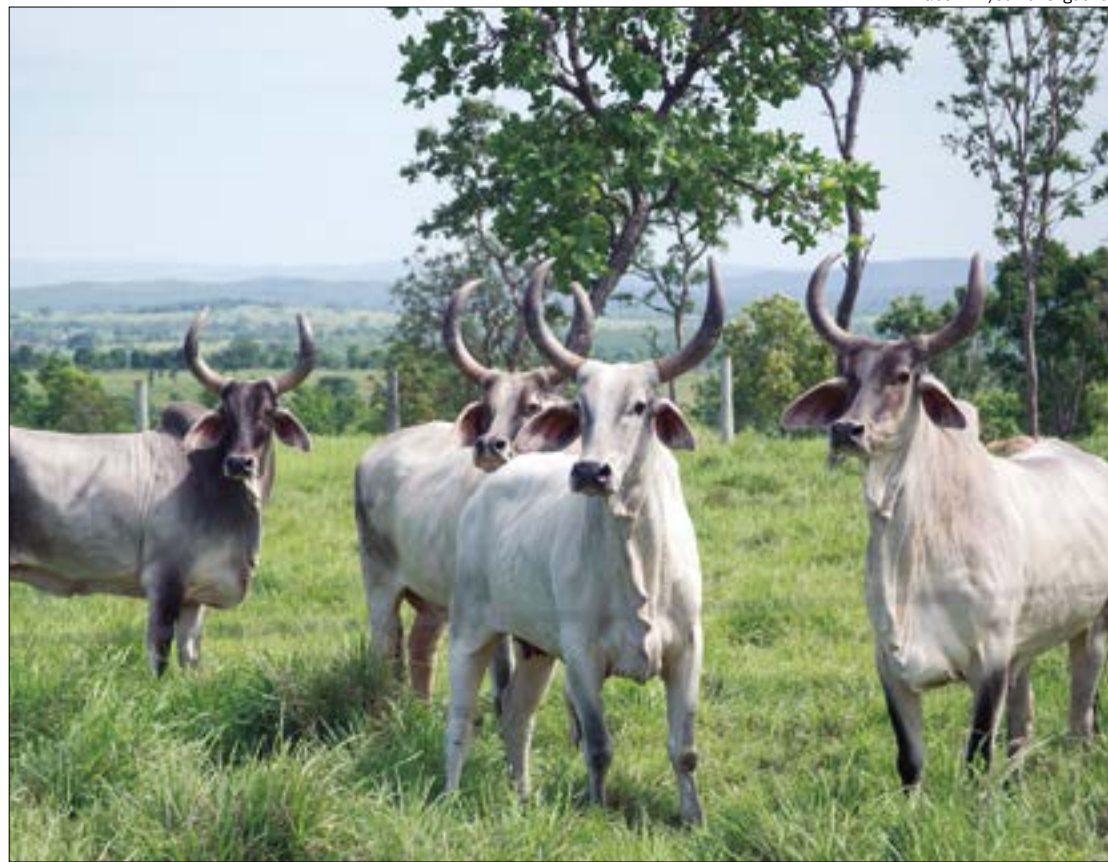
A medida substituiu a vacinação contra a febre aftosa e serve de base para que o Governo do Estado possa planejar futuras ações

Na última campanha realizada pelo Indea, em novembro de 2023, houve o registro de 126.441 estabelecimentos rurais. Além disso verificou-se a existência de 34,1 milhões de bovinos, 56,5 milhões de peixes, 33,2 milhões de aves comerciais, 1,6 milhão de suínos tecnificados e 450 mil equinos.