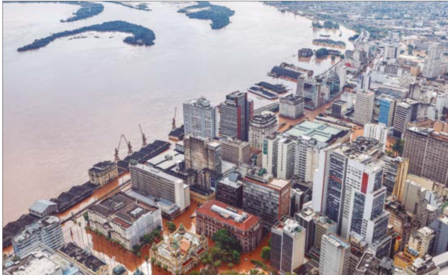
O auxílio vai usar os recursos arrecadados pelo Fethab, que recebe contribuições do setor produtivo