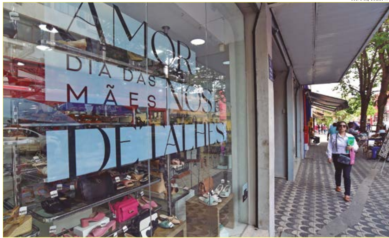
Para economizar e evitar cair em armadilhas, consumidor pode utilizar ferramentas de comparação de preços e de avaliação de produtos

"Sendo uma das datas comemorativas mais importantes do ano, o cenário da pesquisa se mostra bastante positivo, visto que há um aumento na pretensão de gastos, mas há também uma diversificação nos produtos a serem consumidos,