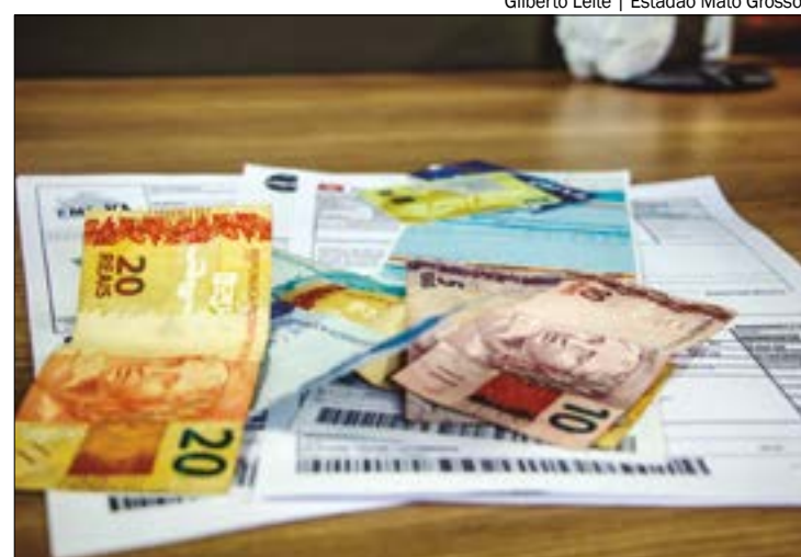
No mesmo mês do ano passado, as contas públicas registraram um déficit de R$ 14,2 bilhões

Essa evolução no mês decorreu do efeito dos juros nominais apropriados (aumento de 0,6 p.p.), do resgate líquido de dívida (redução de 0,2 p.p.), e da variação do PIB nominal (redução de 0,2 p.p.). No ano, o aumento de 1,3 p.p. do PIB decorre principalmente da incorporação de juros nominais (aumento de 1,9 p.p.), da emissão líquida de dívida (aumento de 0,3 p.p.), e do crescimento do PIB nominal (redução de 1,2 p.p.).