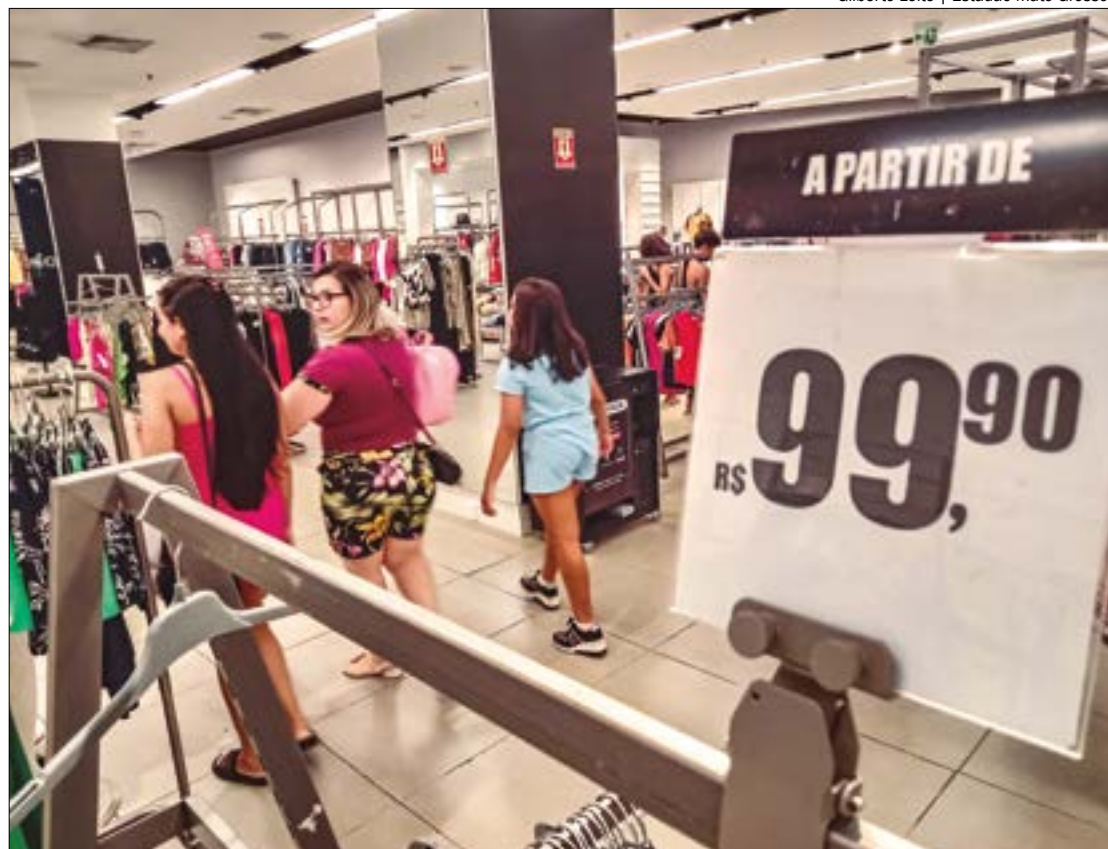
Peças de vestuário e acessórios de moda (18,8%), almoço em restaurantes (7%) e calçados (5,5%) estão entre presentes

Os clientes também farão menos compras a prazo, conforme indica o estudo. Criado há quase 6 anos, o Pix será a modalidade de pagamento mais acessada (32,5%) pelos consumidores. Ao todo, 63,8% das pessoas resolverão suas