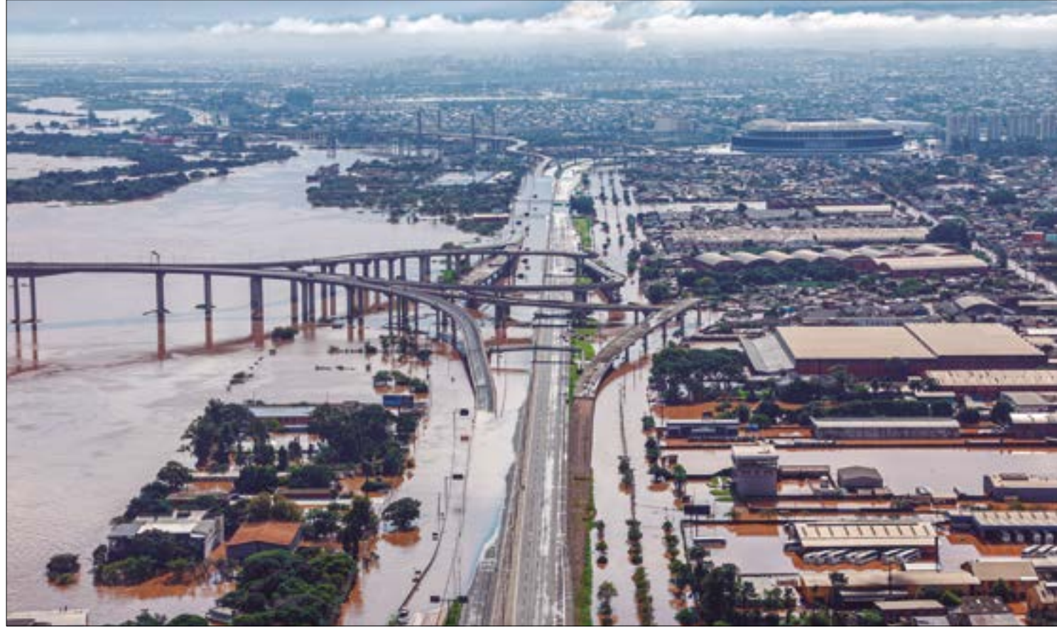
O governador Mauro defenderá ao setor produtivo e à ALMT a liberação de repasse emergencial oriundo do Fethab