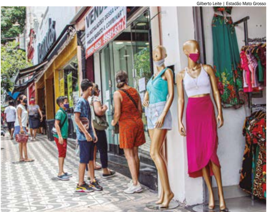
Gilberto Leite | Estadão Mato Grosso