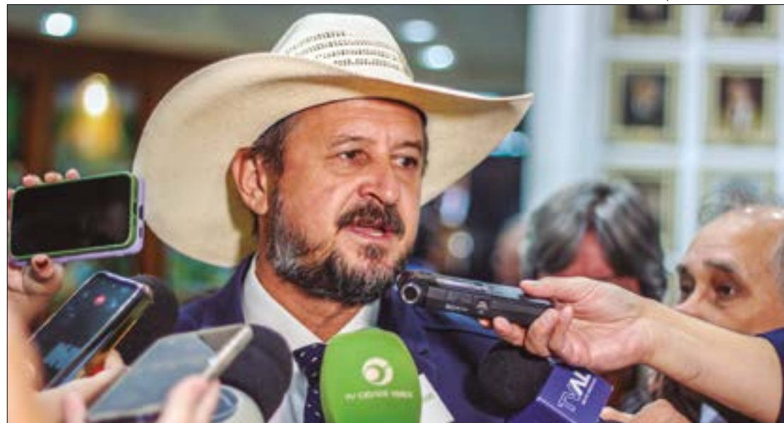
Apesar de ser contra demarcação de terras, deputado defende que indígenas tenham liberdade para produzir