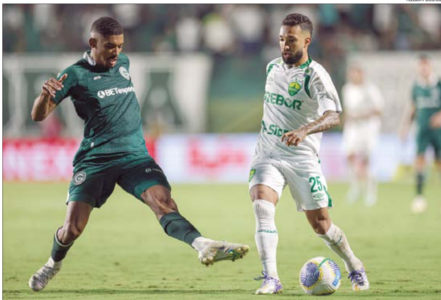
Derrota do Cuiabá para o Goiás mostra que técnico terá muito trabalho para ajustar o time

Com a chegada de Petit, espera-se uma mudança de postura e estratégia por parte do Cuiabá. O treinador terá a difícil missão de encontrar soluções para os problemas defensivos e