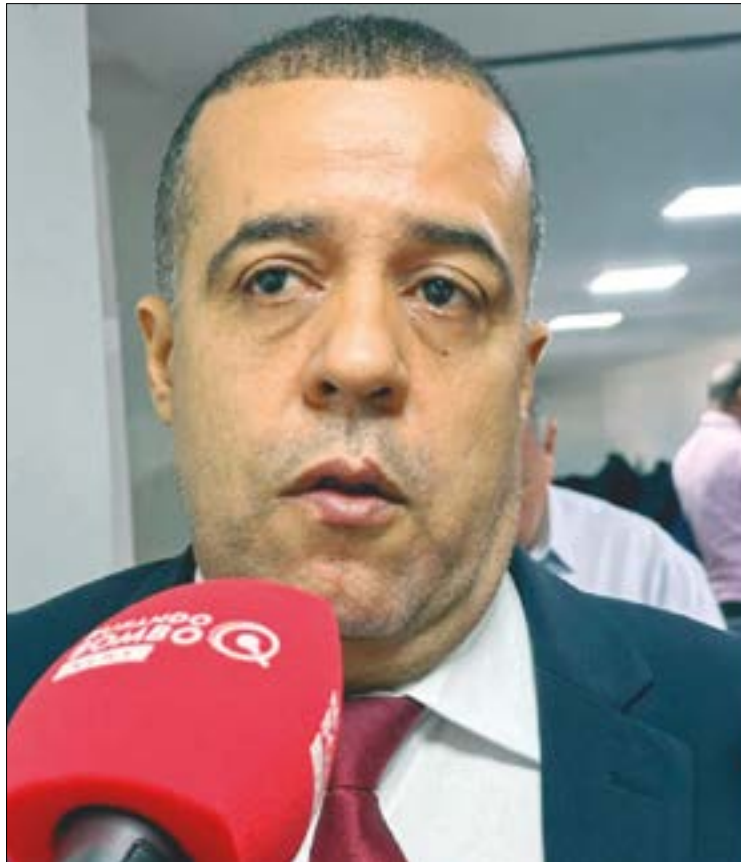
Segundo Kero Kero, a petista colocou todo processo contra Emanuel em risco para escapar da própria cassação

a renúncia. [...] Então, dois votos, ok, e ela não tinha feito nenhuma renúncia. Tava esperando que ela viesse participar. Agora ela renuncia e quer que eu faça oitiva? Então ela quer enterrar de vez a processante?", questionou.