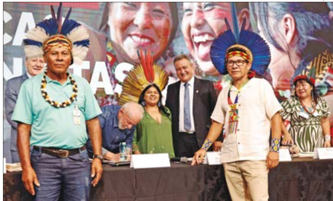
Ricardo Stuckert / PR