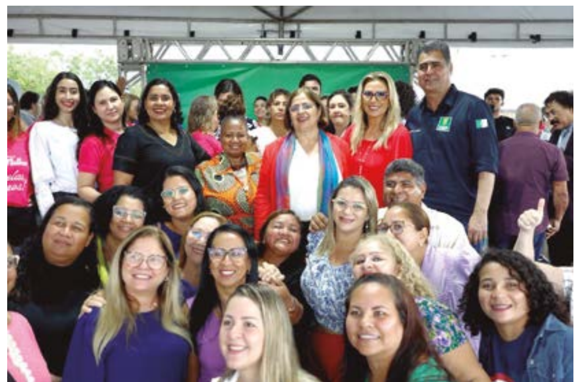
Funcionários da Prefeitura de Cuiabá, em especial da Secretária de Assistência Social, Direitos Humanos e da Pessoa com Deficiência