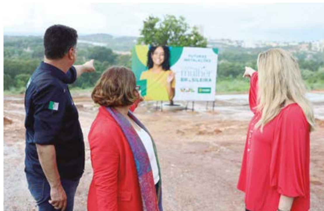
Primeira-dama Márcia Pinheiro visita o terreno dedicado à construção da Casa da Mulher Brasileira em Cuiabá, junto com a ministra da Mulher, Cida Gonçalves, e o prefeito Emanuel Pinheiro

A ministra da Mulher, Cida Gonçalves, veio a Cuiabá para uma visita técnica ao terreno onde será construída a Casa da Mulher Brasileira, um dos nove espaços no Brasil que oferecerá serviços especializados para os mais diversos tipos de violência contra as mulheres: acolhimento e triagem; apoio psicossocial; delegacia; Juizado; Ministério Público, Defensoria Pública; promoção de autonomia econômica; cuidado das crianças com brinquedoteca; alojamento de passagem e central de transportes.