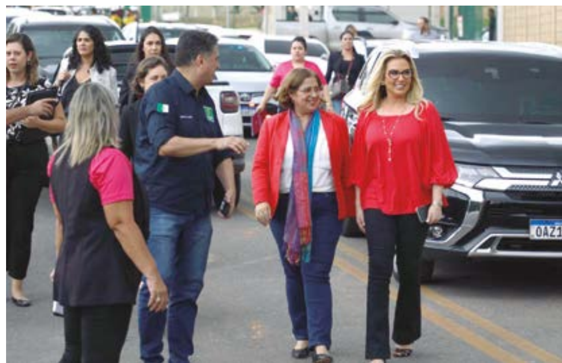
A ministra garantiu a Cuiabá o montante de R$ 5 milhões para manutenção e administração da Casa da Mulher Brasileira, visando a parceria com a Prefeitura