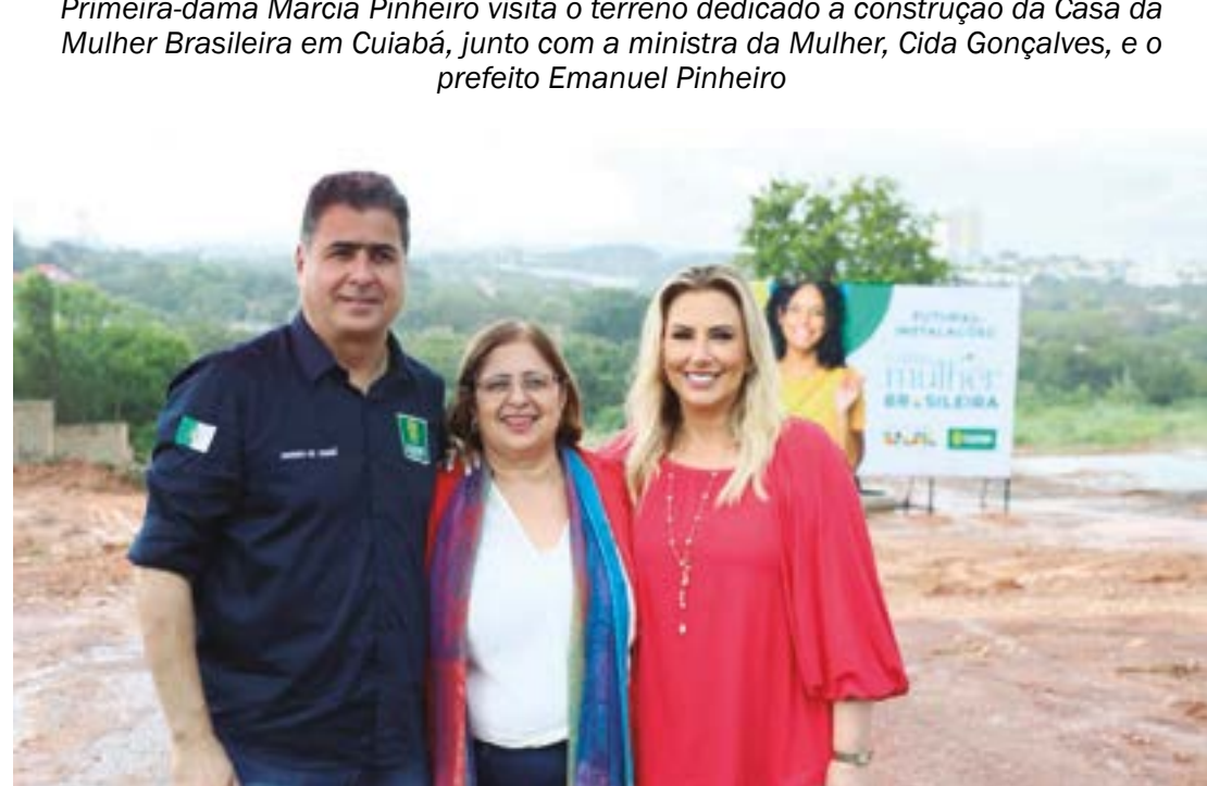
O prefeito Emanuel Pinheiro, ao lado da ministra Cida Gonçalves e da primeira-dama Márcia Pinheiro