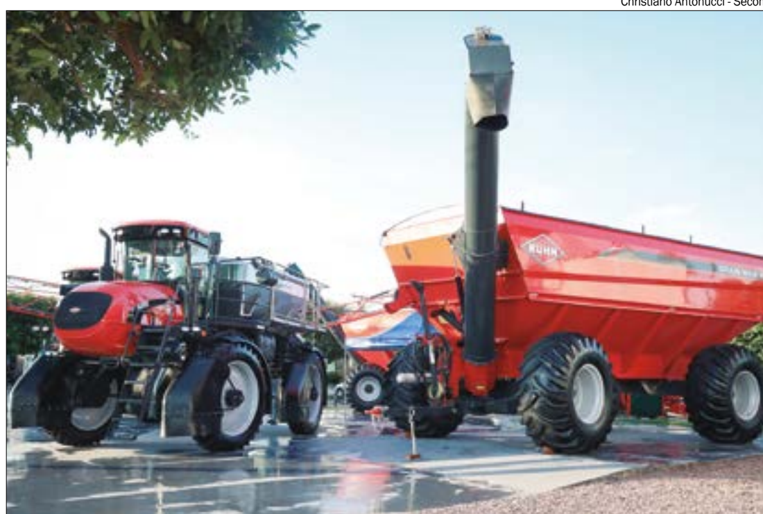
Feiras agropecuárias da região Centro-Oeste movimentam mercado de venda de veículos e devem gerar R$ 5 bi em negócios

Veículos e Mônaco Moto-center. Ou seja, são diversas opções para atender aos diferentes perfis de consumidores que passam por estes eventos", avalia Denardin.