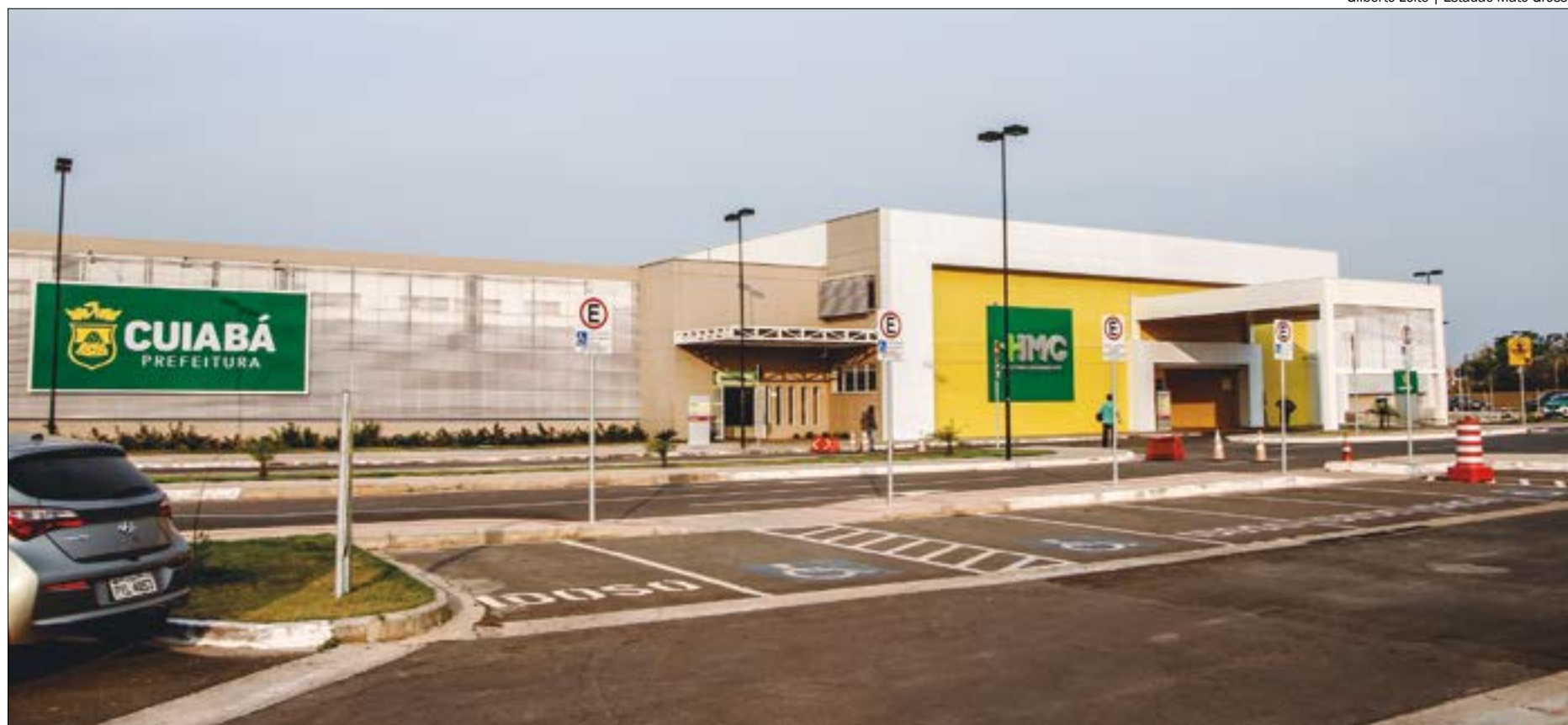
Segundo o TCE-MT, os atendimentos no Hospital Municipal de Cuiabá, o HMC, e no Hospital São Benedito estão comprometidos

"Uma resolução para o problema envolve a cooperação do Governo do Estado. O TAC exige ações que a gestão não consegue adotar. Então, essa mesa técnica vai buscar caminhos, porque hoje, lamentavelmente, a situação é de caos total na Saúde de Cuiabá. Todos os entes têm que entender que é preciso cuidar das pessoas. Enquanto discutimos isso, as pessoas continuam nas filas das unidades de saúde", declarou o conselheiro-presidente,