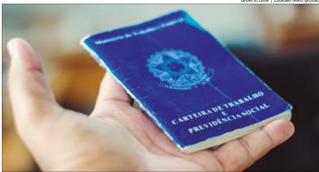
Além dos serviços financeiros, as áreas de logística e tecnologia serão as que mais vão absorver novos profissionais

Fundado em 1999 e presente em 18 países, o Mercado Livre superou a marca de 58 mil colaboradores diretos na região, mais de 22 mil apenas no Brasil, seu principal mercado.