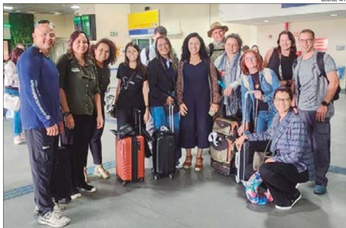
Grupo de 12 empresários do setor de Turismo de Mato Grosso participam da feira em busca de novas oportunidades