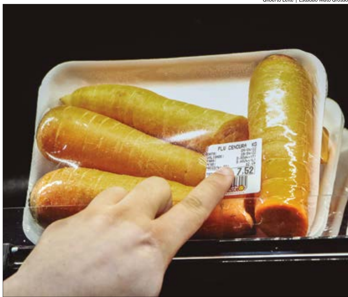
A cenoura ficou mais barata no último mês influenciada pela maior oferta da raiz nos entrepostos

No acumulado do primeiro trimestre de 2024, o volume total de exportações foi de 239,4 mil toneladas, representando uma queda de 5,88% em relação ao primeiro trimestre de 2023. No entanto, o faturamento foi de US$ 284,7 milhões (FOB), um aumento de 12,31% em relação ao mesmo período do ano anterior e de 25,61% em relação a 2022.