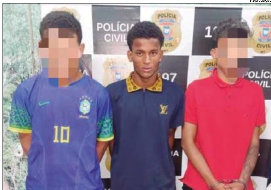
Matador de motoristas de aplicativo criou vício por assassinatos para "vingar" o irmão, diz delegado

Os três motoristas de aplicativo que estavam desaparecidos nos últimos dias foram encontrados mortos