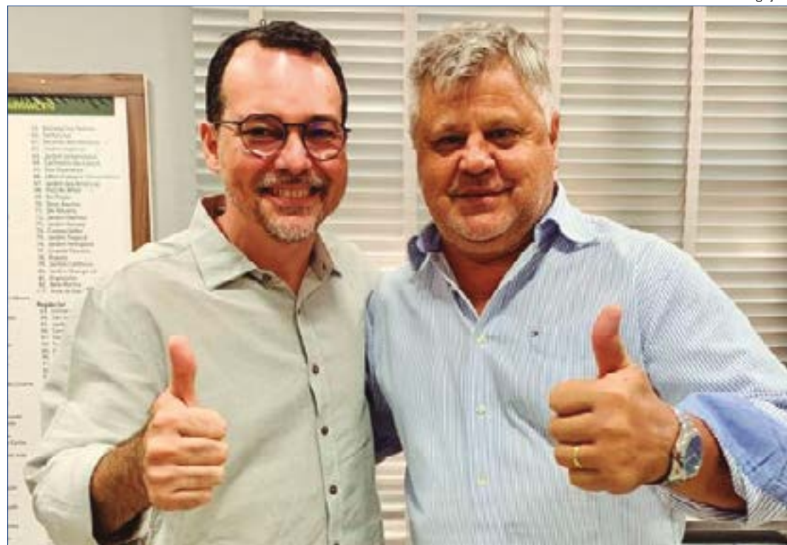
Stopa garante que não há problemas com partidos de esquerda para escola de pré-candidato a prefeito