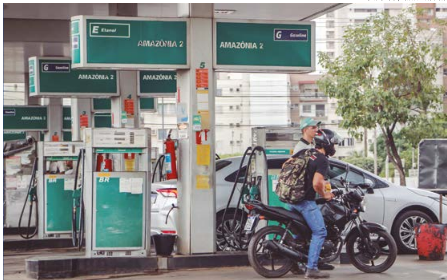
Gilberto Leite | Estádio Mato Grosso

Órgão pediu à Agência Nacional de Petróleo que investigue os postos de combustíveis da capital, devido ao aumento de preços nas últimas semanas