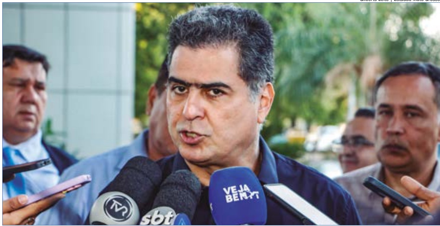
Emanuel explica que a denúncia que deu início ao processo não existe mais em Brasília, pois já foi rejeita pela Justiça

No último dia 11 de abril, a Comissão Processante da Câmara de Cuiabá rejeitou, por unanimidade, os argumentos da