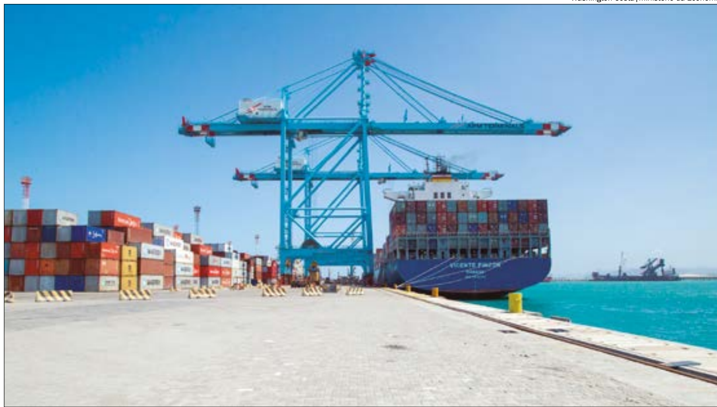
Washington Costa | Ministério da Economia

Na região Centro-Oeste, o Distrito Federal lidera em crescimento de microempresas (19,4%) voltadas para o comércio exterior. Em relação às empresas de pequeno porte, o aumento maior foi no Mato Grosso do Sul (16,7%) e em Mato Grosso (14,8%). Todos os estados da região tiveram aumento percentual expressivo para empresas de grande porte: DF (16,3%), MT (10,9%), MS (9,8%) e GO (9%).