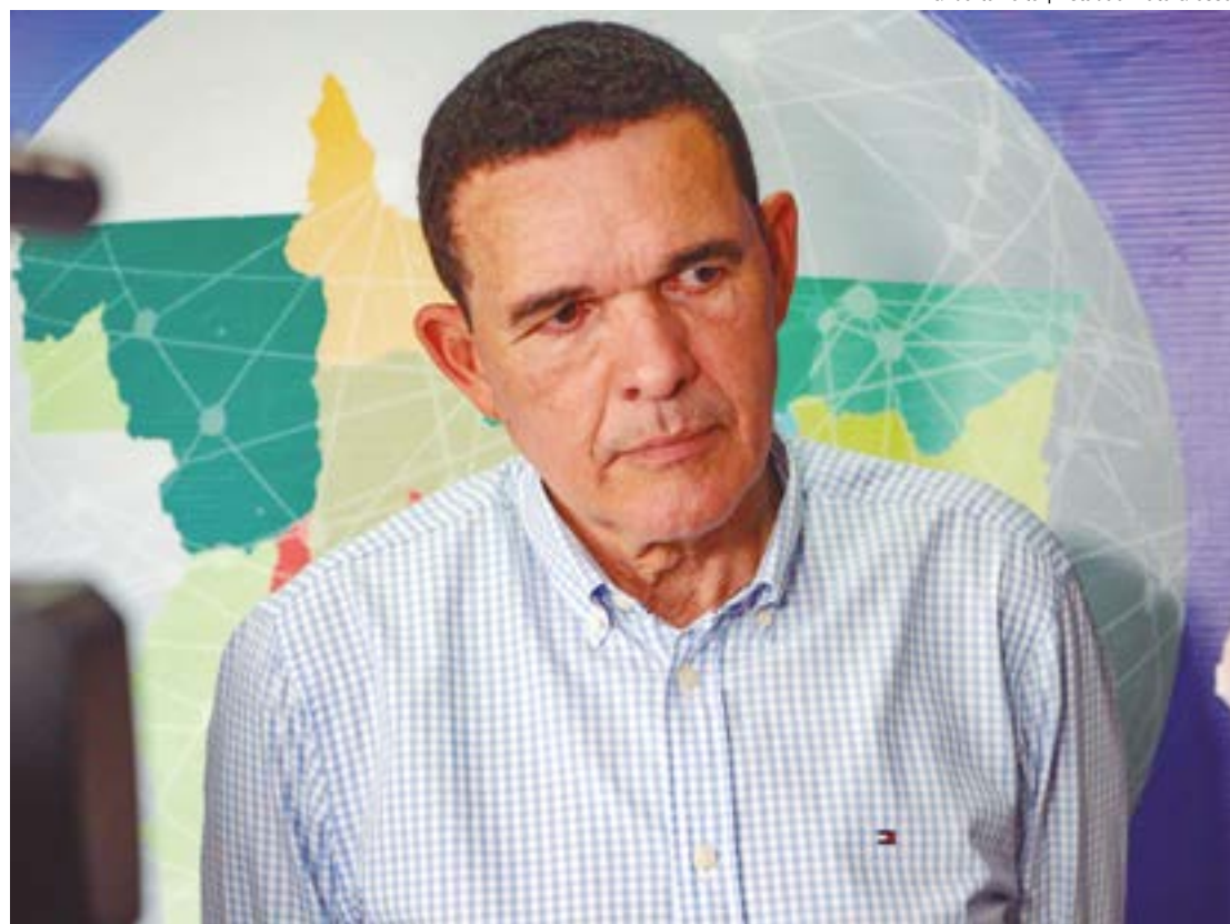
Juarez afirmou estar confiante na chapa do partido, que possui 16 pré-candidatos e acredita que irão conseguir eleger até 5 vereadores