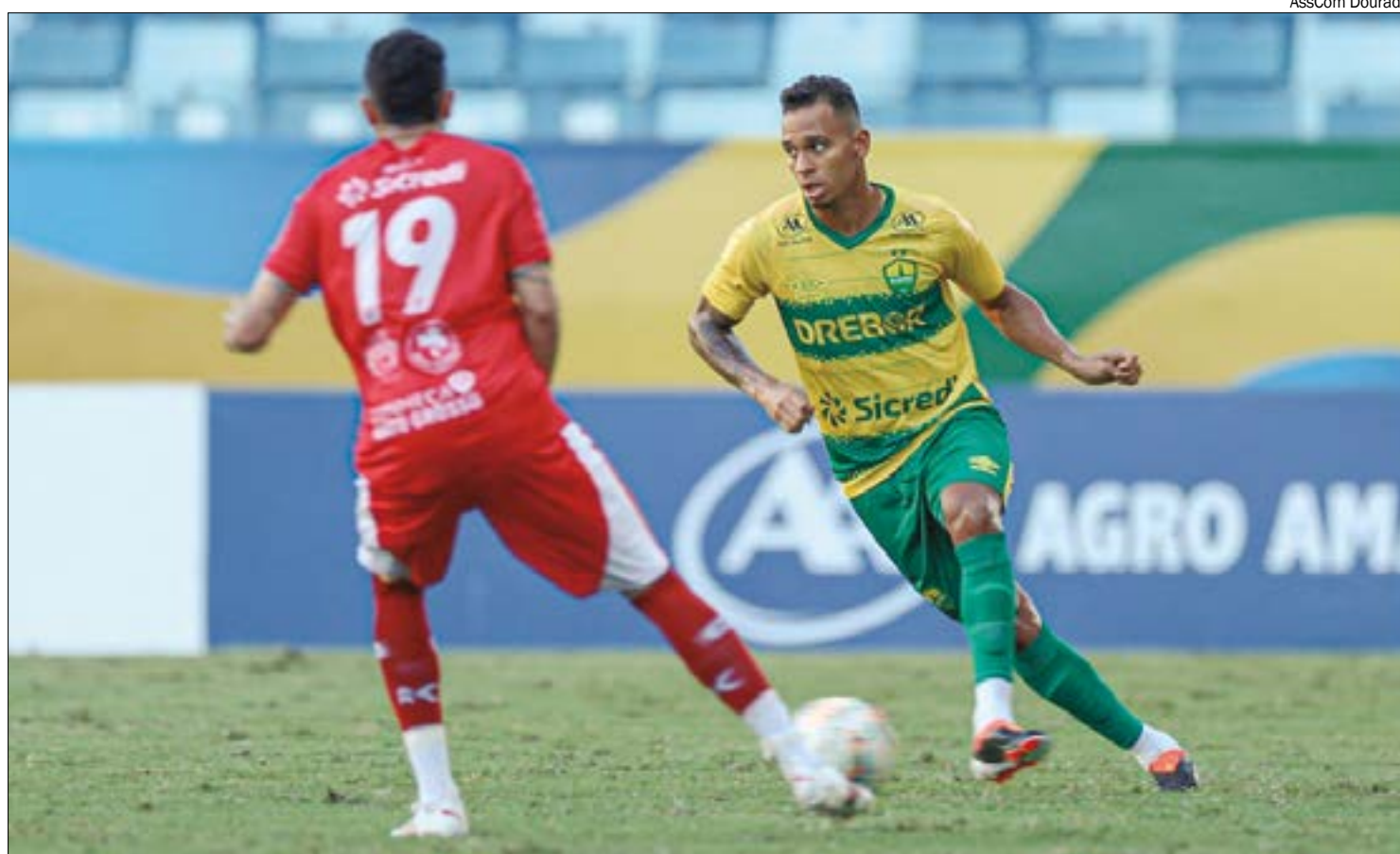
Cuiabá chega com vantagem de jogar para o empate, mas União está decidido a buscar o título estadual

Porém, o Dourado terá que enfrentar o 12º joga-