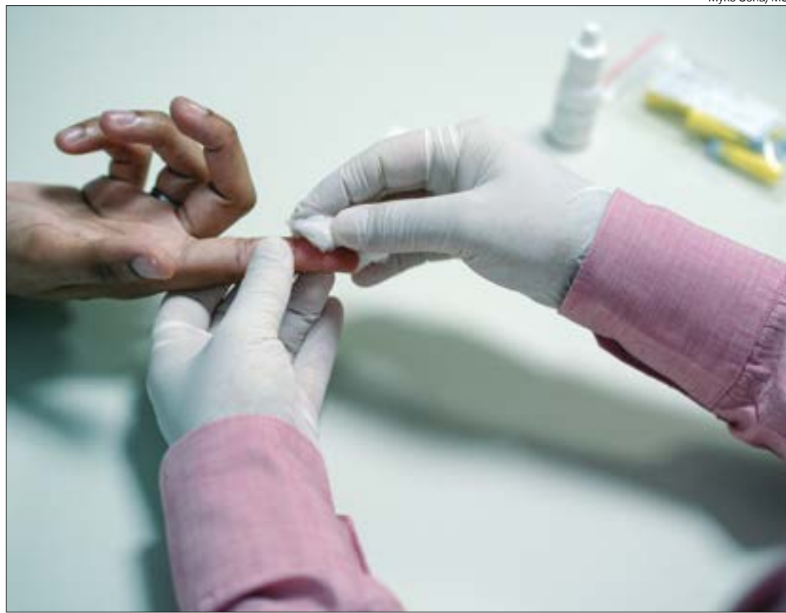
Os casos de hanseníase são diagnosticados por meio do exame físico geral dermatológico e neurológico

No geral, Mato Grosso registrou aumento expressivo no número de diagnósticos de hanseníase de 2022 para 2023. Em 2022, o estado registrou 2.229 diagnósticos da doença, número que subiu para 3.927 em 2023, o que representa