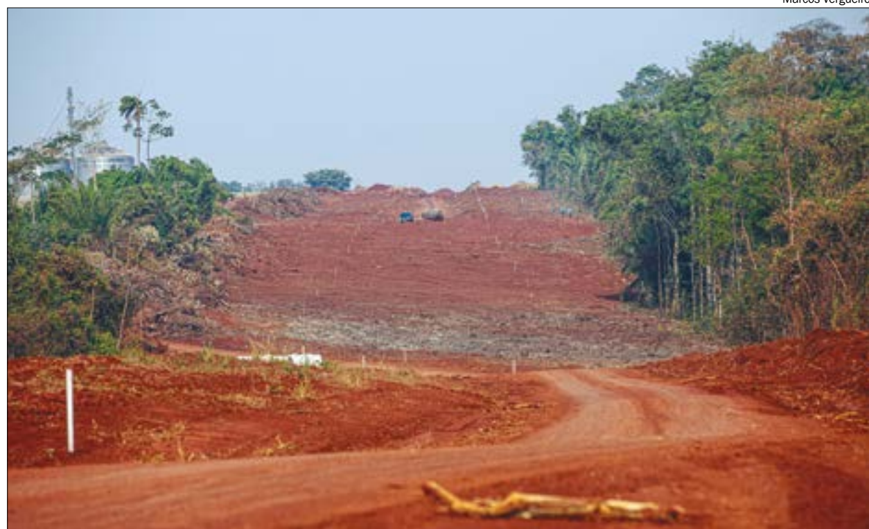
Projeto também prevê uma ponte de 100 metros e uma ciclovia entre as duas cidades