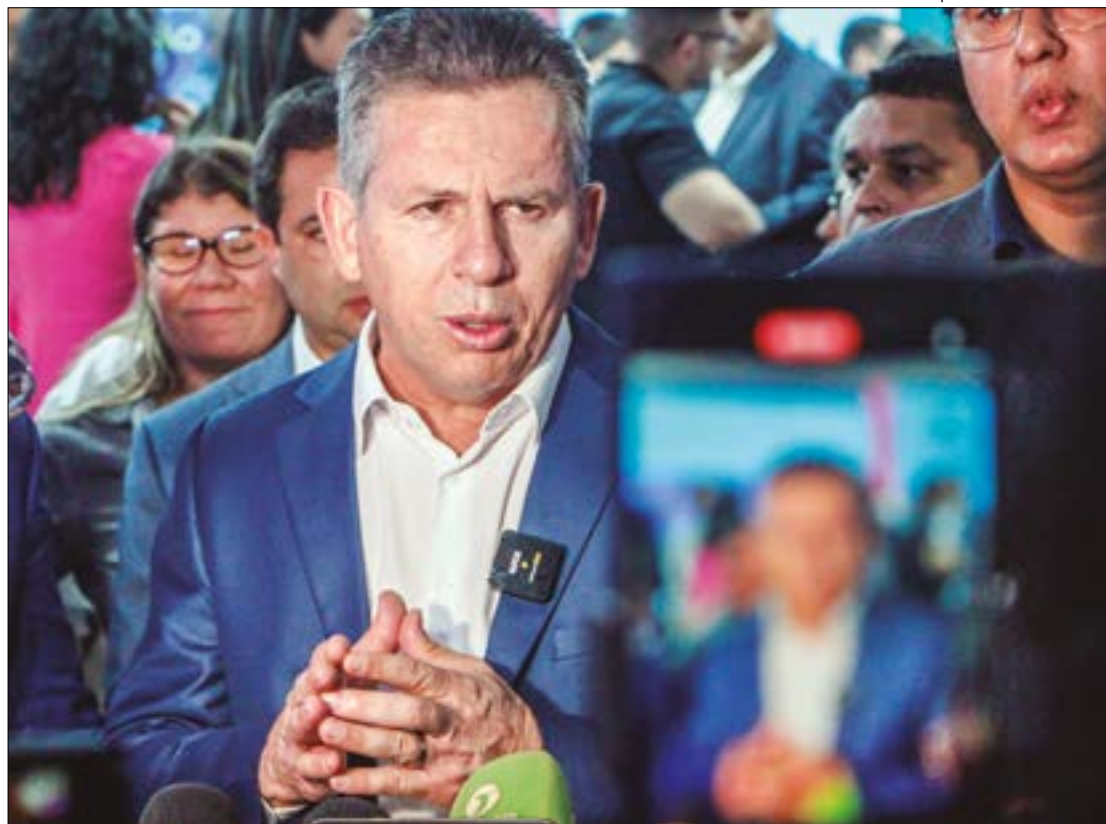
O governador usou como exemplo os Estados Unidos, onde cada Estado tem sua legislação penal própria