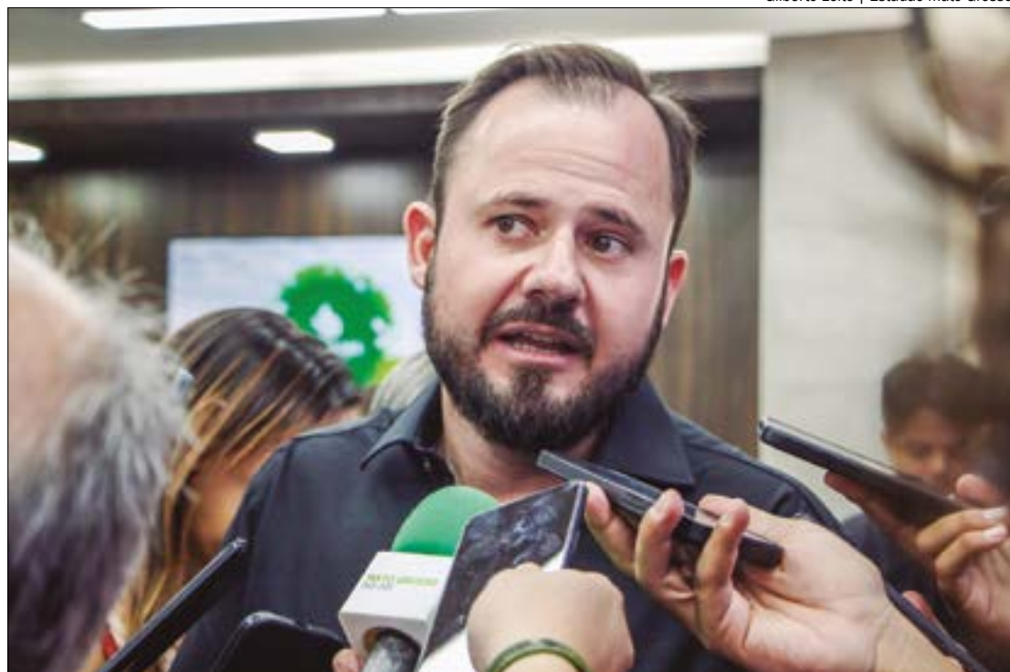
Beber defendeu ainda que cabe ao judiciário analisar quem precisa ou não de uma recuperação judicial