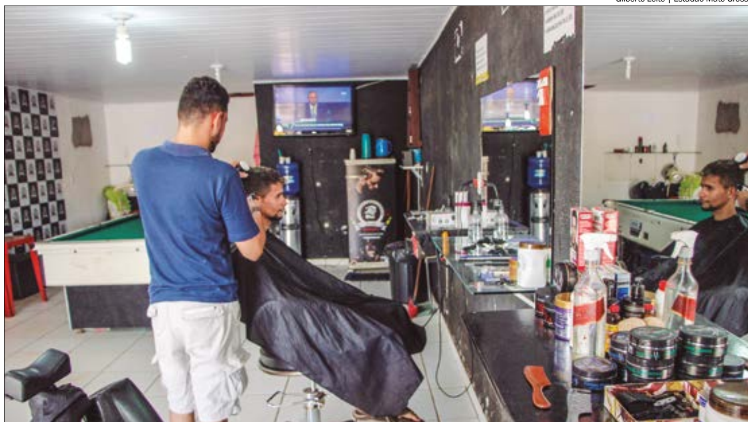
Na visão macro dos setores, o setor de "Serviços" que liderou a criação de empresas em 2023 (20,8%)

Ele destacou ainda que a economia de Mato Grosso cresceu 10,6% em 2023 num ritmo três vezes maior do que o Brasil (2,9%), conforme a Resenha Regional do Banco do Brasil. O PIB de Mato Grosso teve o segundo maior crescimento econômico do país, liderando o Centro-Oeste, atrás apenas do Tocantins, que registrou elevação de 11,1% no PIB.