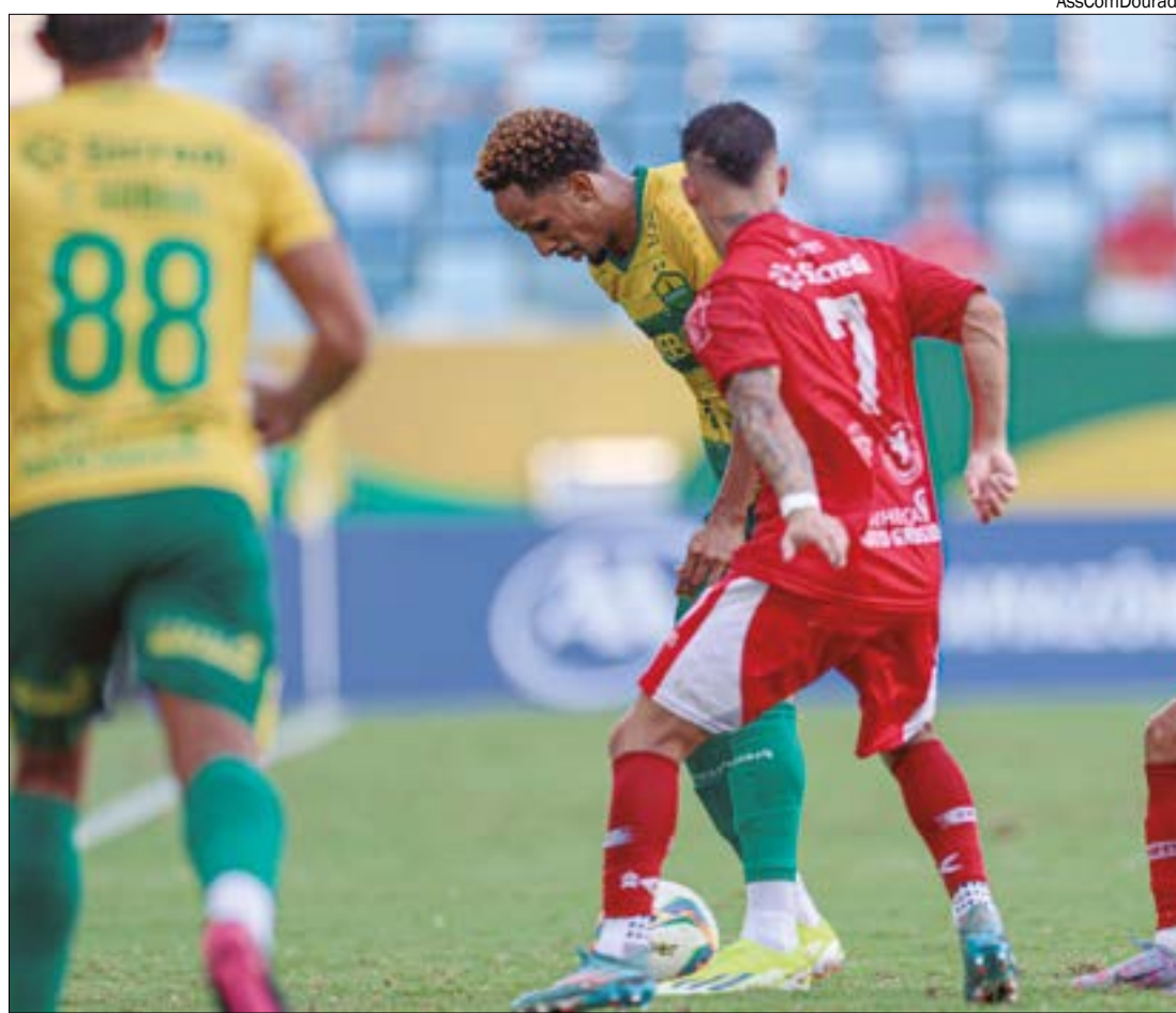
Com o resultado, o Cuiabá joga pelo empate para conquistar a 13ª taça do estadual e o inédito tetracampeonato