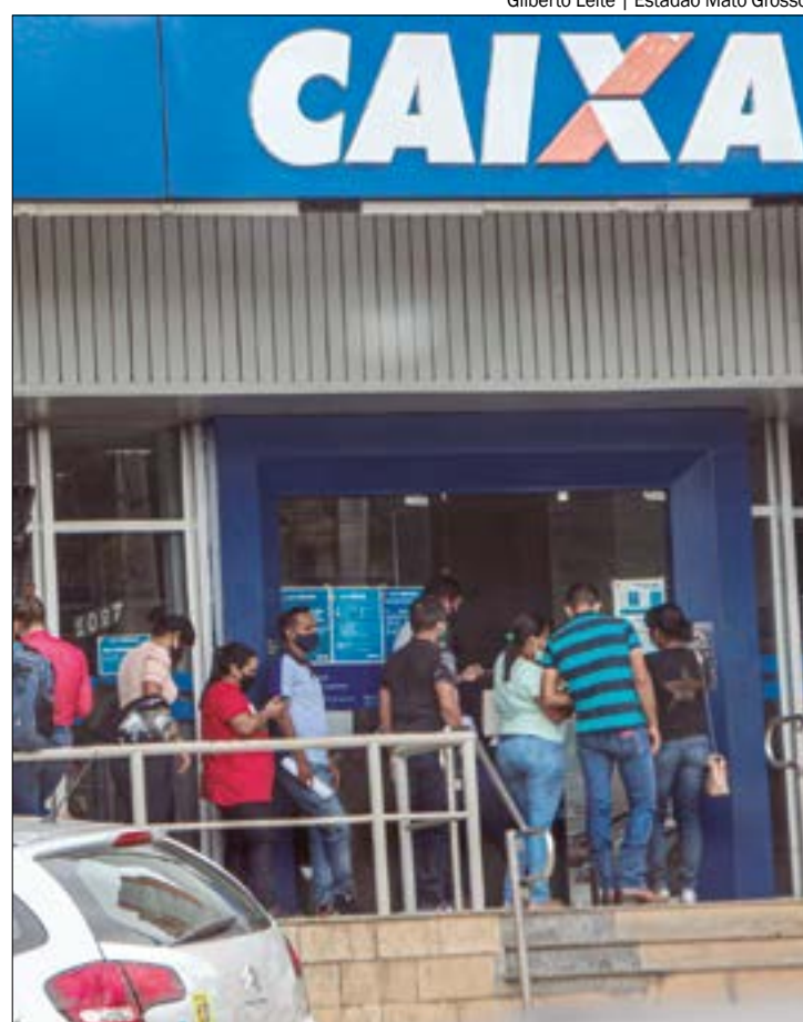
A prorrogação vale apenas para a Faixa 1 do Desenrola, destinada a pessoas com renda de até dois salários mínimos