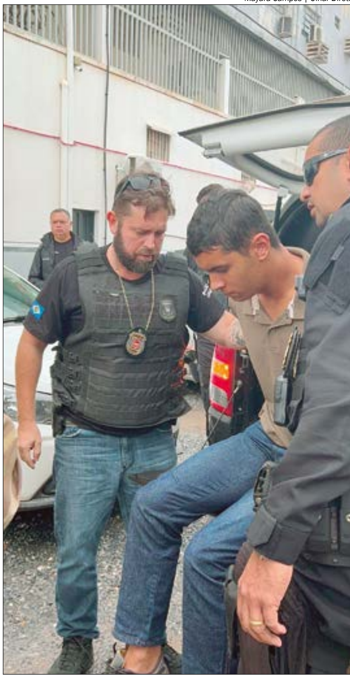
A Polícia Civil avança para a segunda fase da investigação, que busca identificar os mandantes do crime e outros cúmplices

"Ele tem um conhecimento de arma. Ele explicou o tipo de arma que foi entregue a ele. Ele tinha conhecimento que era uma 9mm. [...] Não é um calibre impactante, mas sim transfixante. Então, ela [a pessoa] já sabe que se ela efetuar o disparo na nuca de alguém, num lugar com grande aglomeração de pessoas, esse disparo certamente vai transfixar e acertar um terceiro que não tem nada a ver", explicou delegado.