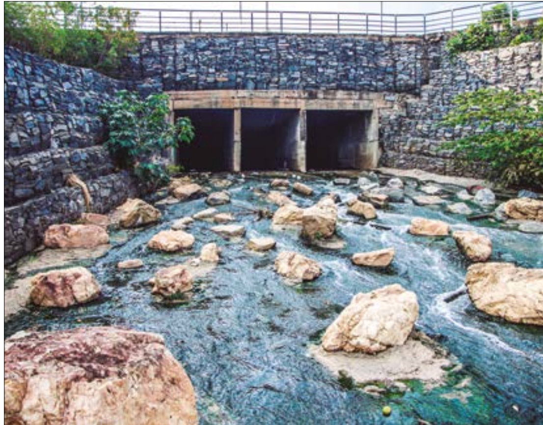
A capital de MT investiu R$ 472,42 por habitante no saneamento básico e alcançou nota 10. Já Várzea Grande, investiu R$ 25,91