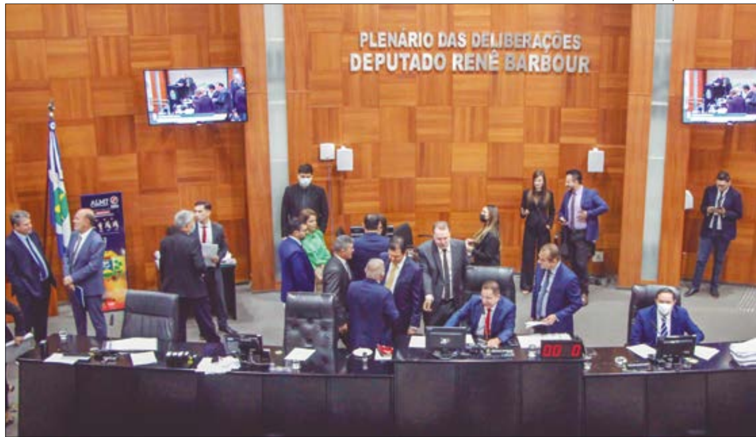
Os deputados estaduais aprovaram por unanimidade, durante a sessão plenária, a lei que obriga o registro audiovisual