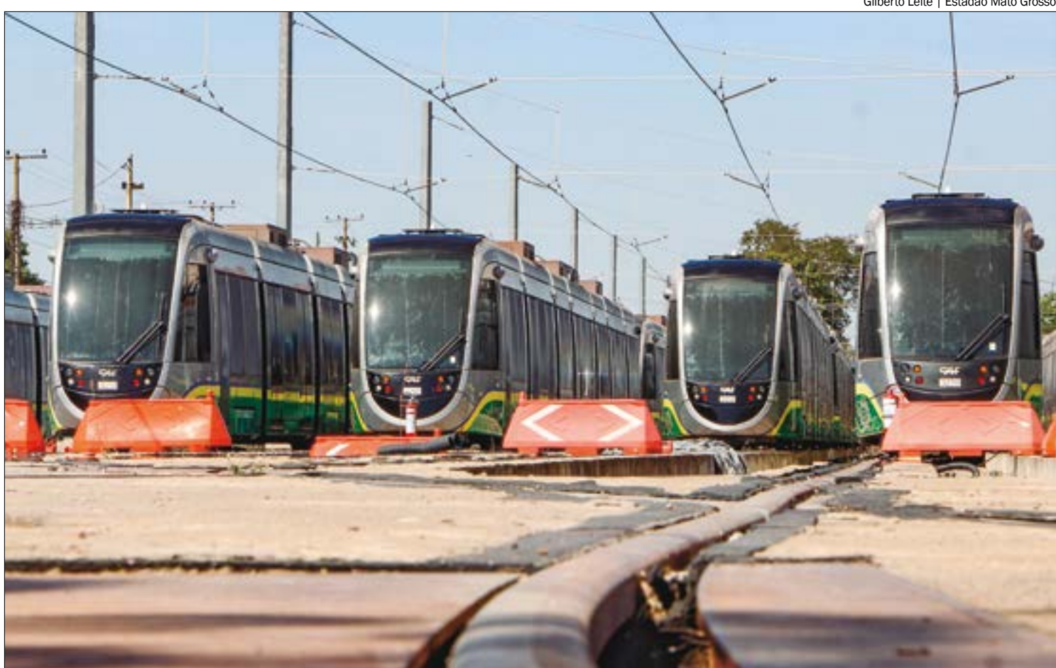
O governo de Mato Grosso pede R$ 1,2 bilhão pelo material rodante do VLT, mas os baianos só estariam dispostos a pagar R$ 600 milhões

"Nós estamos negociando para preservar os interesses dos mato-grossenses. Ficar demandando na justiça por 20, 30 anos, não é interessante para nós, para ninguém", argumentou.