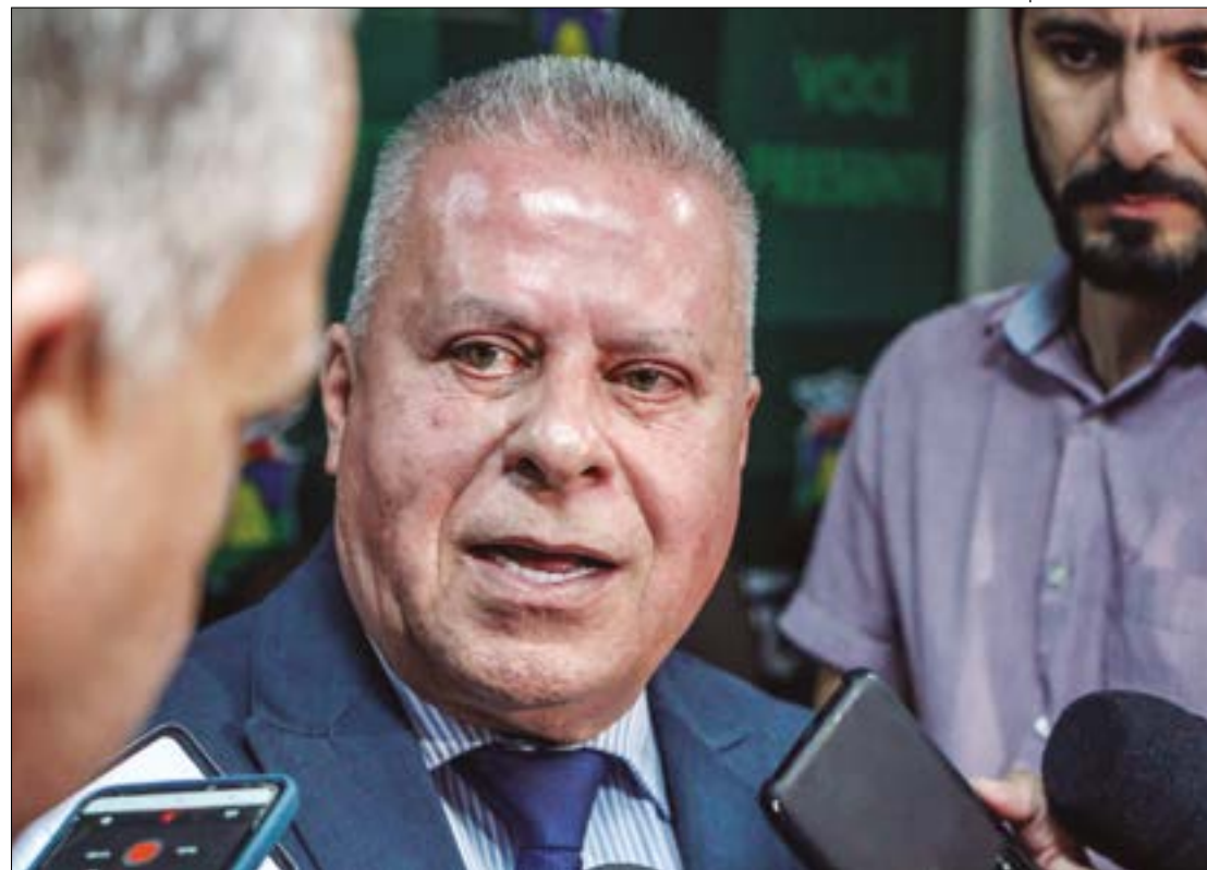
Chico 2000 explicou que a Procuradoria da Casa não viu qualquer respaldo jurídico para o pedido