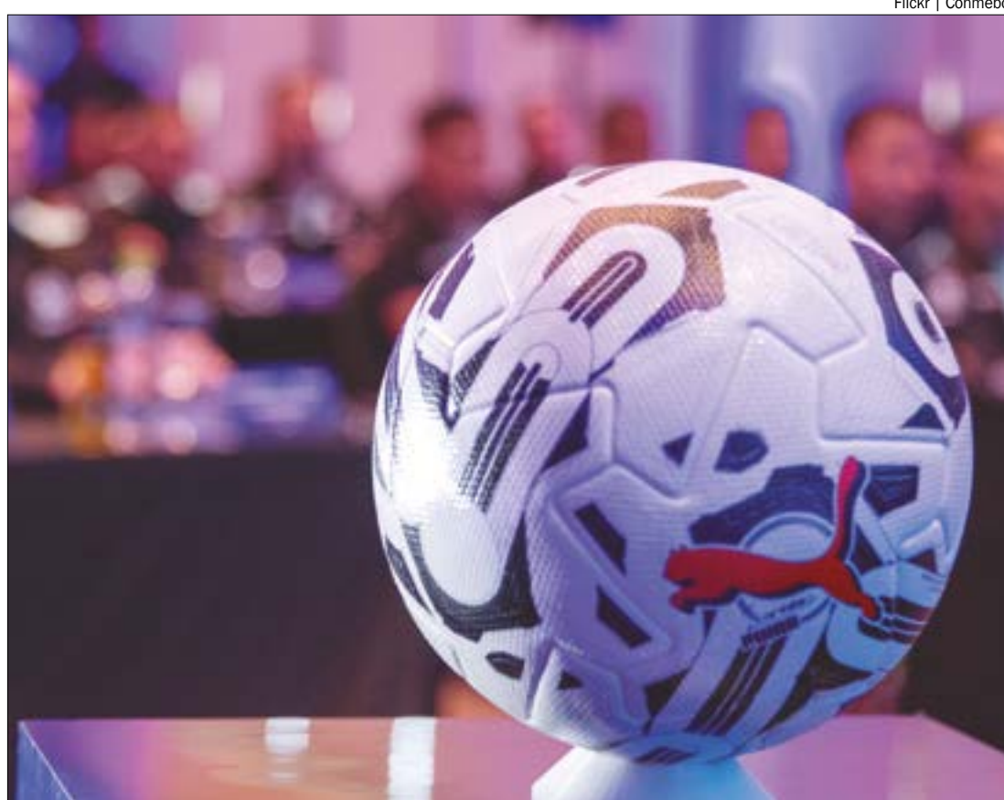
Jogos da primeira rodada começam na primeira semana de abril

A decisão do título está programada para 20 de novembro, no Monumental de Núñez, estádio do River Plate, em Buenos Aires (Argentina).