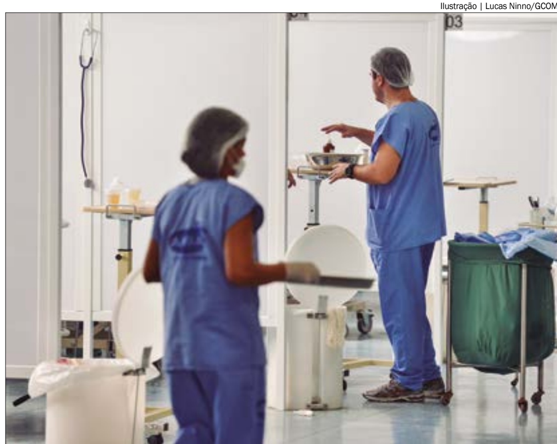
Ilustração | Lucas Ninno/GCOM

Os profissionais informam que, devido ao atraso no pagamento de salários, o contingente de duas UPAs será esvaziado