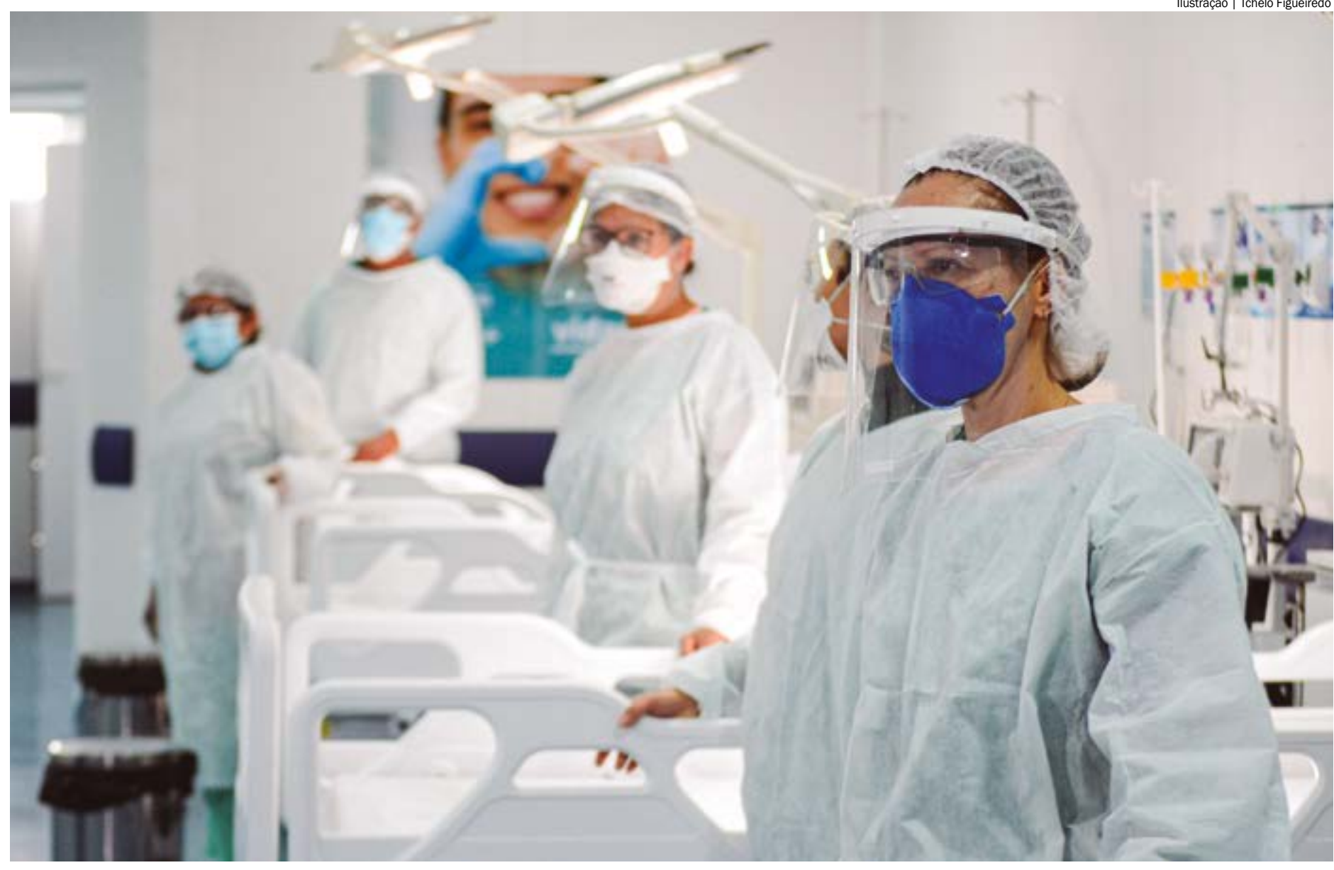
Ilustração | Tchêlo Figueiredo