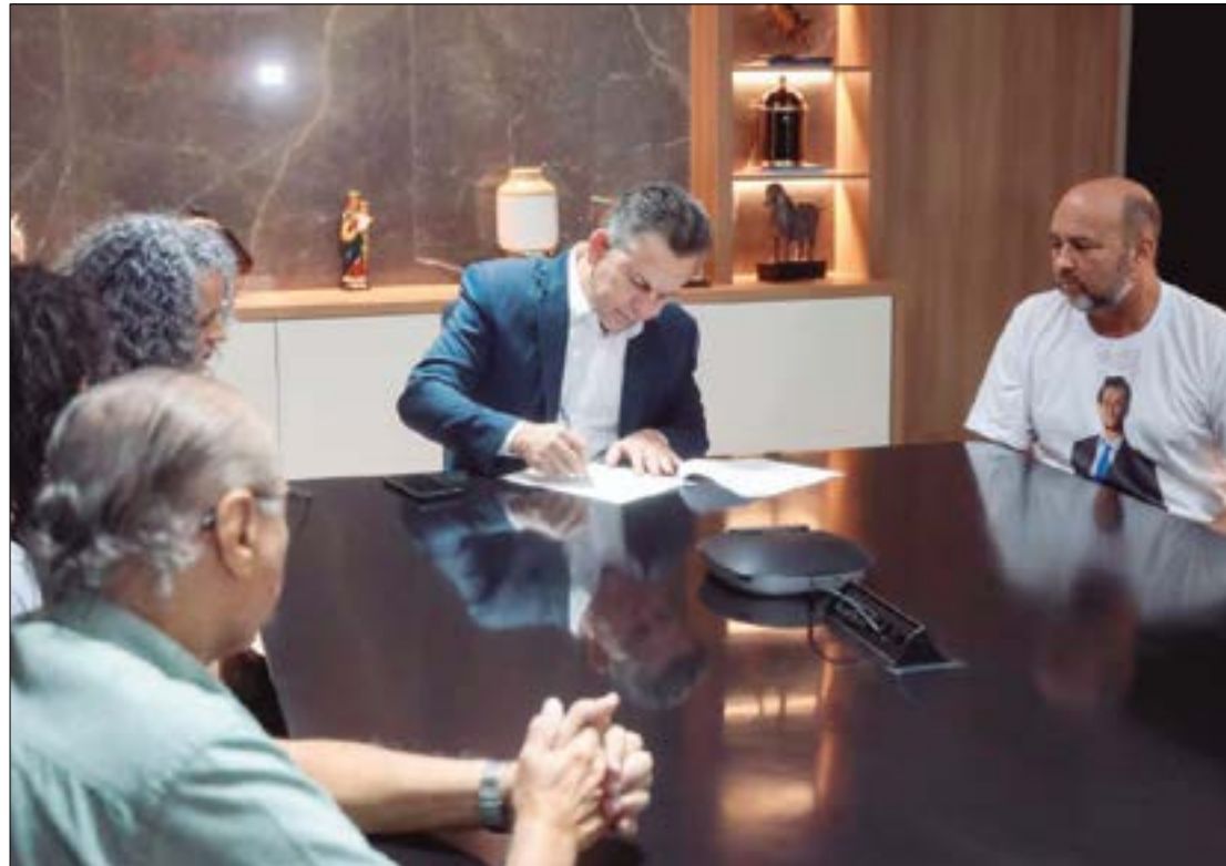
Em conversa com familiares, governador garantiu que o Estado não medirá esforços para investigar o caso com rigidez