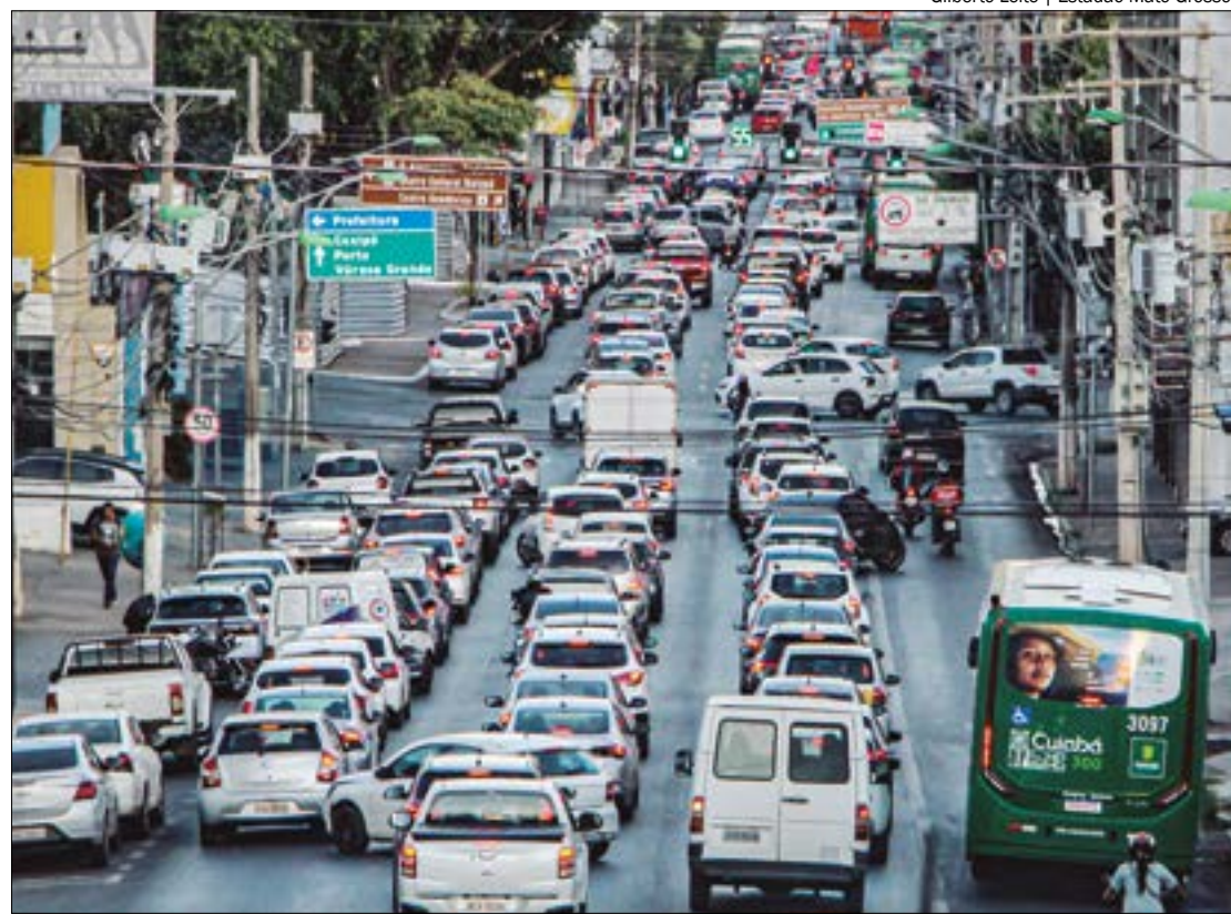
A regra, que irá vigorar em todo o território nacional, não valerá para microônibus, ônibus, reboques e semirreboques