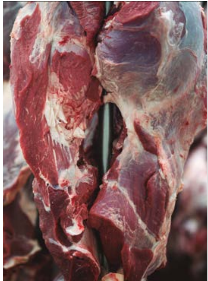
O número de emissões de habilitações em um único ano é o maior já registrado na história