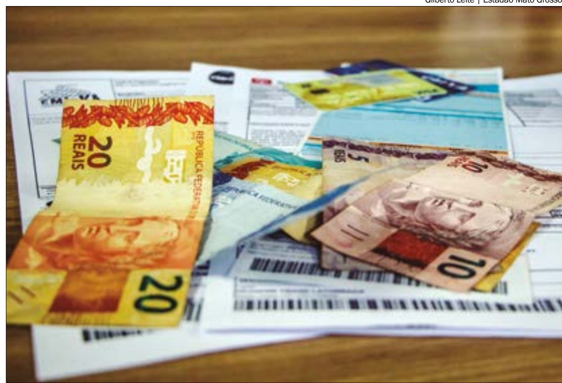
Em relação ao perfil dos inadimplentes em Mato Grosso, pouco mais de 26% dos devedores têm entre 30 e 39 anos de idade

Em fevereiro de 2024, cada consumidor negativado do estado devia, em média, R$ 4.534,15 na soma de todas as dívidas. Os dados ainda mostram que 31,29% dos consumidores do estado tinham dívidas de valor de até R$ 500, percentual que chega a 45,32% quando se fala de dívidas de até R$ 1.000. O valor total para pagar as dívidas de toda a população