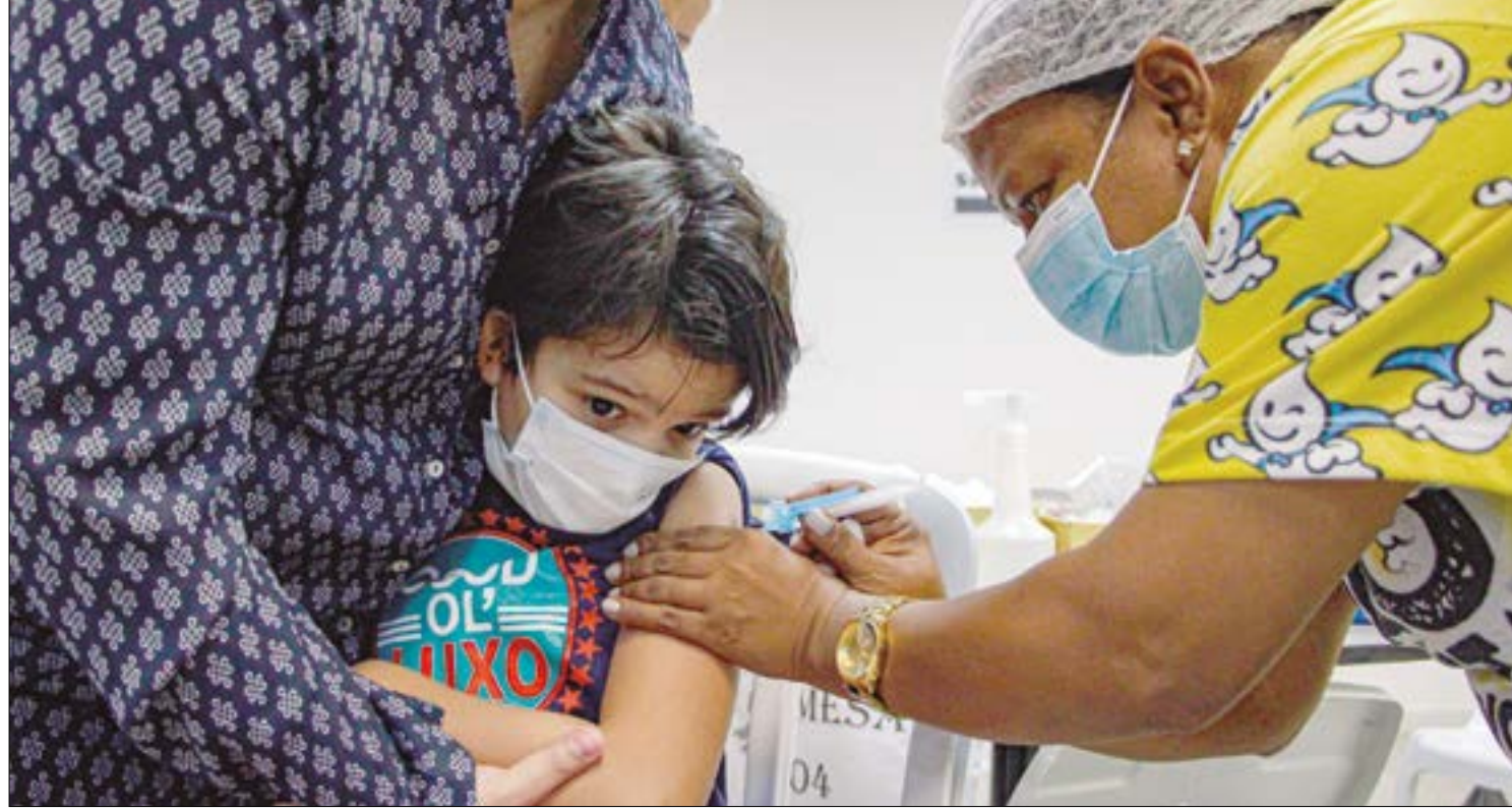
Os imunizantes foram disponibilizados para crianças acima de seis meses em 2022, e desde a liberação, a busca pela vacinação infantil é baixa