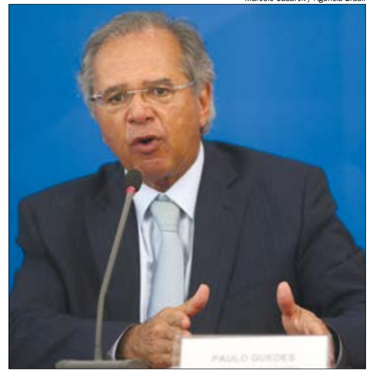
Guedes reconhece importância da preservação, mas alerta para ‘interesses protecionistas’