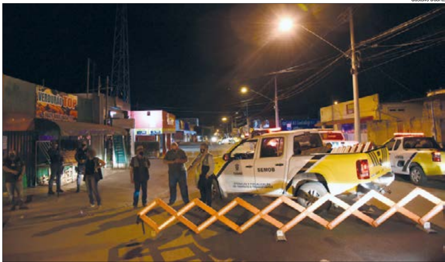
Em Cuiabá, o bairro Alvorada aparece na lista com seis ações fiscais em quatro distribuidoras, seguido pelo bairro Pedra 90, com cinco

Na capital, entre 3 de abril e 25 de junho, a Secretaria Municipal de Ordem Pública realizou 87 ações fiscais em distribuidoras