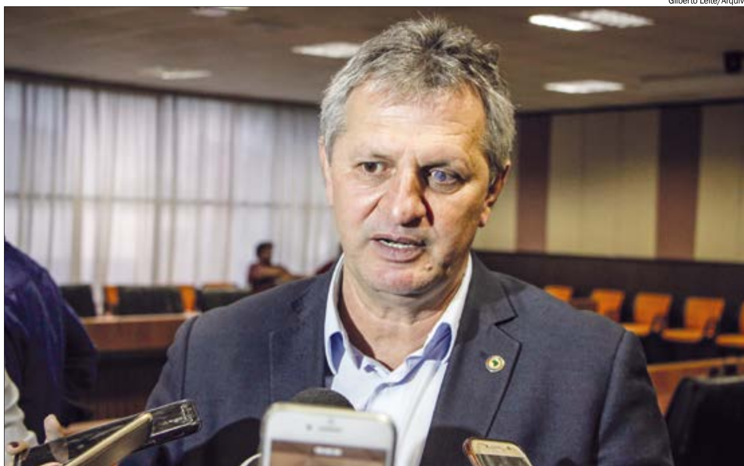
Líder do governo admite que sessão que votará a reforma da Previdência pode ir ‘noite adentro’

Questionado se não votaria nas outras emendas,