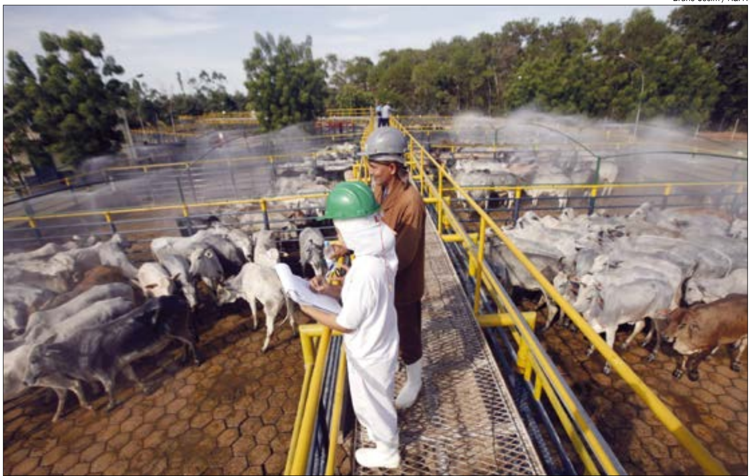
Municípios cujas economias estão ancoradas no agronegócio tiveram melhor desempenho na geração de emprego

“São municípios onde o governo do Estado está com obras e, simultaneamente, combatendo a pandemia. Ou seja, gera-se emprego pela necessidade de enfrentar a doença e para dar continuidade às obras de infraestrutura. Além disso, há vários investimentos na área industrial que continuam em andamento, mesmo com todas as dificuldades. O setor do etanol continua investindo, mesmo enfrentando queda no consumo, por causa da quarentena e redução da movimentação de pessoas. Mas são projetos importantes para as empresas e que continuam em andamento”, justifica.