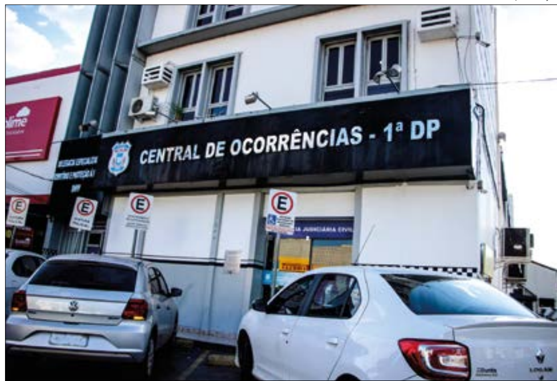
A adolescente foi morta pela amiga que disparou acidentalmente a arma que pertence ao pai. O caso está sendo investigado pela DHPP