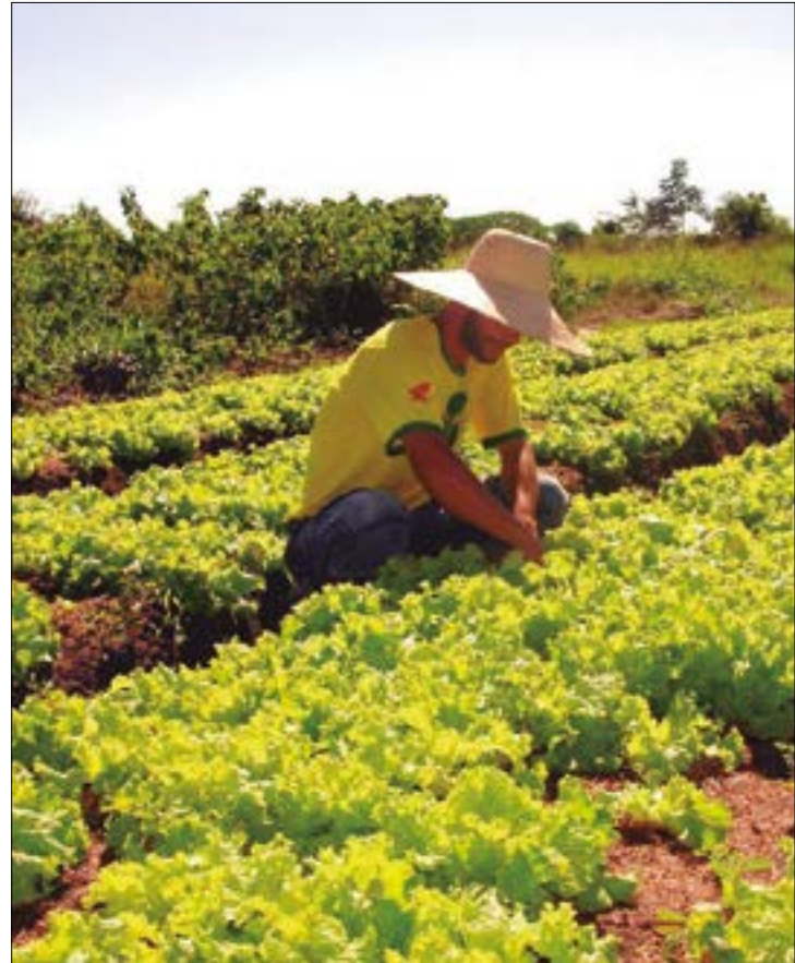
Com a redução do tempo de espera, produtores podem começar suas atividades de forma muito mais rápida