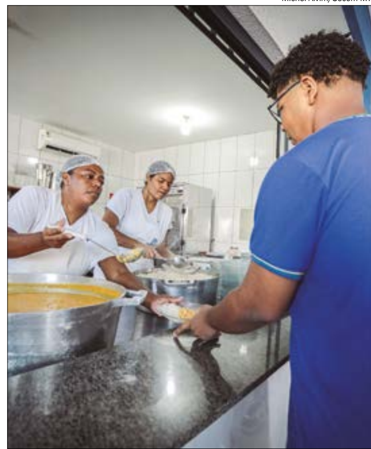
Atualmente, 31% de todos os alimentos usados nas escolas são provenientes da agricultura familiar

Ao todo, o Governo do Estado está investindo R$ 160 milhões na alimentação escolar neste ano.