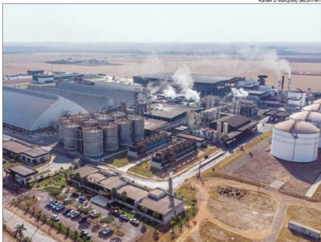
Mato Grosso é maior produtor de etanol de milho do Brasil e emprega mais de 11 mil pessoas no setor

Segundo o balanço da safra 2023/24 de cana-