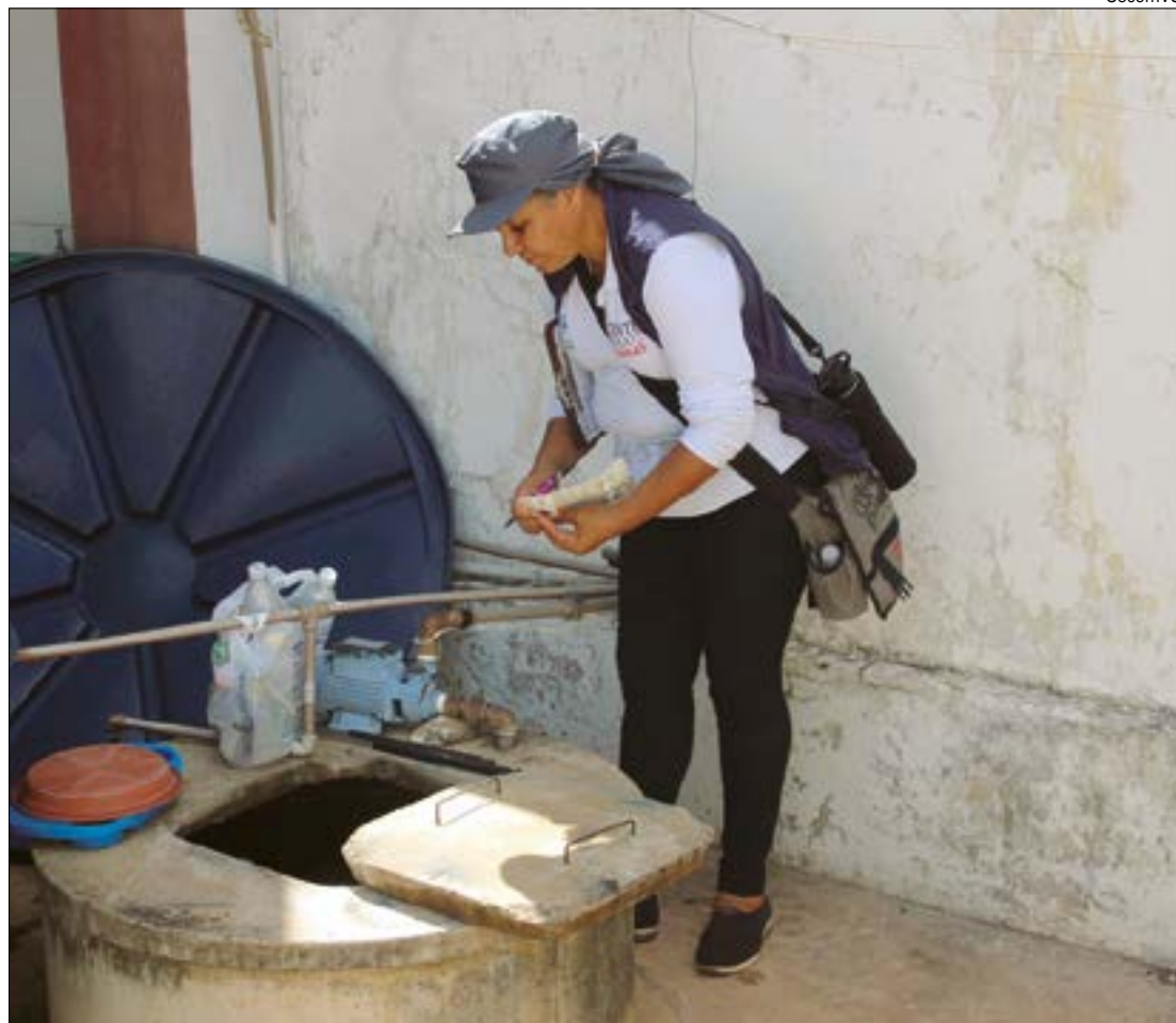
Os ovos do mosquito Aedes permanecem vivos por cerca de um ano sem água e basta apenas um contato com umidade para que as larvas apareçam

"Neste ano, do dia 31/12 até o dia 17 deste mês de fevereiro, foram notificados 140 casos de dengue em nosso território; por isso, traçamos um cronograma de trabalho definido pela Superintendência de Vigilância em Saúde, pelo Centro de Controle de Zoonoses e pela Superintendência de Atenção Primária à Saúde, para alcançar cobertura de 100% dos imóveis de Várzea Grande visitados por nossas equi-