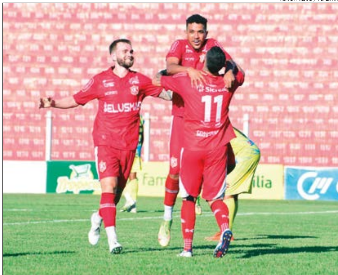
Ilcimar Aranha / Portal MT

A Federação Mato-grossense de Futebol (FMF) em breve divulgará as datas, horários e locais desses emocionantes confrontos, que prometem inflamar os corações