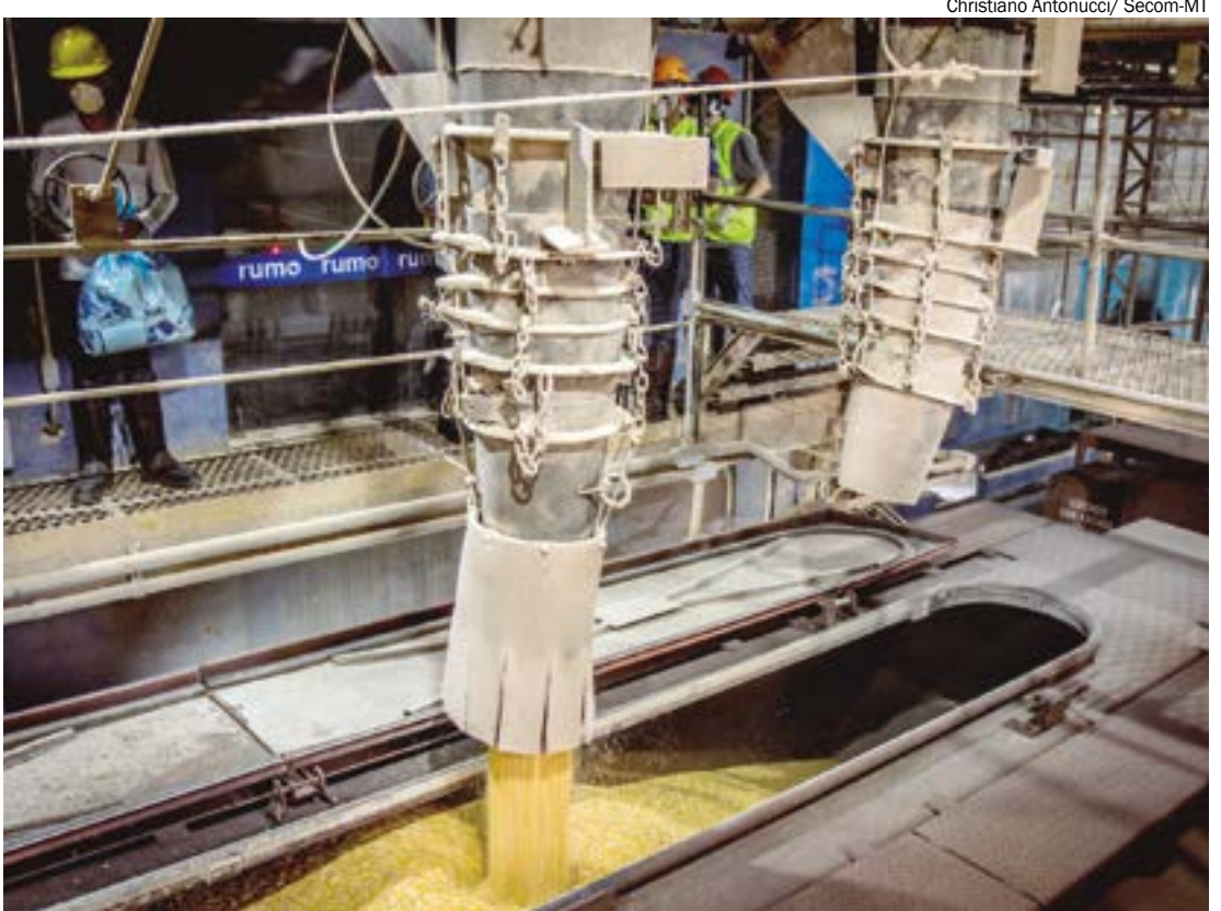
Christiano Antonucci/ Secom-MT

Mato Grosso é referência na produção de grãos, com safras cada vez mais expressivas, respondendo por quase 40% da produção nacional de milho e 30% de soja. Mas, apesar de ser o maior produtor do país, enfrenta barreiras que travam a rentabilidade de seus produtos: a enorme distância dos portos de exportação e a deficiência logística. Toda a produção de milho de Mato Grosso, de 52,5 milhões de toneladas, na cotação de SP, poderia ter um faturamento de R$ 49 bi, mas rende R$ 16 bilhões a menos no estado