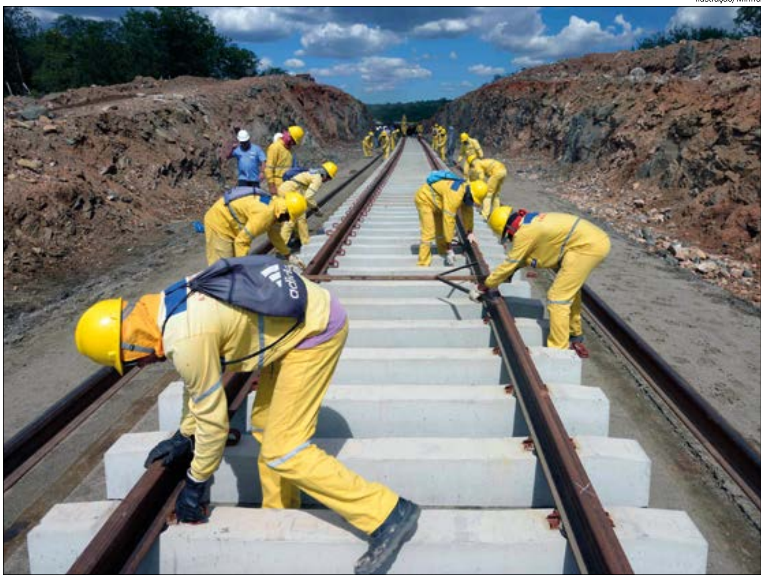
Leilão da Ferrogrão está previsto para 2021, com previsão de começar a operar em cinco anos

A diversificação do modal logístico em Mato