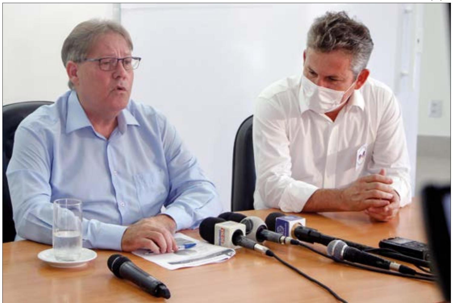
Governo descarta hospital de campanha e vai transformar Arena Pantanal em centro de triagem

Segundo Gilberto, devido à atual situação, o Estado também tem adquirido medicamentos de saúde primária para doar aos municípios, verdadeiros responsáveis por essas aquisições. De acordo com ele, R$ 9 milhões em medicamentos já foram adquiridos.