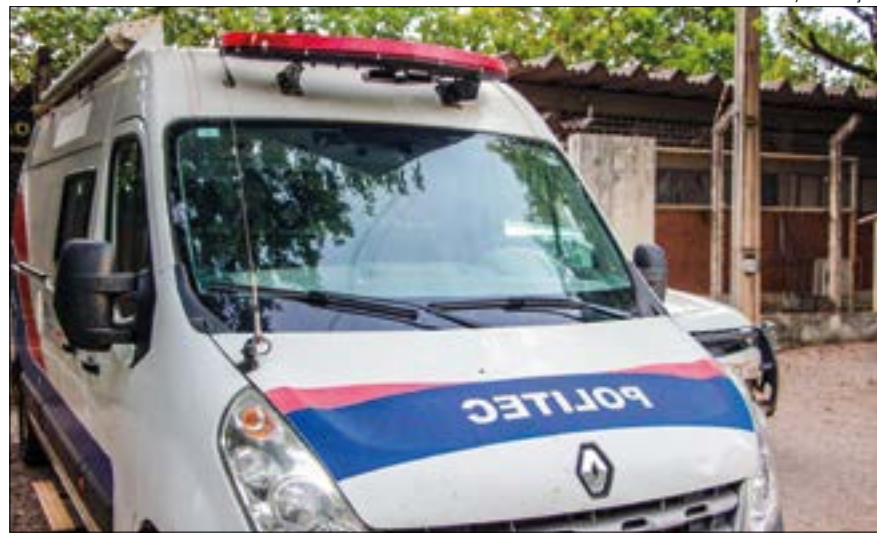
Gilberto Leite/ Ilustração

Homem matou a ex-namorada e atirou na amiga. Tainá foi encontrada sem vida pelos PMs que foram acionados por vizinhos