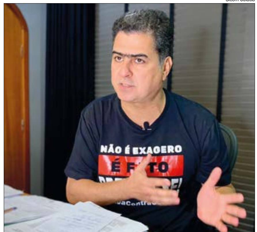
Pinheiro criticou o fato de Cuiabá ter que fechar o comércio enquanto o interior segue aberto

“Por Cuiabá eu faço qualquer coisa e nenhuma medida é descartada. Entretanto, nós trabalhamos com dados técnicos e científicos realizados pelo Comitê de Enfrentamento ao Coronavírus. Acompanhamos o Ministério da Saúde e OMS. Não sou contra lockdown, o que eu venho discutindo é sobre a invasão de competência. Existem mais de 30 municípios com risco muito alto de contaminação, que estão abertos. Eu tenho lutado muito na justiça para evitar isso: que se feche e prejudique Cuiabá enquanto no interior, que tem o maior número de casos, continua aberto”, pontuou.