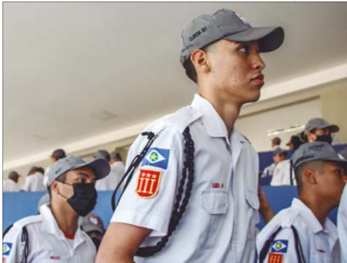
A implementação do modelo de gestão cívico-militar nas escolas ocorrerá mediante processo regulamentado pela Seduc-MT