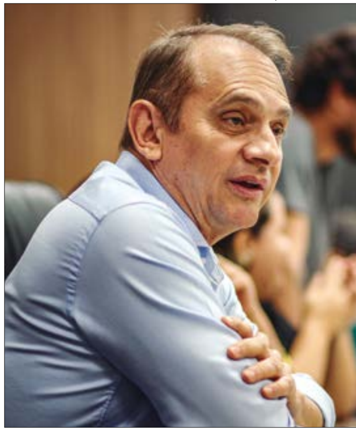
Wilson acusa governo de agir de forma antiética ao propor novo projeto para o Transporte Zero