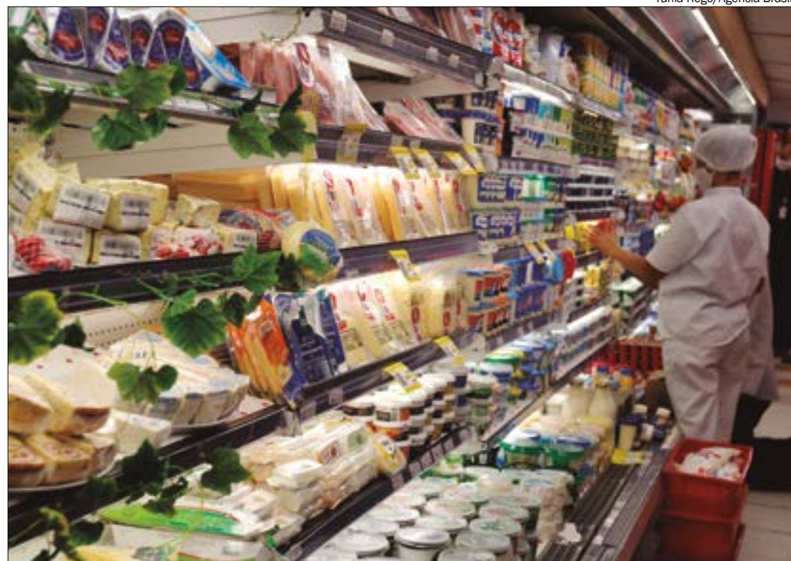
Balanço anual revela ainda que o número de trabalhadores diretos atingiu 1,97 milhão

nellas, o resultado expressivo pode ser explicado pelo aumento de 5,1% da produção física (totalizando 270 milhões de toneladas de alimentos) e pelo incremento nos investimentos em inovação, pesquisa e desenvolvimento, ampliação e modernização de plantas.