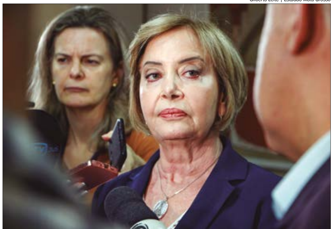
Presidente do TJ-MT afirma que lista de mulheres deve durar até atingir 40% de paridade entre desembargadores