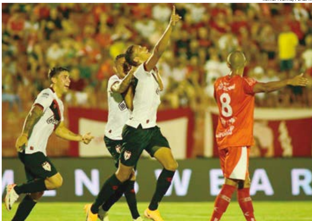
Dragão dependia apenas do empate, mas conseguiu emplacar três gols sobre o União