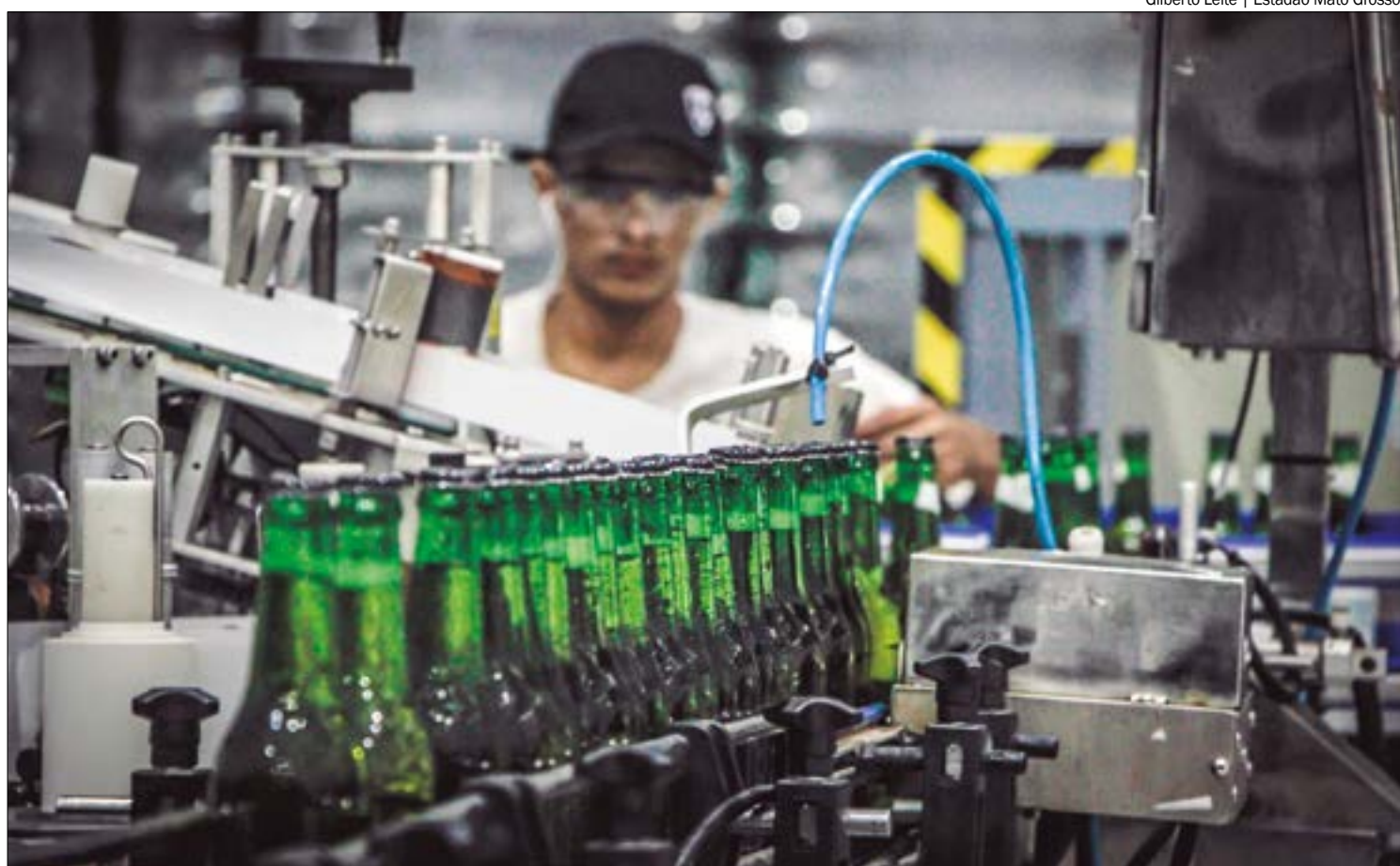
Percentual de pessoas empregadas em idade de trabalhar em Mato Grosso chegou a 64,7%

A taxa de desocupação por sexo em Mato Grosso foi de 2,5% para os homens e 5,9% para as mulheres. Na análise por nível de instrução, o índice para as pessoas com ensino médio incompleto (8,3%) foi maior que as taxas dos demais níveis e instrução, seguido por ensino funda-