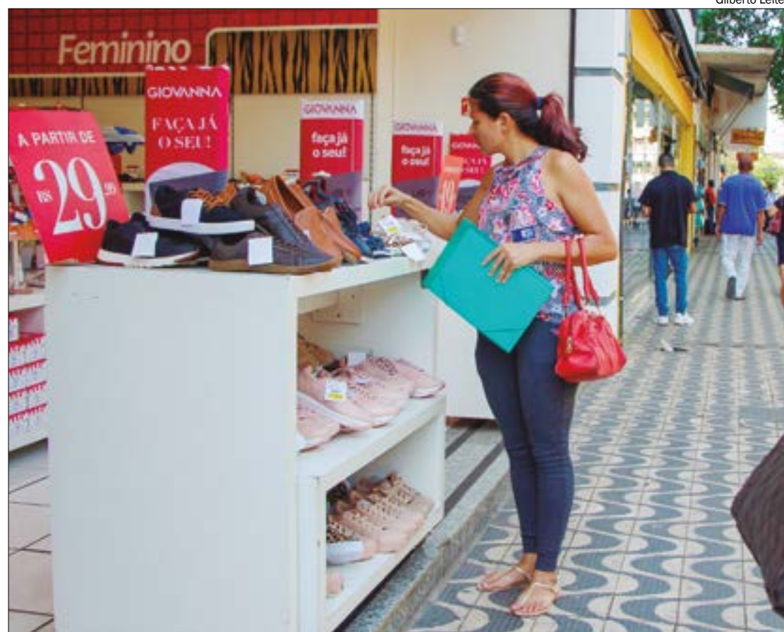
Os subíndices que mais impactaram para o resultado mensal são: nível de consumo atual, depois emprego e renda

A análise atual sobre o emprego revela que 53,6% dos entrevistados se sentem mais seguros em relação ao emprego atual do que no mesmo período de 2023, enquanto 55% afirmaram que a renda atual melhorou. Além disso, para uma avaliação futura, 56,8% acreditam que a perspectiva profissional para os próximos seis meses é positiva.