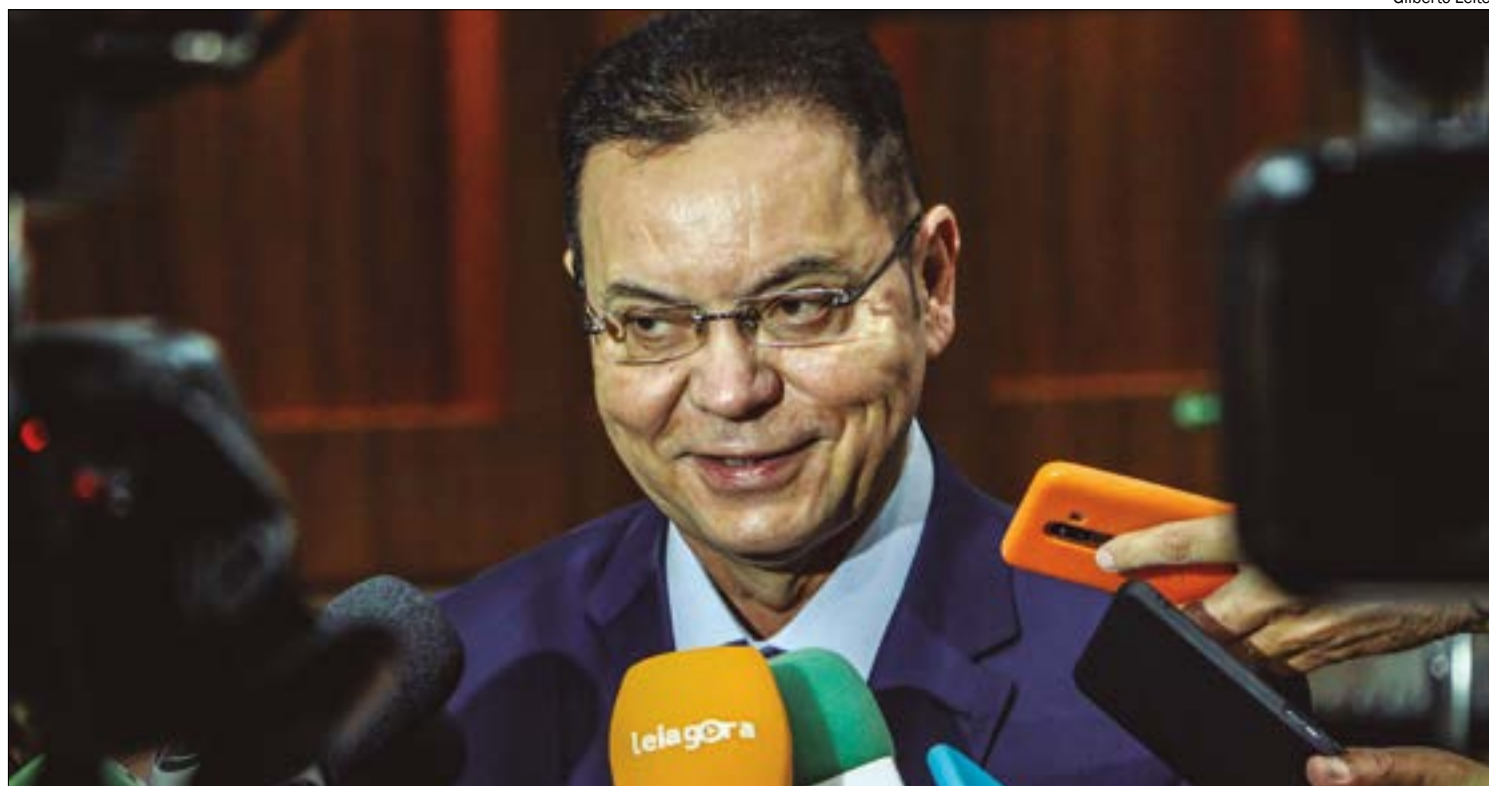
Ao ser questionado sobre os nomes cogitados para vice, Botelho elogiou, mas não confirmou ninguém

Mendes chegou a se reunir com os dois e pediu um tempo a Botelho para refletir com quem ele realmente estaria. "Após ouvir diversas lideranças do UB e outros parceiros políticos, definimos o deputado estadual Eduardo Botelho como o candidato do partido nas Eleições de 2024 na cidade de Cuiabá".