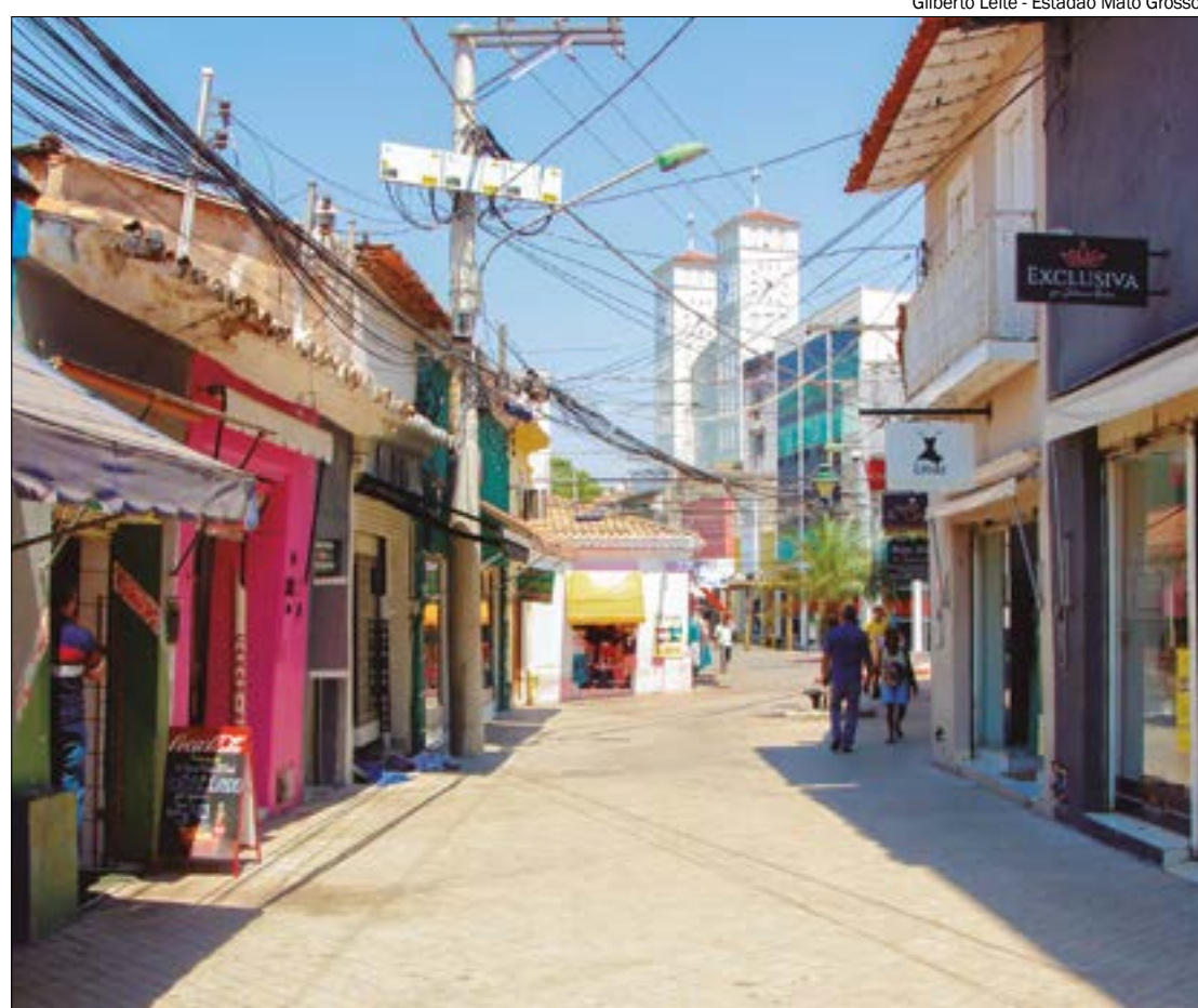
Gilberto Leite - Estadão Mato Grosso