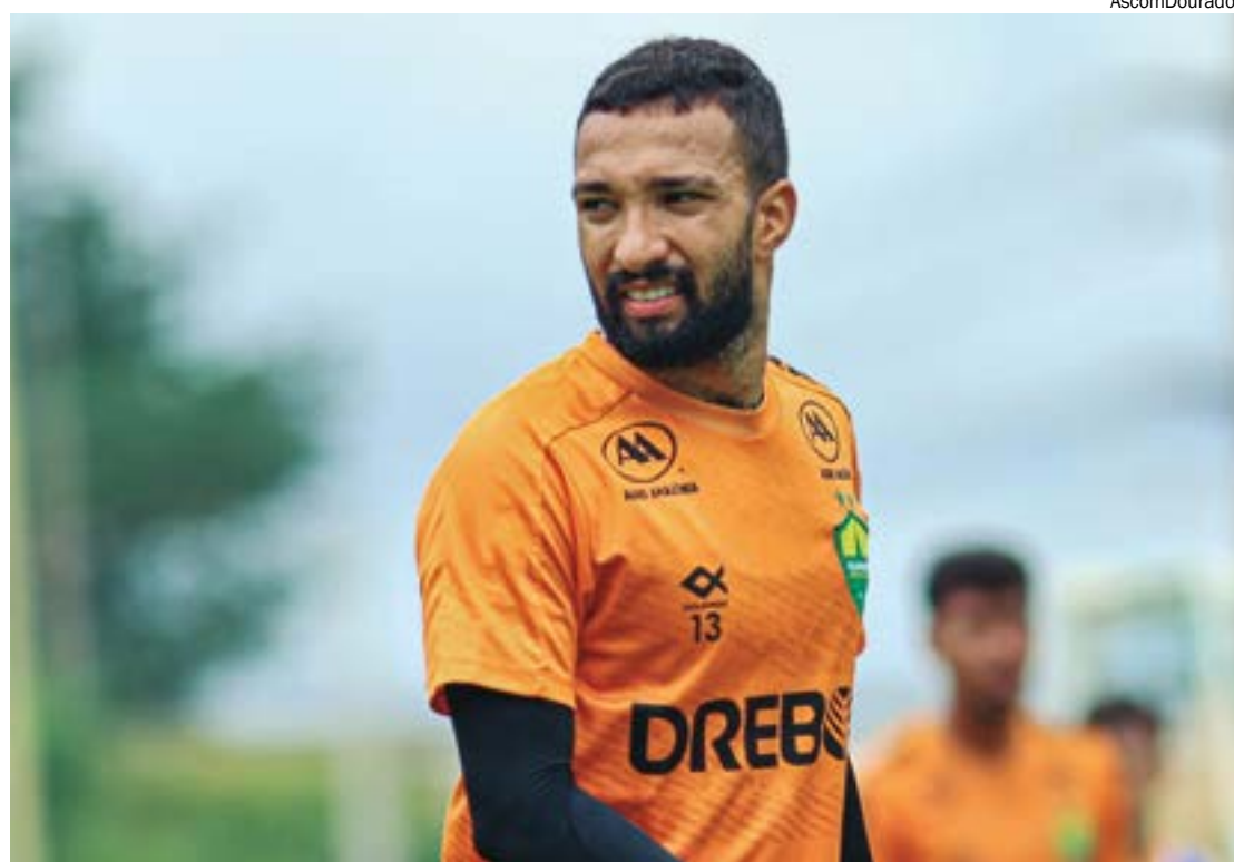
Classificado direto para a semifinal do Mato-grossense, o Cuiabá foca as atenções para a Copa do Brasil