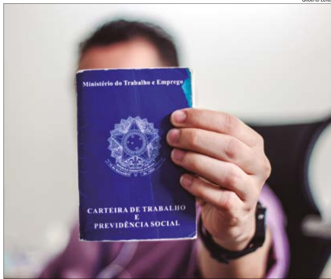
Em outros atendimentos de intermediação realizados no Sine foram 25.745 inscritos e 12.911 colocados no mercado de trabalho

O trabalhador pode acessar os serviços do Sine de forma virtual para cadastrar seu currículo, utilizando o portal Emprega Brasil e seguindo os passos indicados (Menu - Trabalhador - Vagas de Emprego). É necessário ter uma conta ativa no portal Gov.Br para acessar esses serviços.