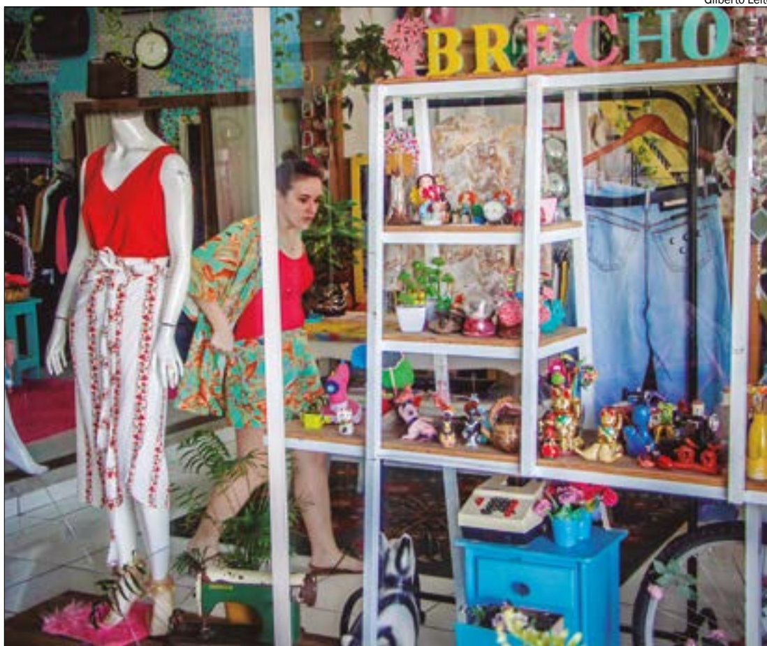
Cuiabá apresentou o maior saldo de empregos, com cerca de 7,5 mil admissões a mais que demissões

O setor de maior destaque e contribuição para o saldo positivo foi de serviços, com saldo de 17.286