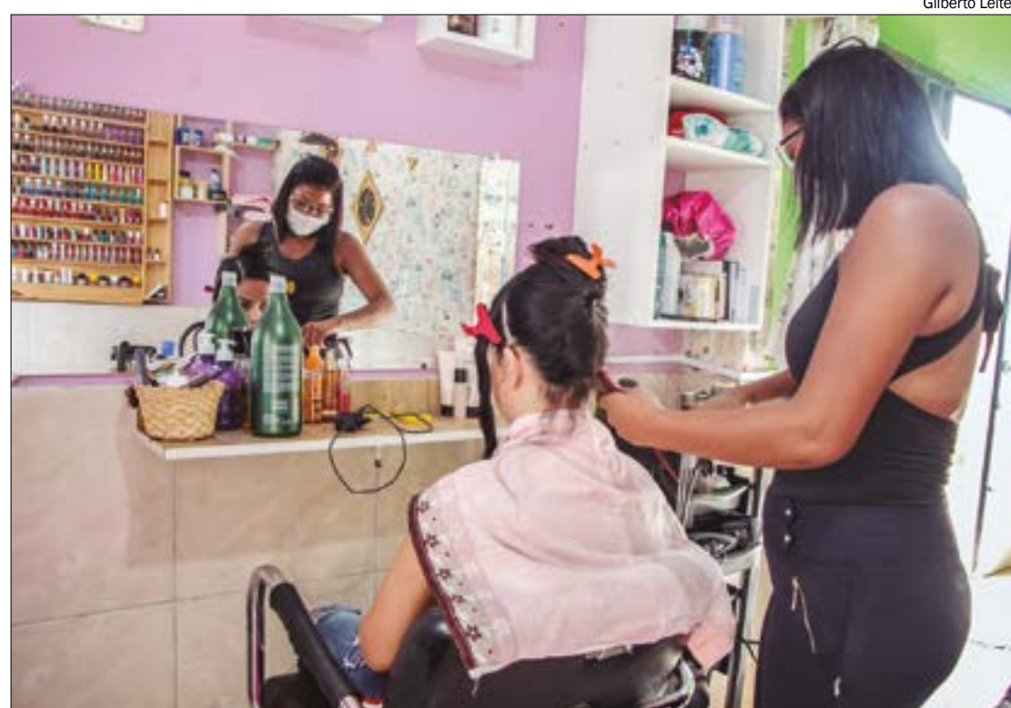
Última vez que o setor de serviços registrou crescimento por três anos consecutivos foi entre 2012 e 2014

A expansão de locação de automóveis; de servi-