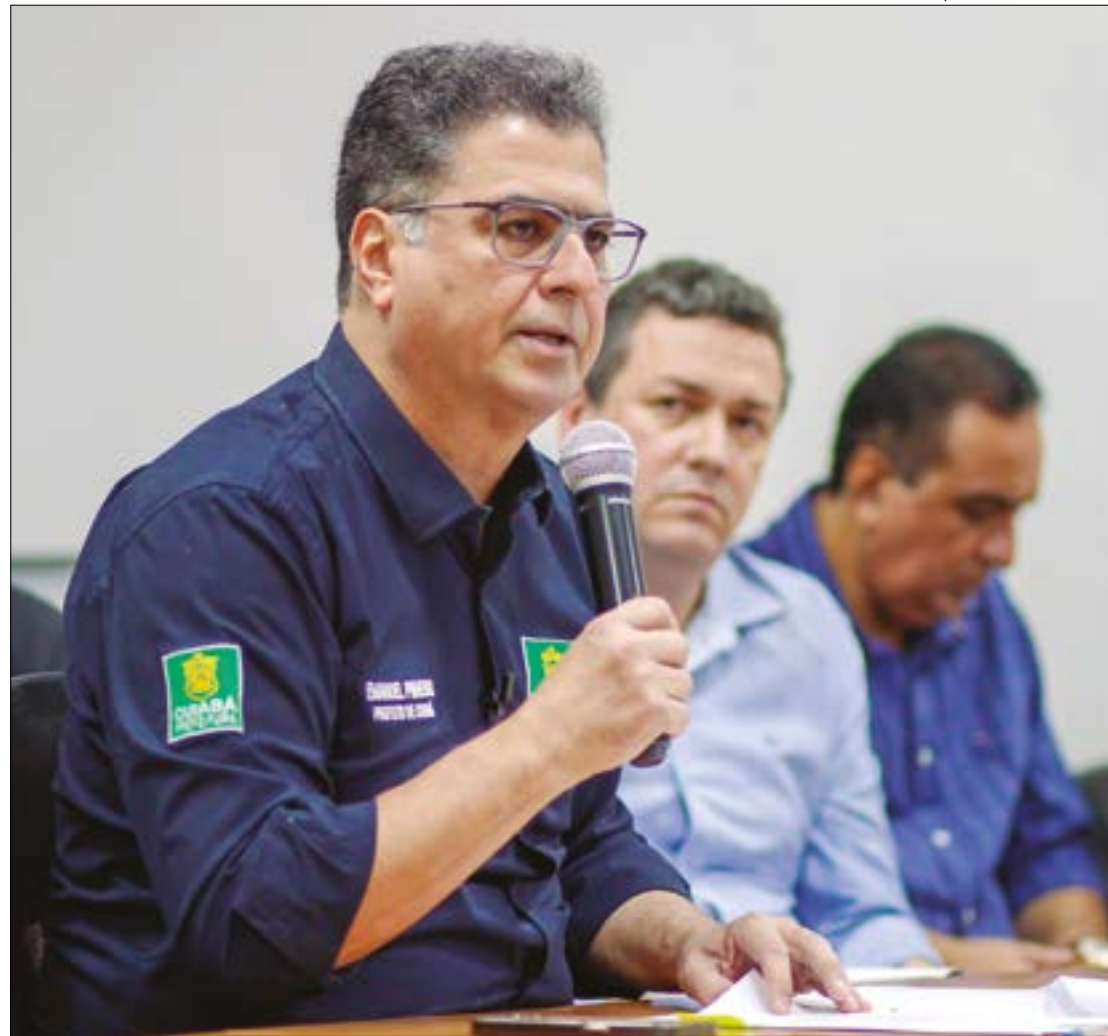
Apesar da situação, o decreto não afasta o cumprimento do TAC firmado pela interventora do Estado e o MPMT