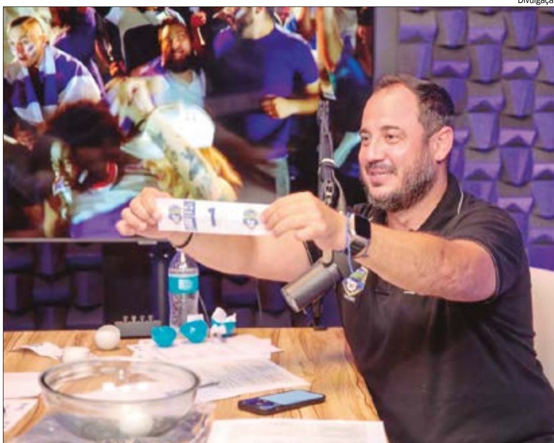
Peladão chegou à fase dos 128 melhores times e sorteio definirá os próximos jogos

“Os polos Jangada/Acorizal e Nobres/Bom Jardim ainda vão definir seus representantes. Os jogos acontecem neste sábado (10), e no dia 18 de fevereiro, respectivamente. Estamos muito felizes com os resultados até aqui. Começamos esta edição com 730 equipes e chegamos à fase dos 128 com muita tranquilidade e alto nível técnico por parte das equipes. Esperamos que continue assim e que na grande final, em julho, vença a melhor equipe”.