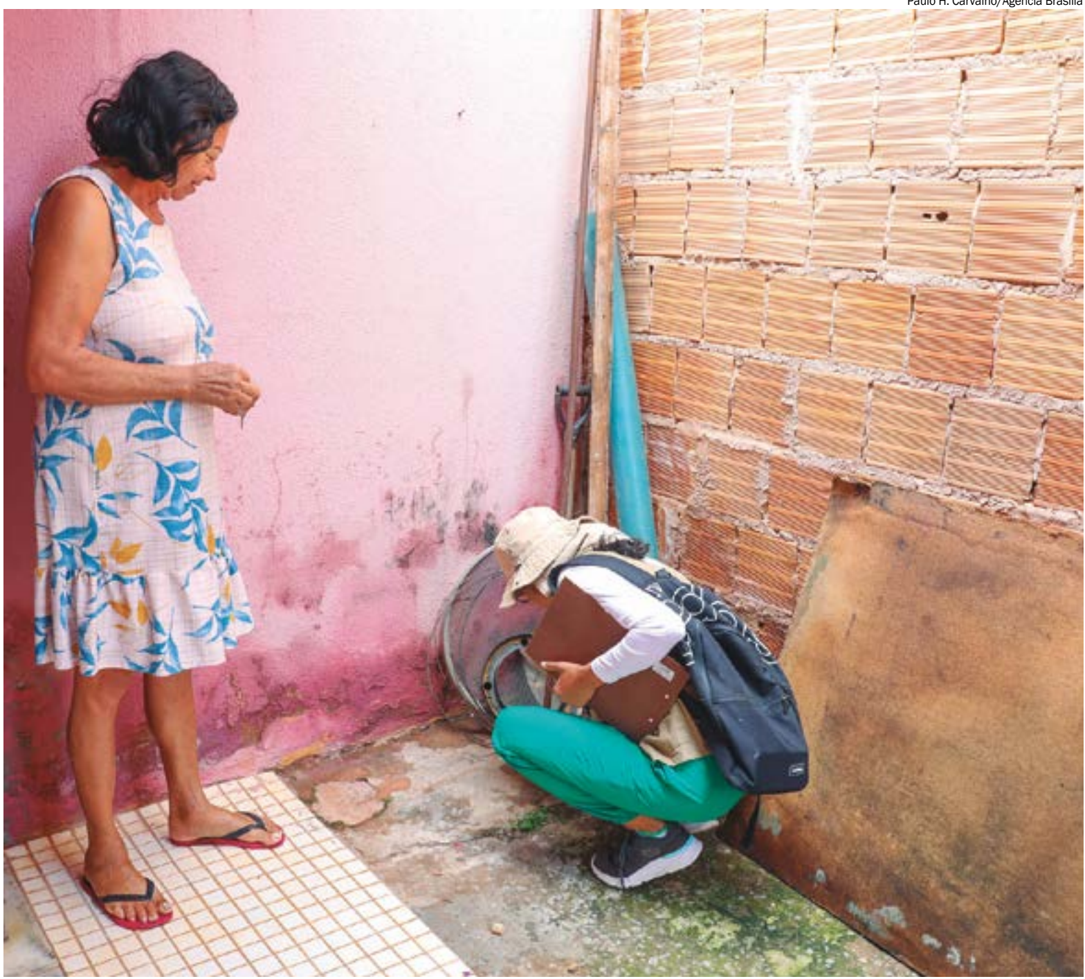
Paulo H. Carvalho/Agência Brasília