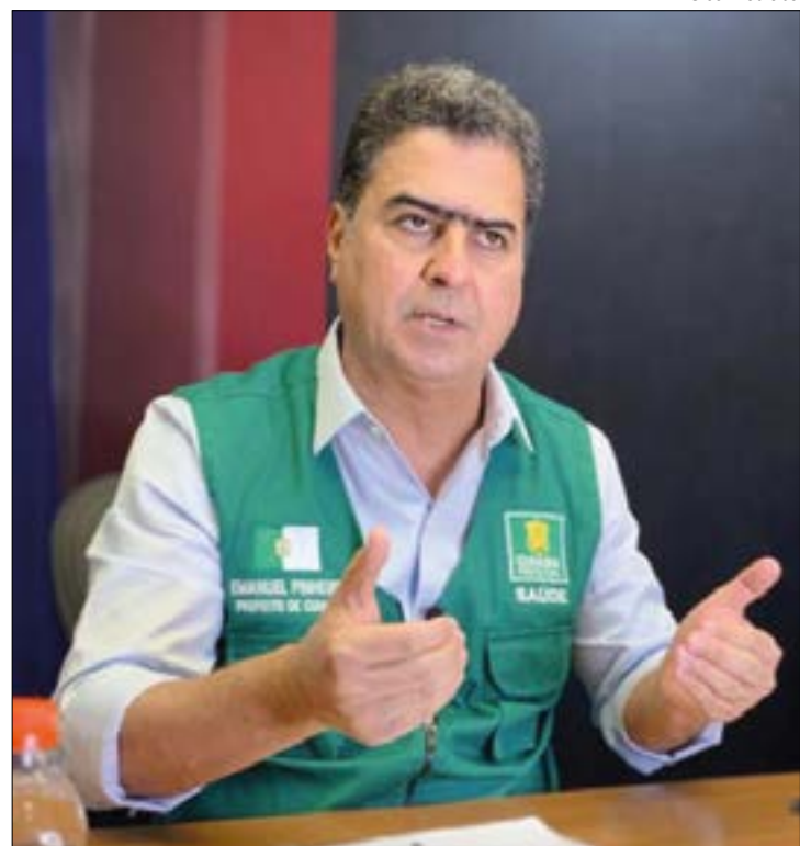
Pinheiro prega união com órgãos fiscalizadores para combater a pandemia