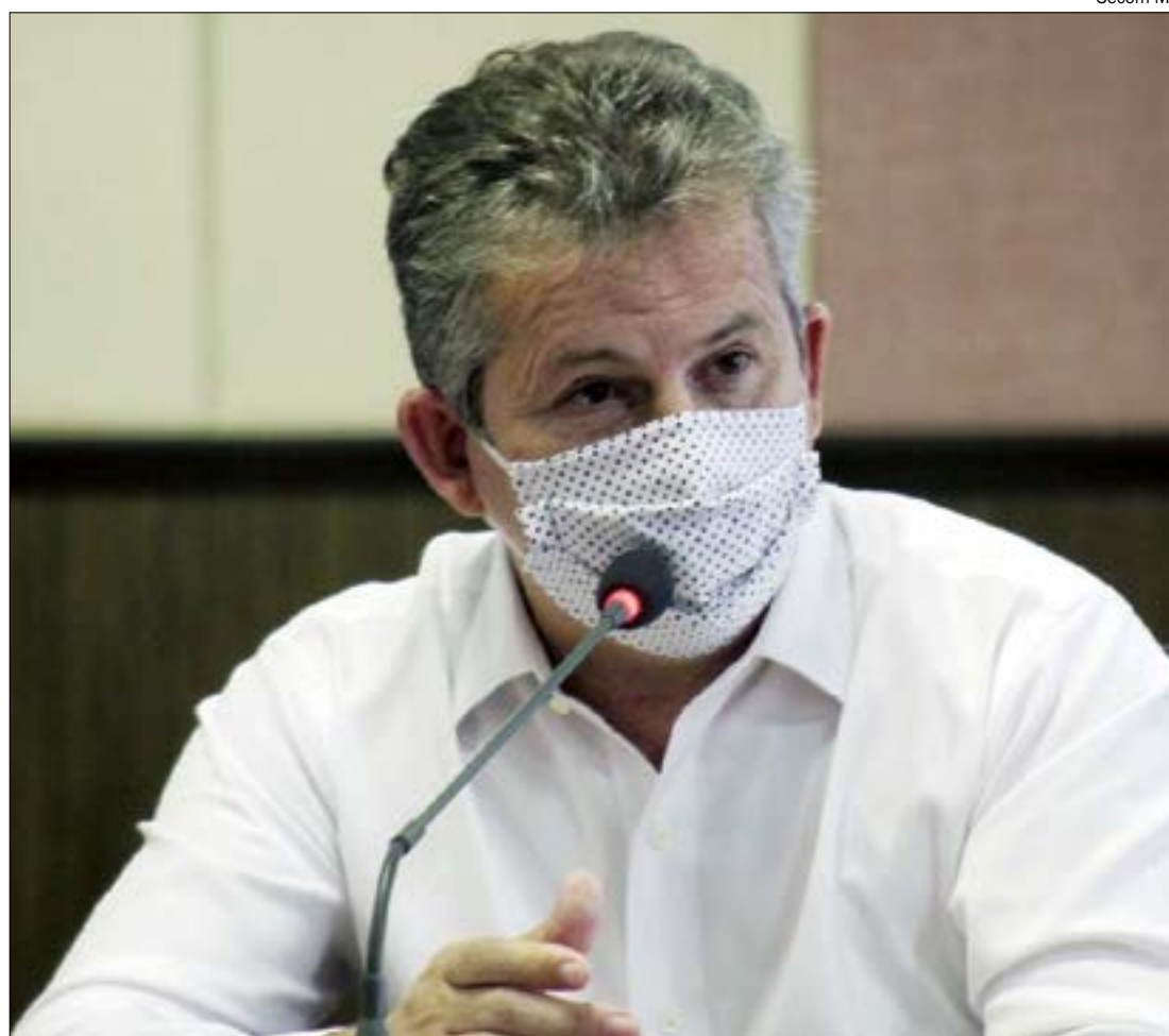
Mendes revela que há nove UTIs prontas, mas não puderam ser abertas por falta de profissionais

Com o número crescente de casos confirmados e de mortos por causa da pandemia, cresce também a utilização de