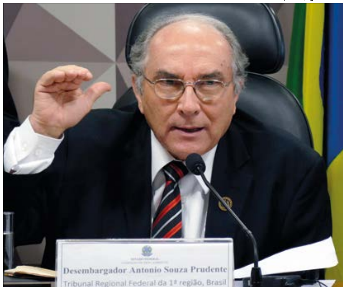
Desembargador destaca que sistema de saúde “não está preparado para absorver toda a demanda”