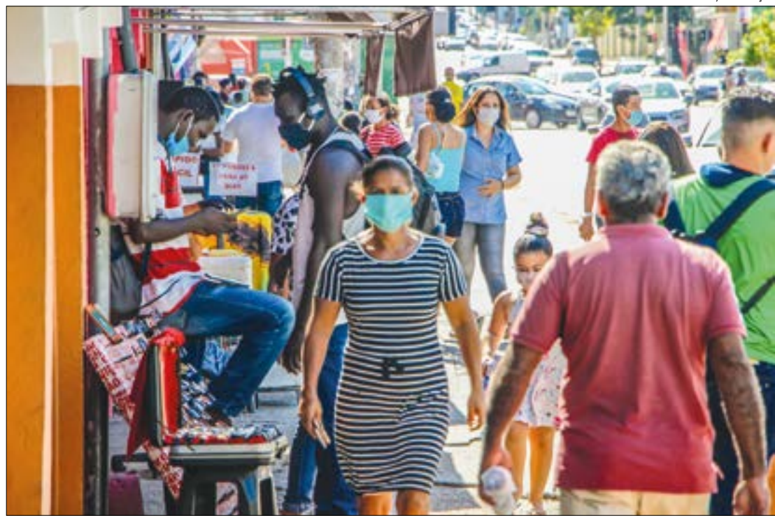
São apenas 12 perguntas com alternativas de sim ou não. Os dados pessoais não serão divulgados e a localização também é anônima

O Rede Cidadão Covid-19 Cuiabá – Várzea Grande faz parte do Projeto de Extensão Plano de Gestão para o Centro Histórico de Cuiabá, da Faculdade de Arquitetura Engenharia e Tecnologia (Faet), que tem o apoio da Faculdade de Economia (FE), Instituto de Engenharias (Ieng), do Escritório de Inovação Tecnológica (EIT), e do Programa