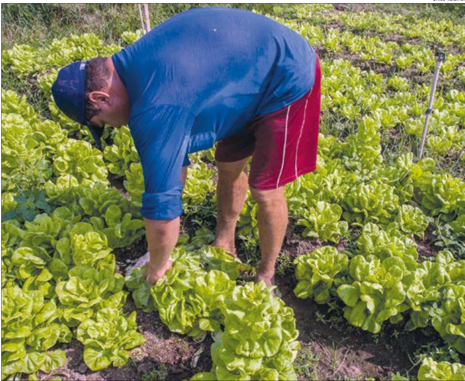
Presidente da Aprosoja defende que produtor não pode ficar esperando dez anos pela regularização fundiária

“Os grandes fundos de investimentos administram fortunas das famílias, de empresas, fundos previdenciários que não querem ver suas marcas e seus nomes associados à destruição do meio ambiente, especialmente da Amazônia. Grandes empresas europeias já estão fazendo um boicote silen-