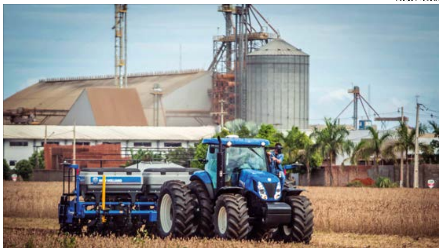
MT manteve a liderança na produção de soja, assumida há mais de duas décadas e estimada em 34,43 milhões de toneladas este ano