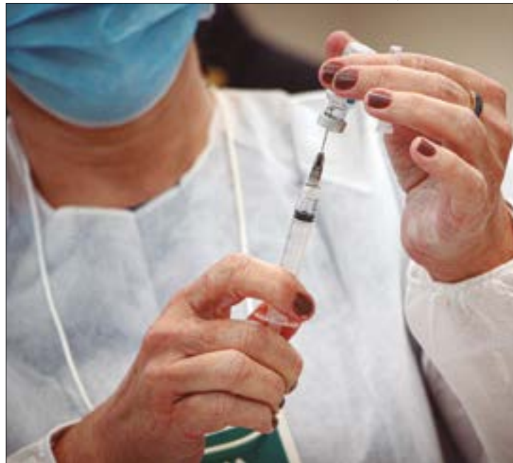
A população deve ficar alerta e retomar os cuidados de prevenção da doença