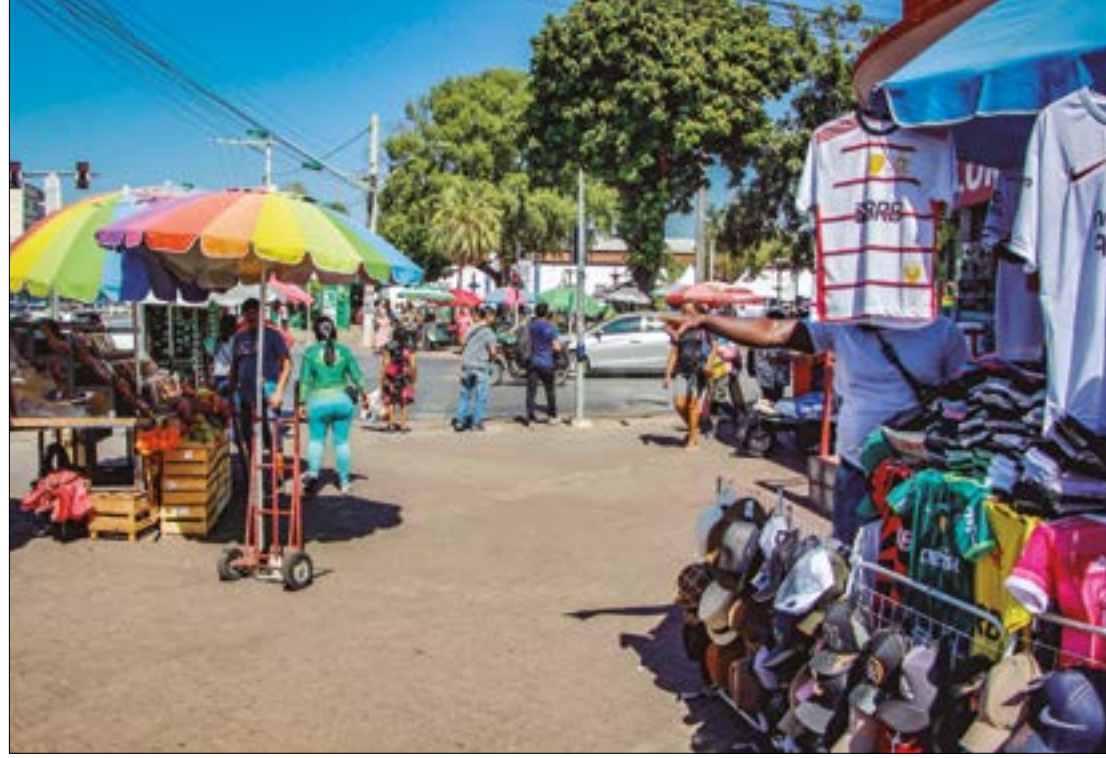
Empregadores não precisam pagar horas extras ou fazer quaisquer outras compensações no período