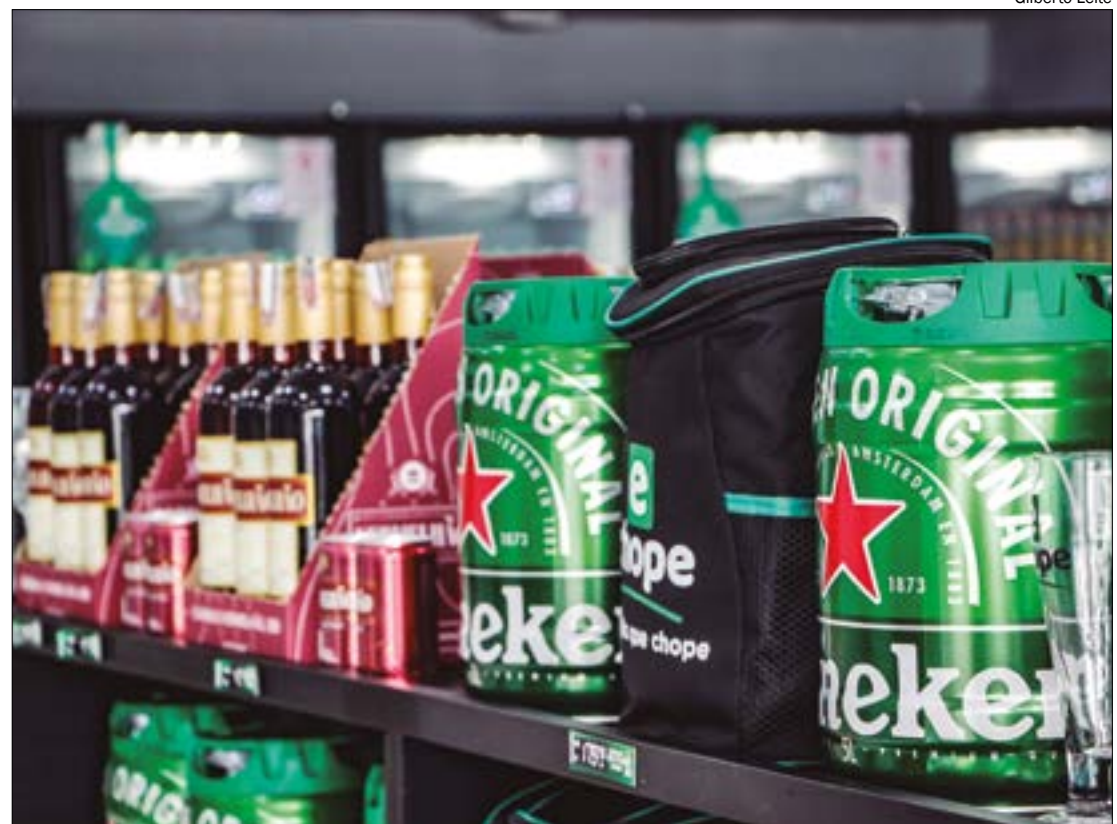
Para curtir a folia, é preciso pôr a mão no bolso, já que alguns itens ficaram mais caros este ano

Pesquise preços: Pesquise preços de alimentos, bebidas e outros itens antes de comprar.