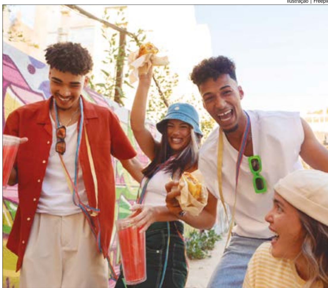
Ilustração | Freepik

Para aqueles que planejam participar das festividades, a pesquisa revela que 8% optarão por come-