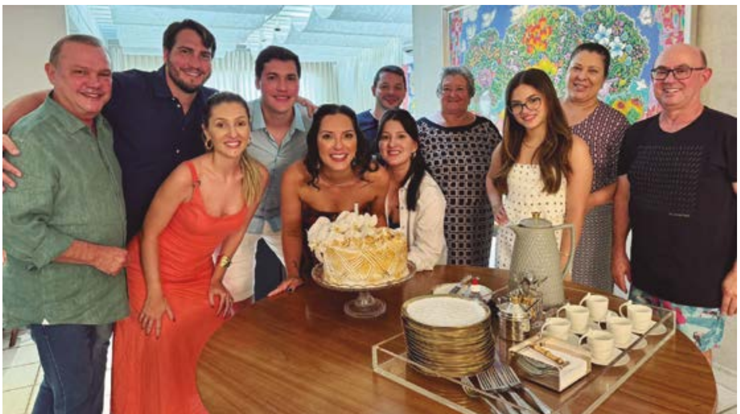
A deputada estadual Janaina Riva comemorando mais um ano de vida ao lado da família e amigos