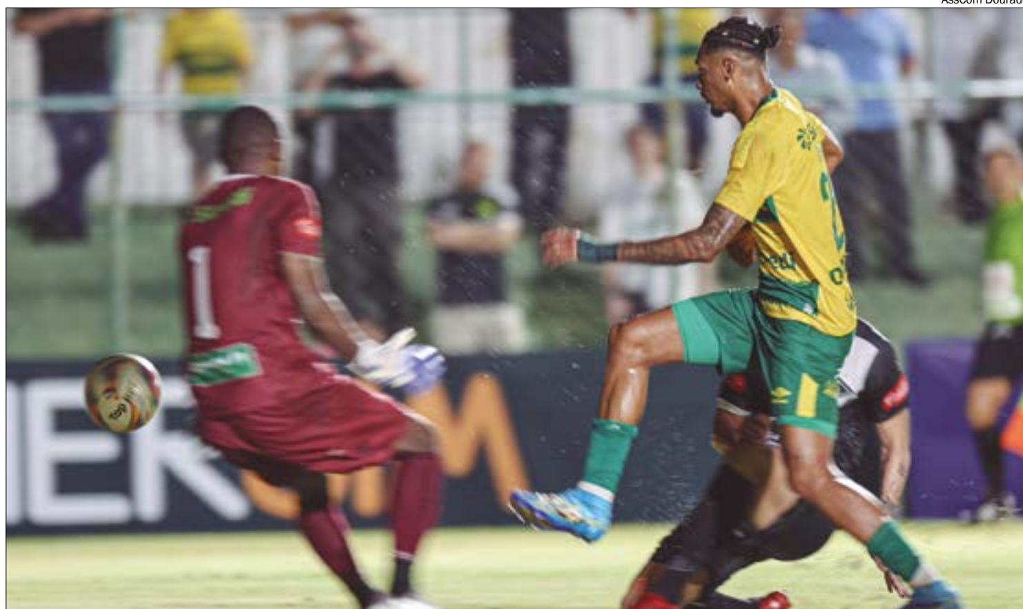
Com mais essa vitória, Cuiabá se firma na segunda posição, atrás do União, que mantém uma campanha perfeita