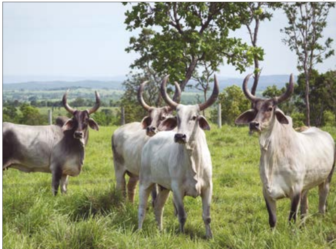
Agora, seis novos estados poderão importar carne bovina brasileira; entre eles, Mato Grosso