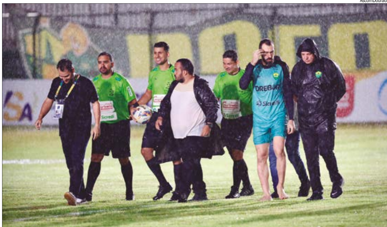
Partida entre o Cuiabá e o Mixto é adiada por falta de condições do gramado do Dutrinha

Por conta disso, o jogo que ocorre nesta segunda será reiniciado após 25 minutos da primeira etapa, momento em que foi paralisado pela arbitragem. Nenhum time marcou pontos; portanto, o placar está zerado.