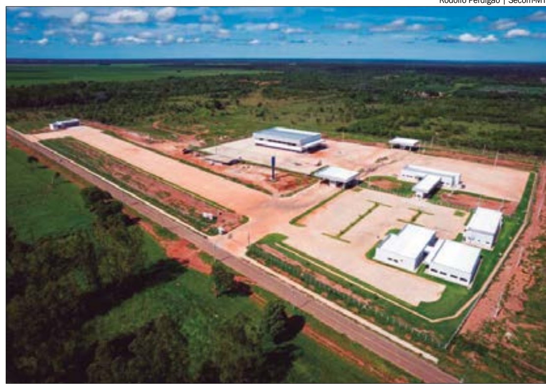
Devido à proximidade com países vizinhos, Cáceres tem um enorme potencial para integração econômica