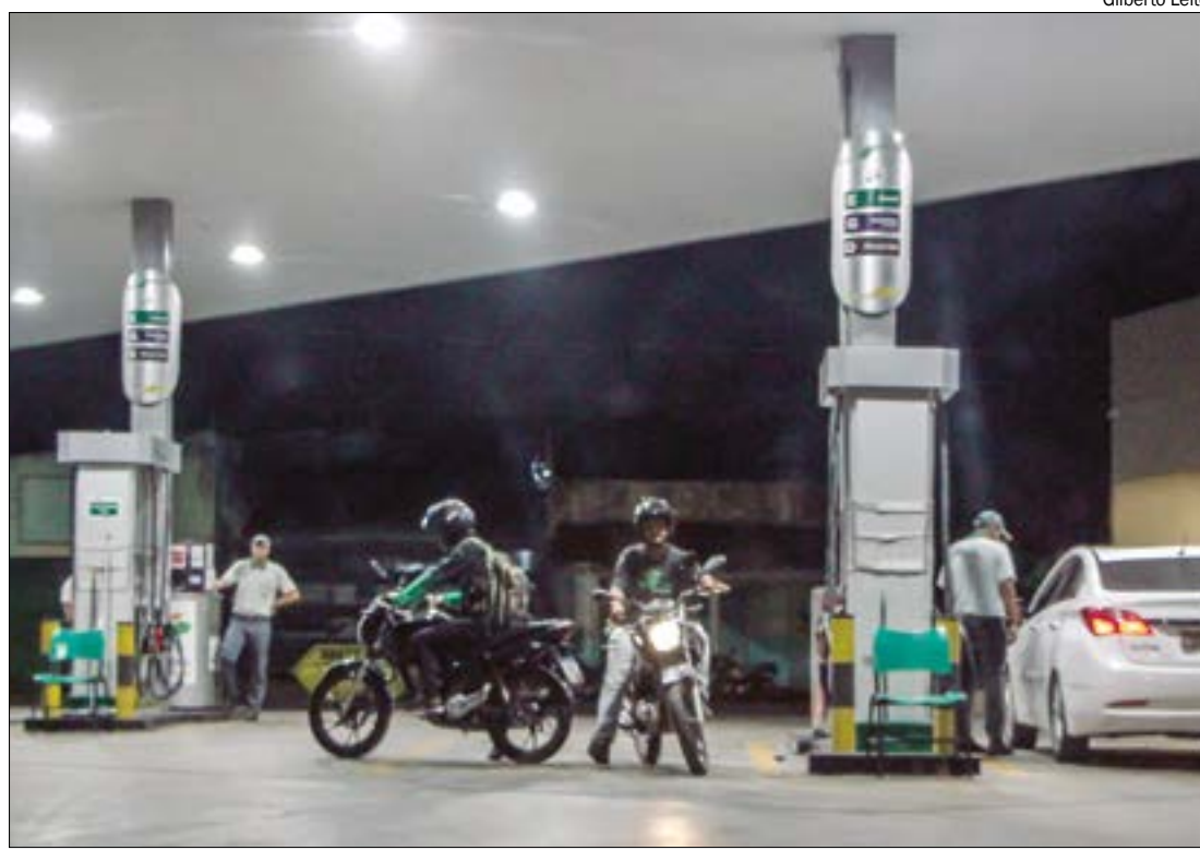
Aumento de imposto foi decidido no ano passado e deve chegar a 15 centavos por litro, no caso da gasolina

No caso do gás de cozinha, o botijão de 13 quilos terá um aumento médio de R$ 2,62, passando de R$ 100,98 para R$ 103,60. O