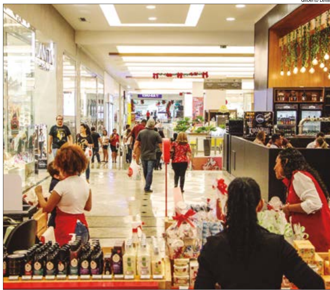
Piso dos trabalhadores do comércio em MT será maior que o salário mínimo nacional