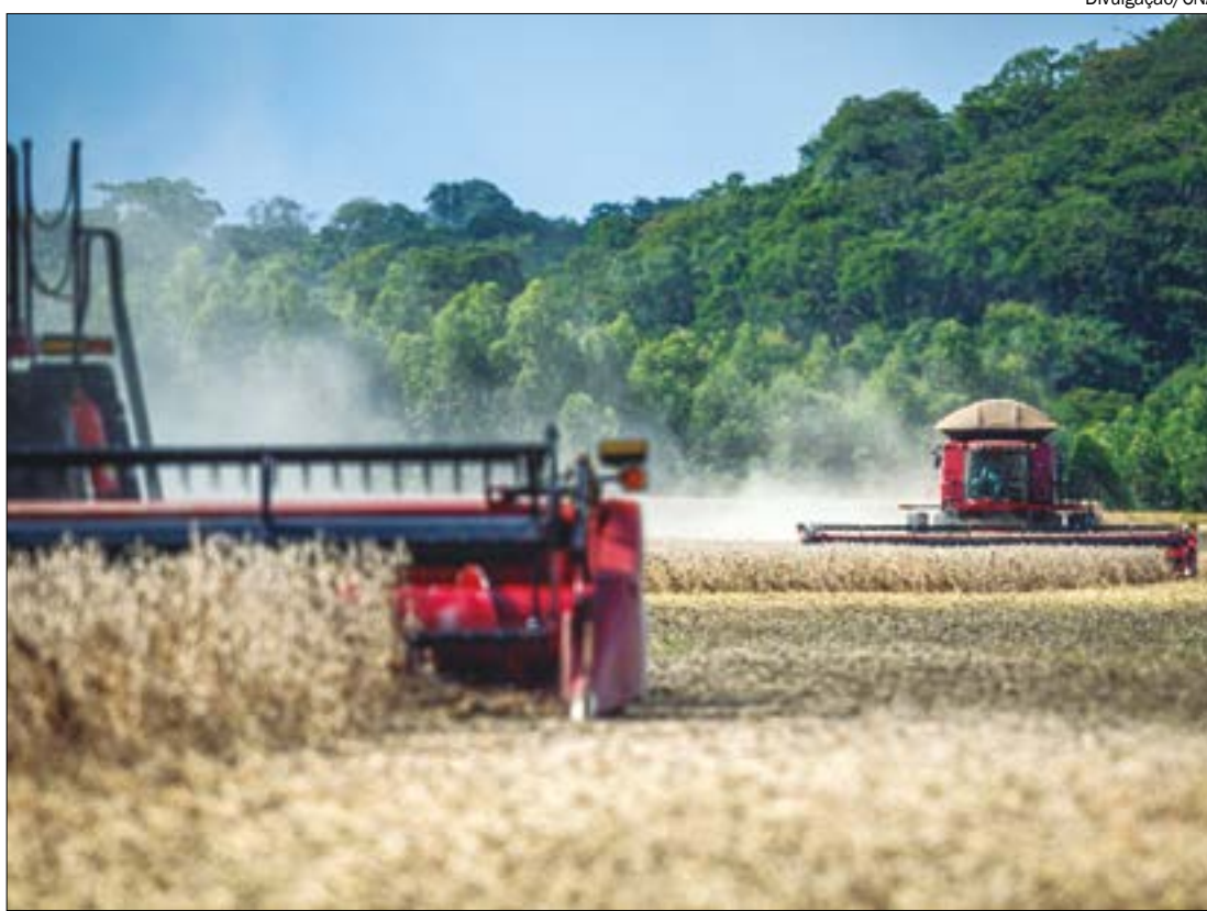
Pesquisas feitas pela Aprosoja apontam que safra de soja deve ter quebra de mais de 20% em Mato Grosso

campo para o mercado de commodities. Lucas calcula que um eventual aumento na cotação da soja, na casa dos R$ 10 por saca, considerando uma produtividade de 50 sacas por hectare, injetaria R$ 22 bilhões a mais na economia brasileira. Já no cenário matogrossense, o aumento seria de mais de R$ 6 bilhões, gerando mais movimento na economia e na geração de empregos.