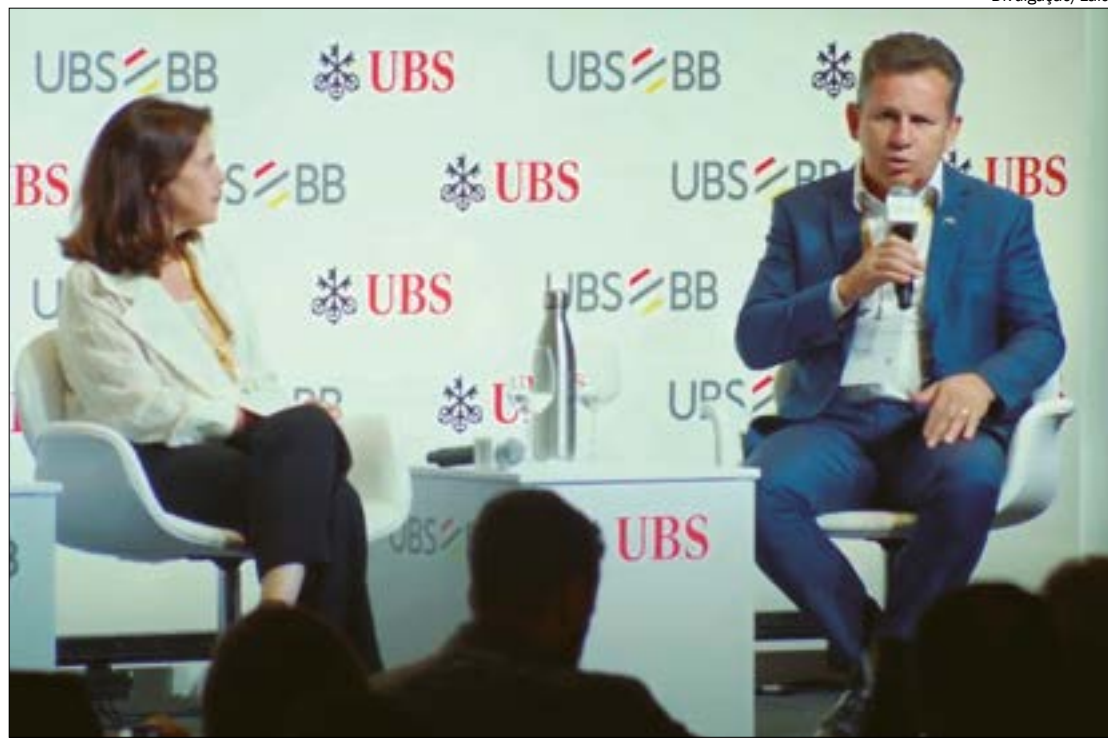
Segundo Mauro, desoneração completa das cadeias produtivas para exportação causará prejuízos a Mato Grosso

essa reforma se o congresso nacional não for capaz de enfrentar os gargalos que nós temos no estado brasileiro sem esse princípio", finalizou.