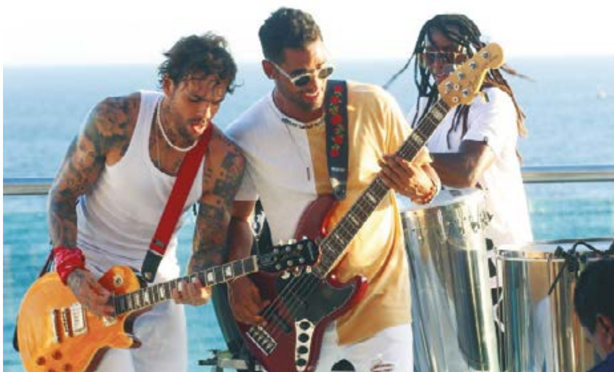
A banda Jammil, que promete arrasar na Feijofolia, em Chapada dos Guimarães

Assistir a um filme em uma sala de cinema com bebês pode ser desafiador e desconfortável para muitos pais e graças ao projeto CineMaterna, essa experiência torna-se mais agradável e acessível. O Goiabeiras Shopping, em parceria com o Cinemark, apoia esse projeto que visa proporcionar momentos de entretenimento para mães e seus bebês. A primeira sessão do projeto neste ano acontece no dia 07 de fevereiro. Embora os filmes sejam direcionados principalmente para o público adulto, o ambiente da sala é adaptado para acomodar os pequenos espectadores.