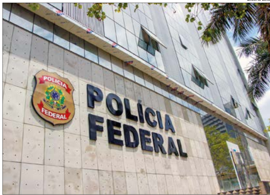
A empresa de fachada alugava veículos, imóveis e reservava hotéis na região de fronteira facilitando ação do grupo