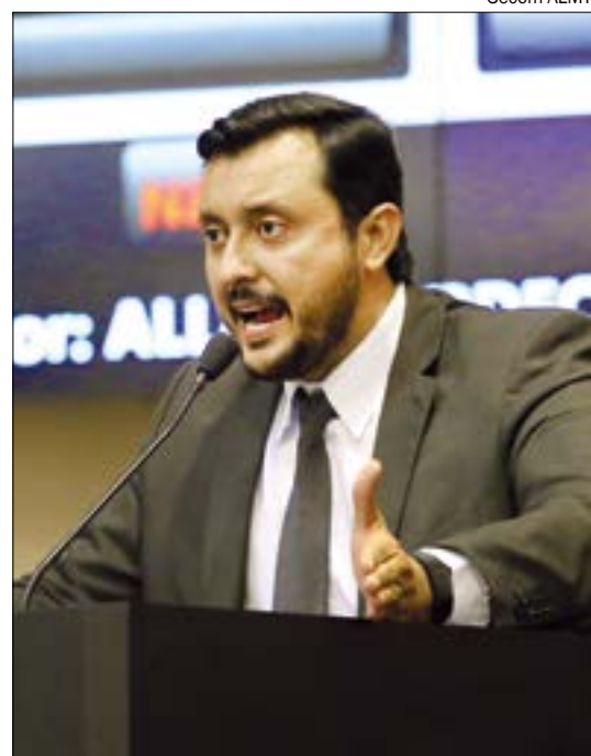
Kardec sofreu pressão dos servidores pelo fato de seu suplente ter votado a favor da reforma

Mato Grosso, assim como todos os outros estados e municípios do país, precisa aplicar uma alíquota média de 14% a seus servidores públicos, como consequência da aprovação da reforma da Previdência nacional. Também é necessário fazer uma série de adequações nas regras de aposentadoria, o que tem sido o principal ponto de divergência entre deputados, servidores e governo. A Casa tem até 31 de julho para sancionar a reforma para que não sofra penalização da União.