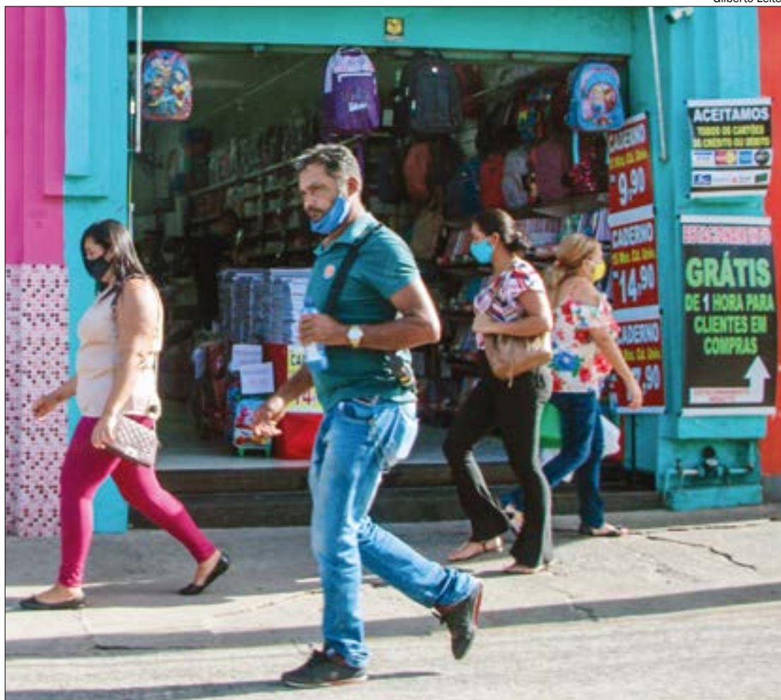
Apesar da quarentena, as ruas da capital continuam cheias de gente circulando

Na prática, as ruas da capital continuam lotadas de pessoas, os casos continuam crescendo e o número de óbitos aumenta a cada dia.