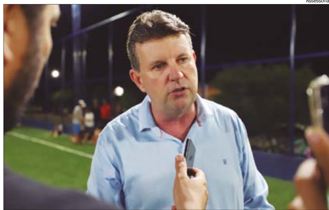
Lafin prepara candidatura para deputado federal e espera pesquisa para escolher sucessor em Sorriso

O prefeito lamenta que a cidade, considerada uma das maiores potências do agro do país, não tenha conseguido eleger um representante na Assembleia Legislativa e nem para a Câmara Federal.