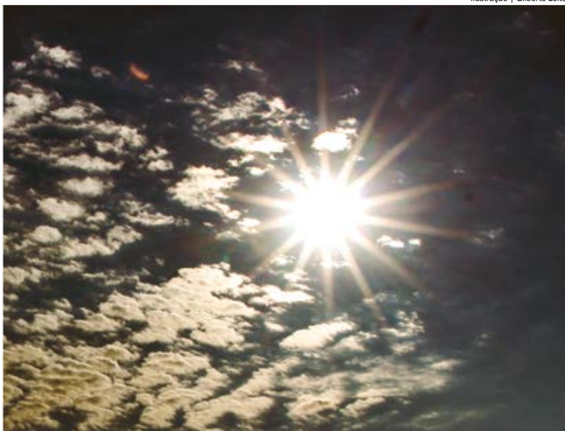
Ilustração | Gilberto Leite

O município de Araguaiana (560 km de Cuiabá) decretou, por 60 dias, situação de emergência devido à estiagem intensificada desde outubro do ano passado. O decreto, publicado em 15 de janeiro, no Diário Oficial, destaca que a escassez de chuvas impactou significativamente a