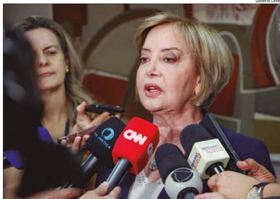
Desembargadora cobra uma solução urgente para o impasse que já dura mais de 10 anos em Cuiabá

Na mesma semana, o Ministério Público Estadual (MP-MT) reafirmou a ausência de documentos legais autorizados pela prefeitura. No entanto, o órgão fiscalizador deu um prazo de 45 dias para que o municí-