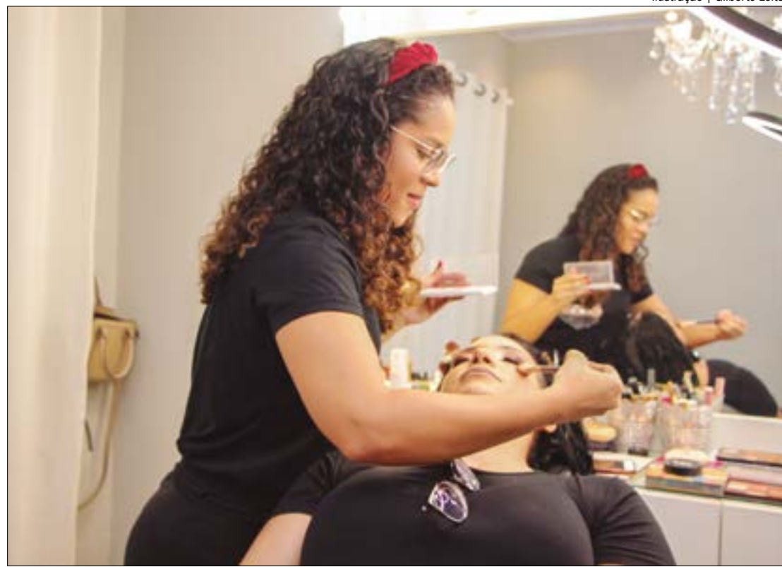
Ilustração | Gilberto Leite

A opção pelo Simples Nacional está disponível para microempresas e empresas de pequeno porte até o dia 31 de janeiro