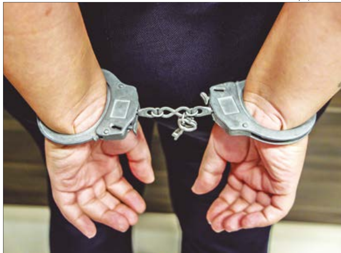
Ilustração | Gilberto Leite

A empresária terá que usar tornozeleira eletrônica, além de ter o passaporte e CAC suspensos