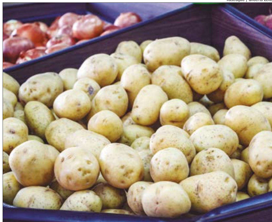
Ilustração | Gilberto Leite

Valor da cesta básica em janeiro em Cuiabá bateu um novo recorde. O preço da batata, óleo de soja e do tomate estão "mais salgados"