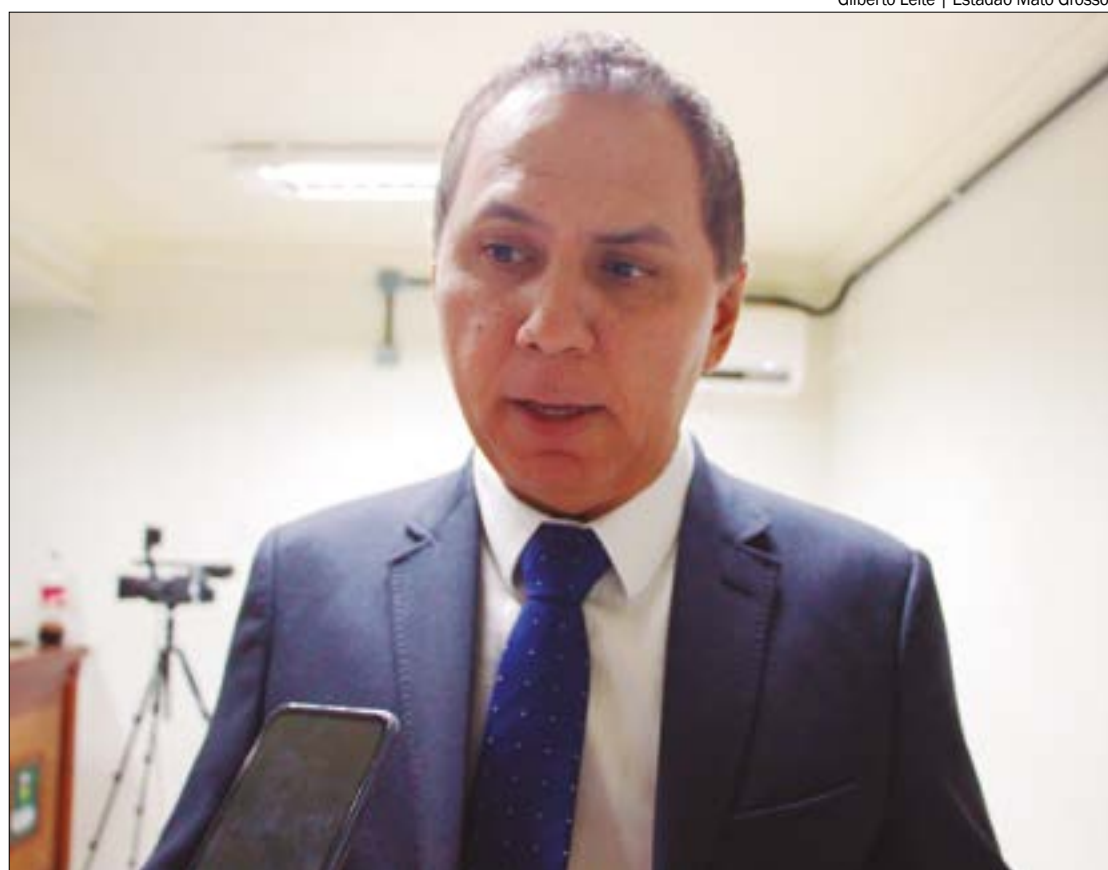
Segundo Dilemário, o aumento ocorreu sem a mínima discussão com a Câmara Municipal e sem a realização de uma audiência pública

Os dois parlamentares pedem que o MP adote as medidas cabíveis em busca de promover o cancelamento da nova taxa.