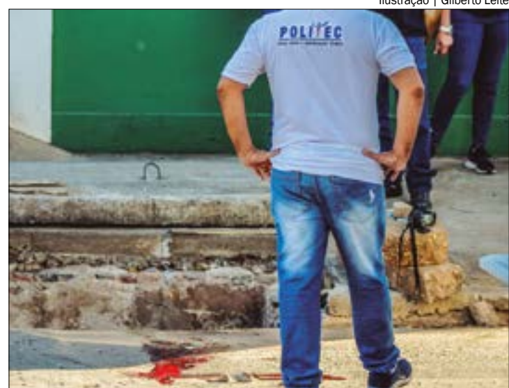
Ilustração | Gilberto Leite

Eleandro, vulgo "Profeta", foi morto possivelmente devido ao seu envolvimento com uma facção criminosa