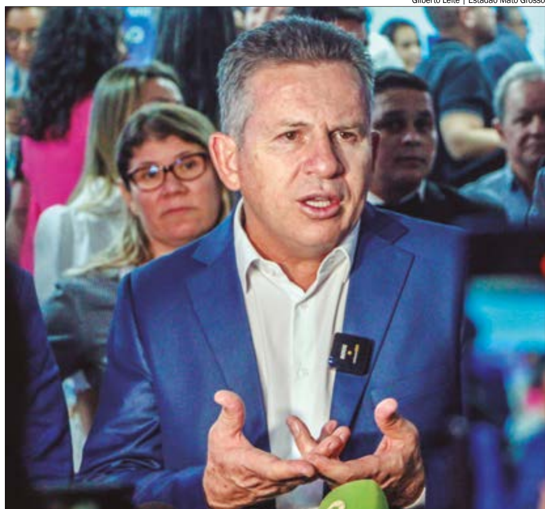
O governador Mauro Mendes (União) assegurou que as obras do BRT em Cuiabá vão prosseguir