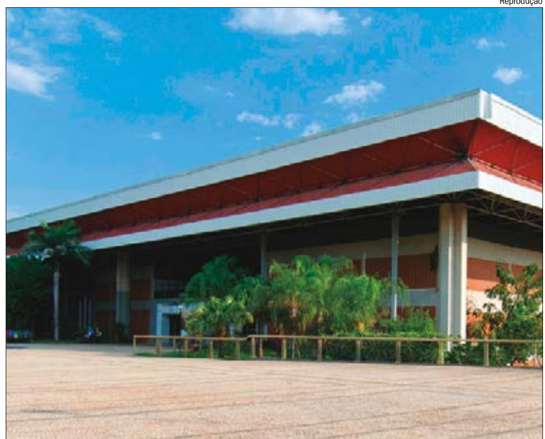
Em 2023, o Centro de Eventos do Pantanal, em Cuiabá, recebeu 285 eventos nos quais reuniram cerca de 157 mil participantes

O trabalho e esforço empenhado para a realização dos eventos no Centro de Eventos do Pantanal resultou no maior reconhecimento do segmento por meio do 'Prêmio Jacaré de Prata'. A honraria foi concedida pelo