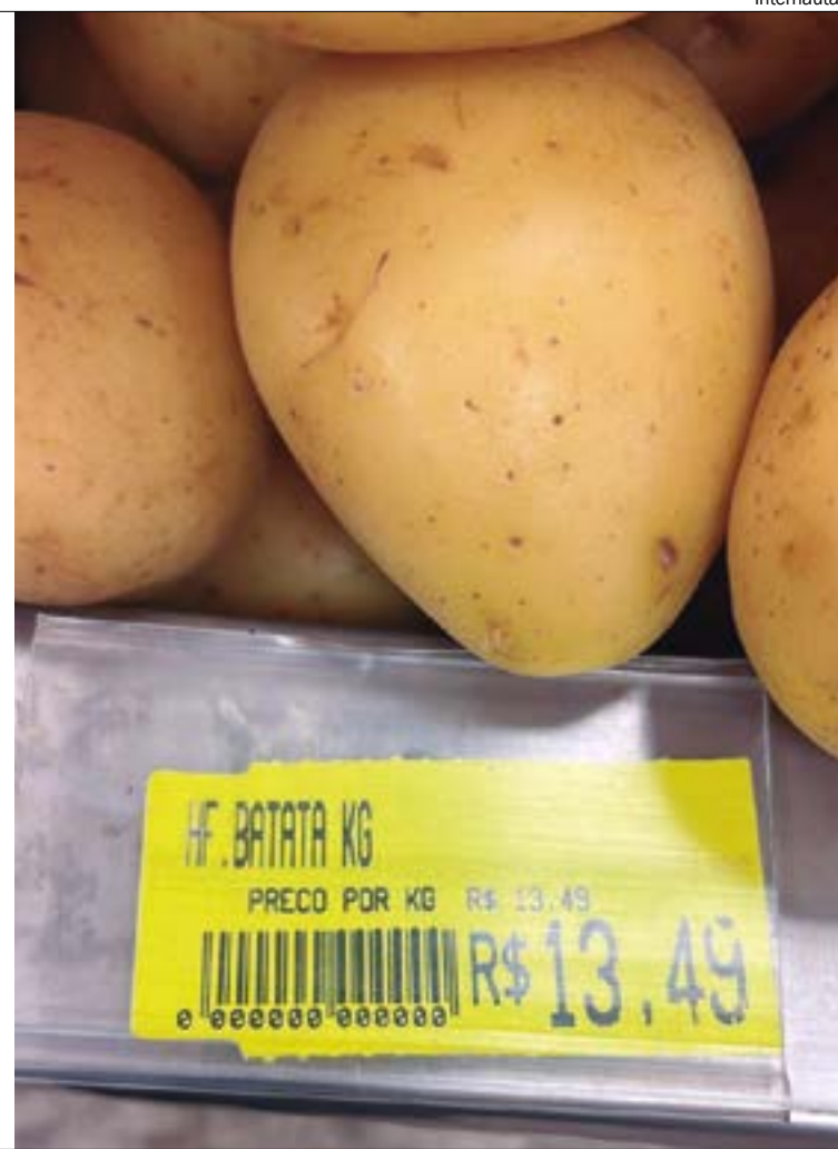
Preços de frutas, legumes e verduras dispararam devido ao aumento do frete e podem subir ainda mais

to porque as indústrias estão retornam ao trabalho entre 10 e 15 de janeiro. A partir de agora que teremos uma noção, no modo geral, de quanto vai subir na verdade.