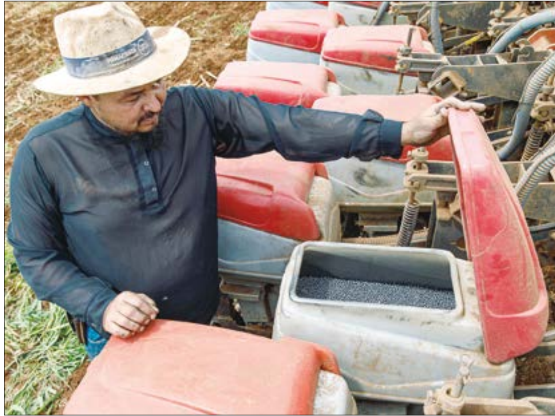
A produção agrícola é a mais afetada pela escassez de chuva. Há previsão de redução no plantio da safrinha em 2024

Ilustração | Marcos Vergueiro - Secom - MT