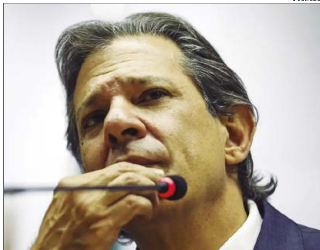
Haddad busca por um acordo sobre a MP que reonerará a folha de pagamentos

Na entrevista, o ministro disse que o objetivo da MP é permitir o crescimento do país com taxas de juros sustentáveis, argumentando que não pode prejudicar toda a sociedade com o custo da desoneração para dar vantagem a um setor específico.