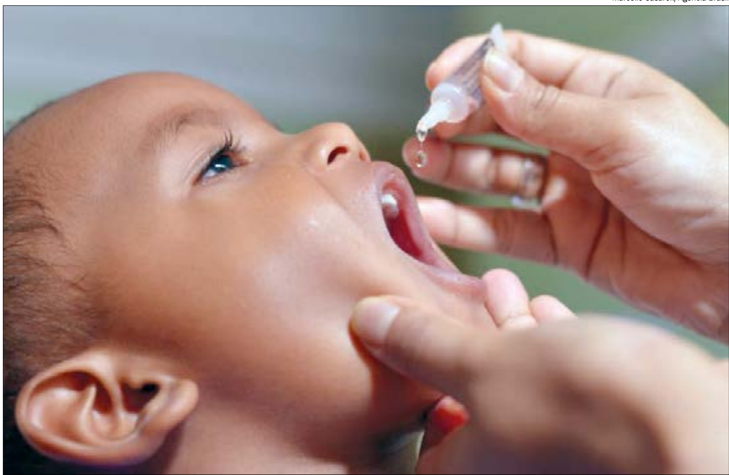
Pesquisadores brasileiros trabalham em uma estratégia de imunização por via oral, utilizando bactérias benéficas

“É uma abordagem metodológica diferente de outras estratégias, como atenuação viral ou utilização de outros vírus recombinantes. [...] Precisamos de muita gente nessa corrida científica e tecnológica, testando diferentes estratégias va-