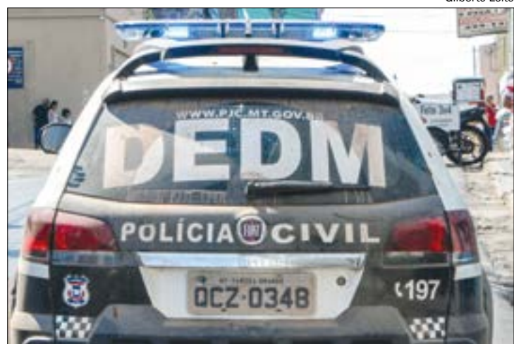
Duas mulheres foram ameaçadas de morte pelos ex-companheiros e acionaram a polícia para denunciar os agressores