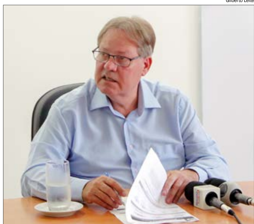
Figueiredo anunciou nesta terça (7) que está curado da covid-19 e volta à chefia da Saúde

O boletim informativo da SES de segunda-feira apontou que Mato Grosso já está com 93% dos leitos de UTI ocupados. O estado registra 22.078 casos confirmados de covid-19, com 8.974 pessoas curadas, 11.534 em isolamento domiciliar, 713 internadas e 857 vítimas fatais.