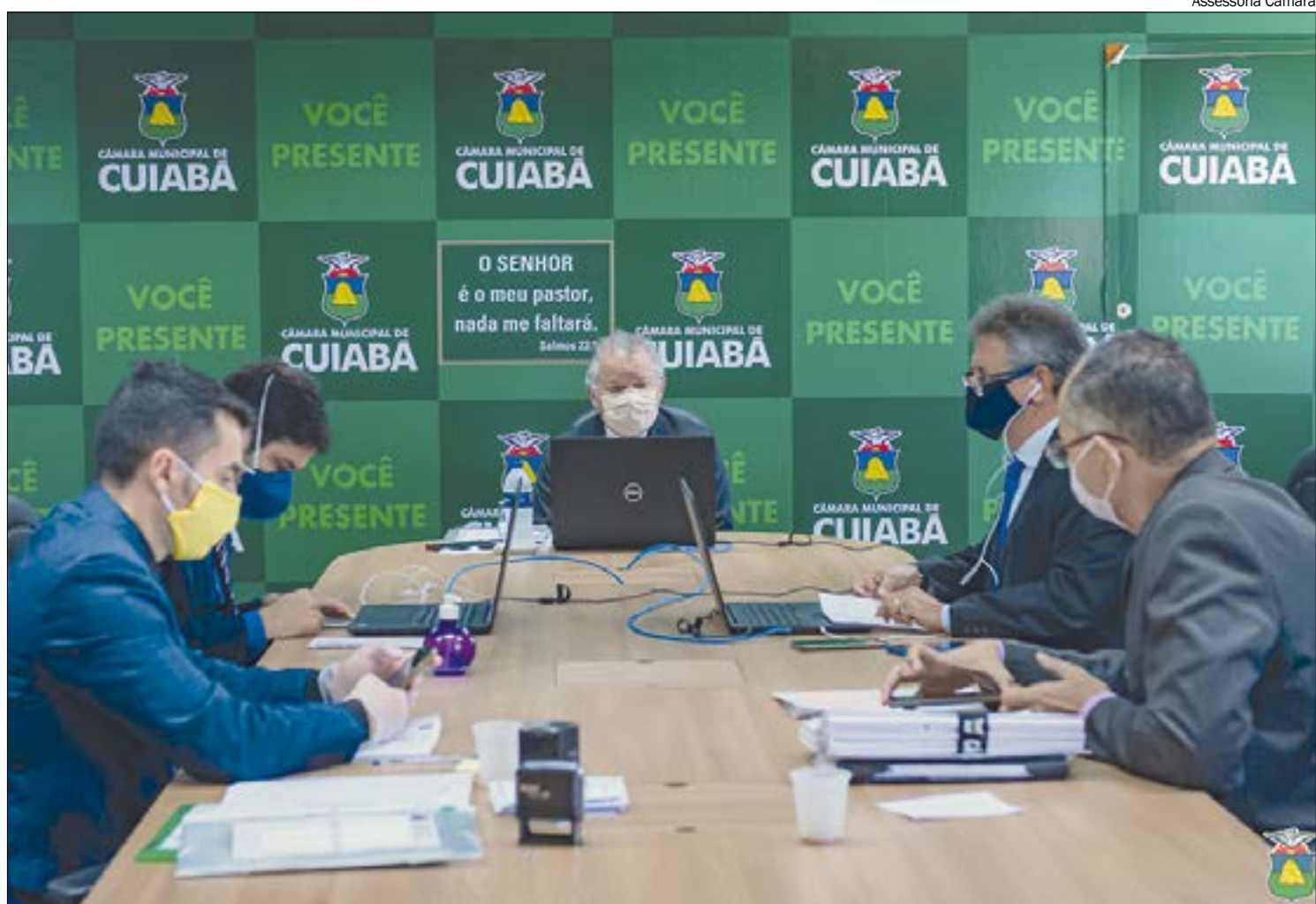
Apesar de ser uma versão mais branda, reforma da Previdência encontra resistência para aprovação na Câmara

O prazo para a realização da reforma da Previdência nos Estados e municípios termina no dia 31 de julho. Se não aprovarem as mudan-