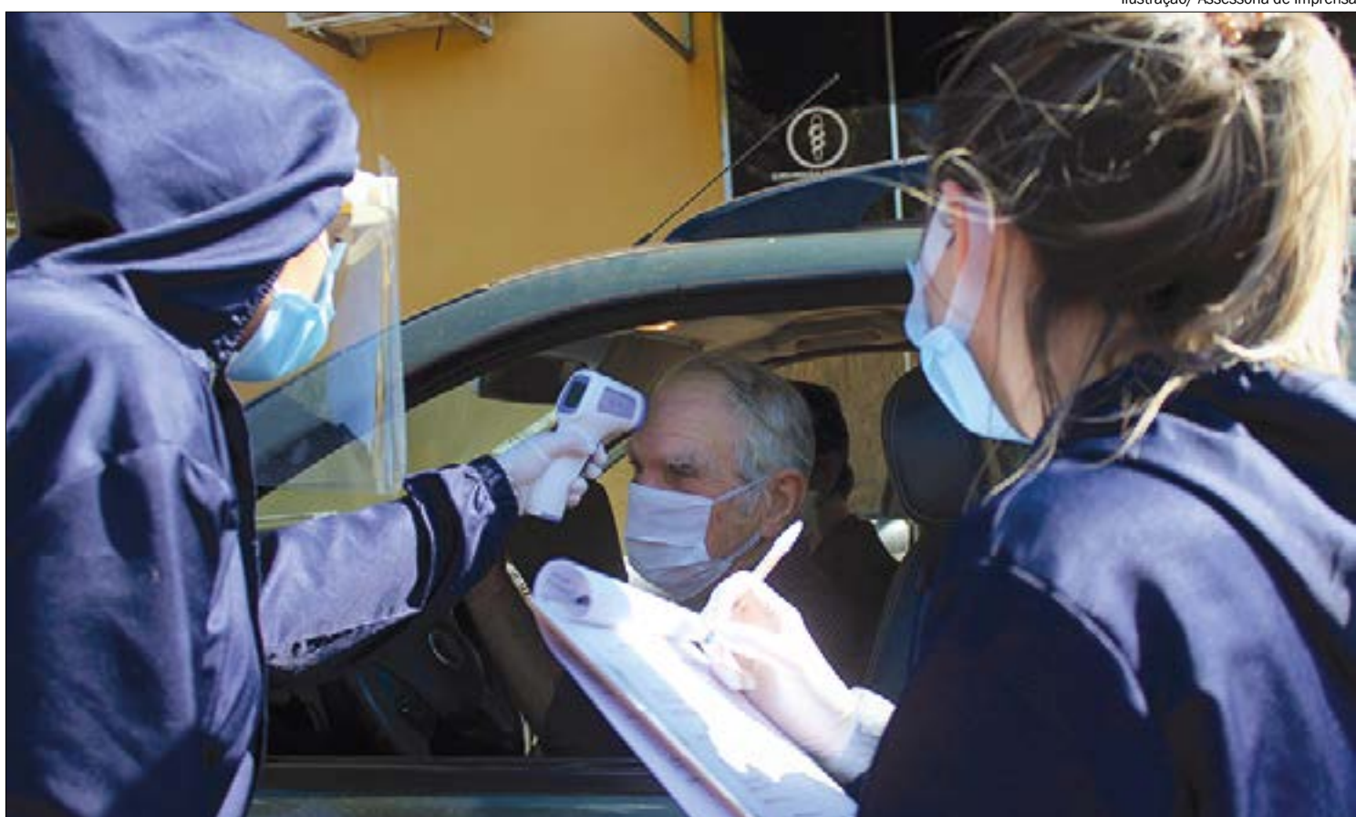
As estruturas estão previstas para ocorrer ao longo de 7 dias, das 8h às 12h e das 13h às 17h

Desde março, quando surgiram os primeiros casos de Covid-19 em Cuiabá, o prefeito Emanuel Pinheiro vem adotando medidas emergenciais e temporárias de prevenção ao contágio pelo novo coronavírus. No entanto, conforme boletim epidemiológico emitido pela Coordenadoria de Vigilância Epidemiológica, “desde a confirmação do primeiro caso da Covid-19, Cuiabá não apresenta atenuação no crescimento de casos