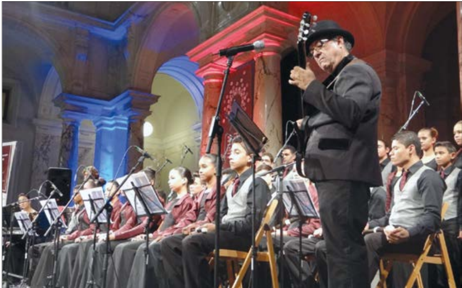
Programação do Cine Teatro conecta artistas regionais com o público em casa durante a pandemia

E, finalizando a programação da semana, no domingo (11.07), a violinista