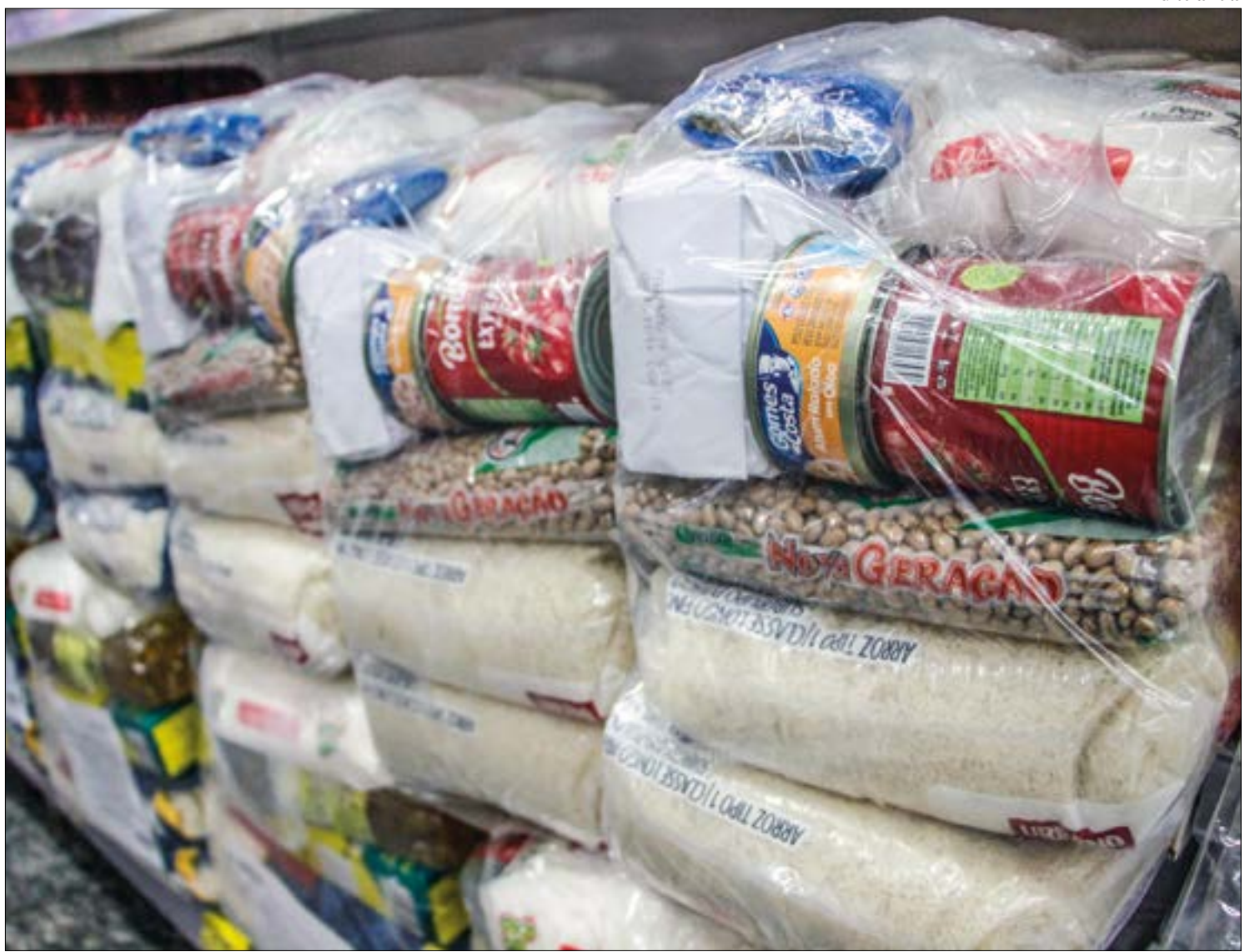
Cuiabanos pagaram quase R$ 50 a mais com cesta básica no mês de junho

Na lista dos produtos que encareceram na cesta em Cuiabá neste mês de junho, estão: a carne (6,6kg), o leite (7,5 litros