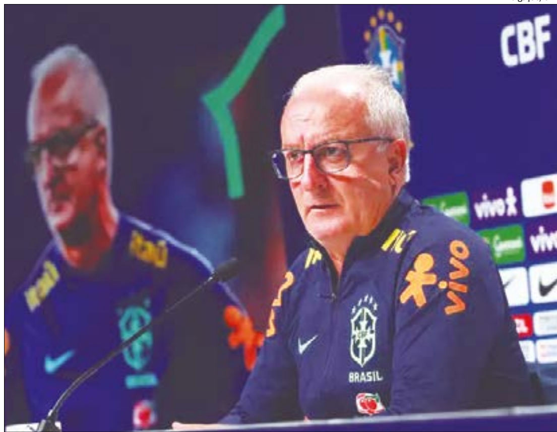
Para técnico Dorival Júnior, a camisa amarelinha demanda mais responsabilidade dos atletas

Antes de conceder a primeira entrevista coletiva à imprensa, Dorival fez um balanço de sua história no futebol brasileiro, iniciada aos seis anos, quando acompanhava o pai, diretor de futebol da Ferroviária. Prestes a completar 62 anos, Dorival trabalha há