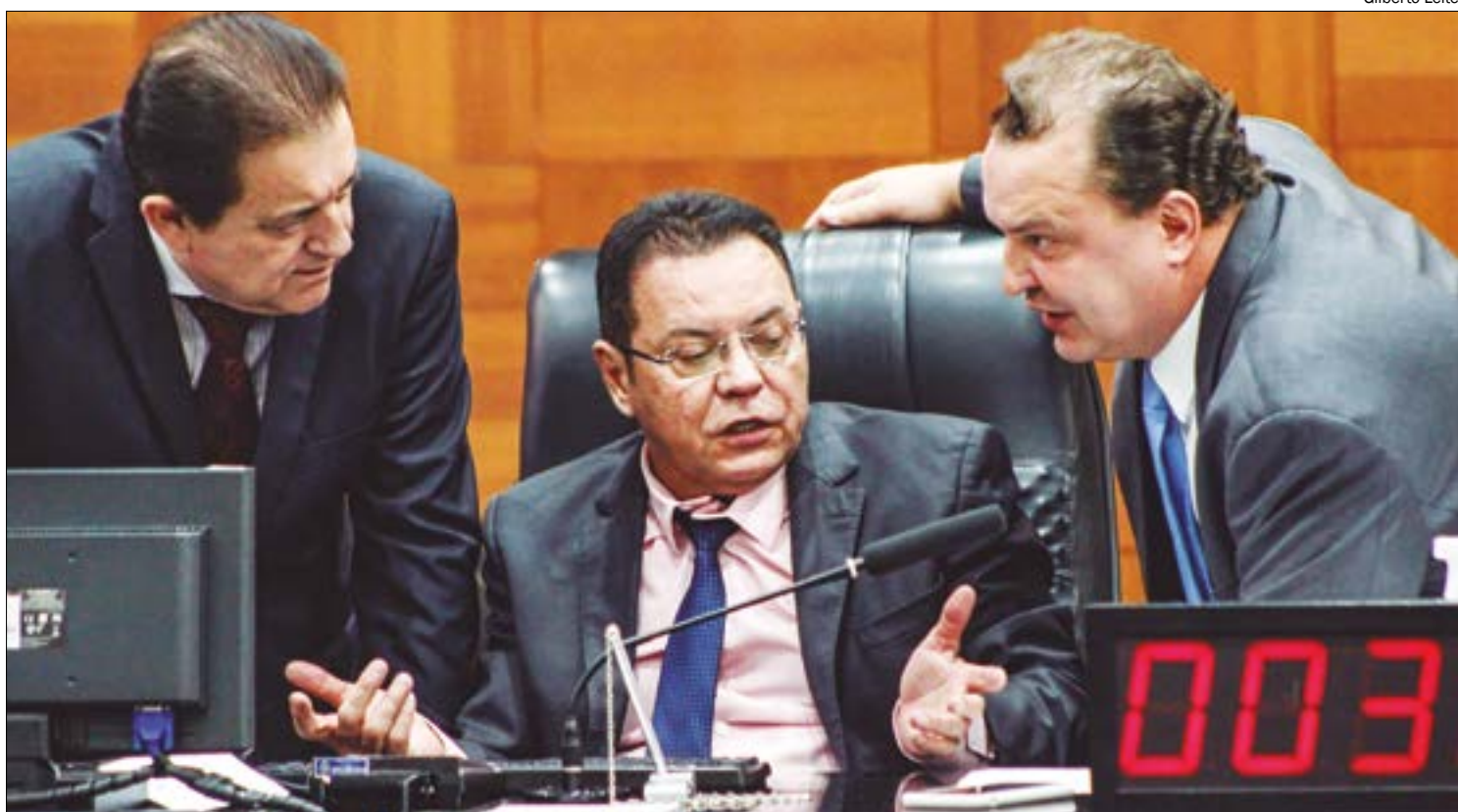
Deputados tentaram negociar com o governo um índice maior de reajuste, mas não tiveram sucesso

No entanto, Botelho ressaltou que a Assembleia Legislativa não tem mais poder para modificar o índice da RGA, após uma decisão do Supremo Tribunal Federal (STF) determinar cabe apenas ao Poder Executivo estipular o valor do reajuste dos servidores, que deve ser único para todos os órgãos.