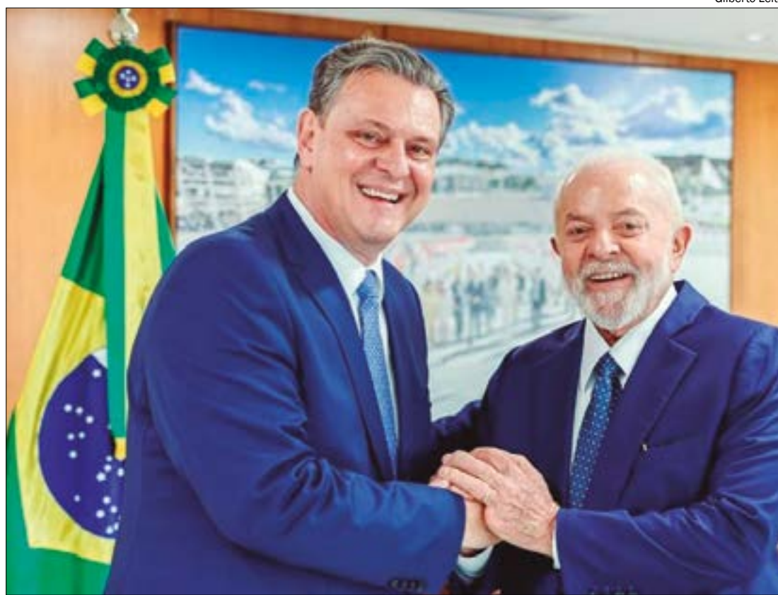
Segundo Fávaro, Lula perguntou se o PSD teria condições de indicar o vice na chapa da esquerda em Cuiabá

O ministro terá outra agenda com o presidente Lula para tratar sobre o pleito eleitoral das cidades de Cuiabá, Rondonó-