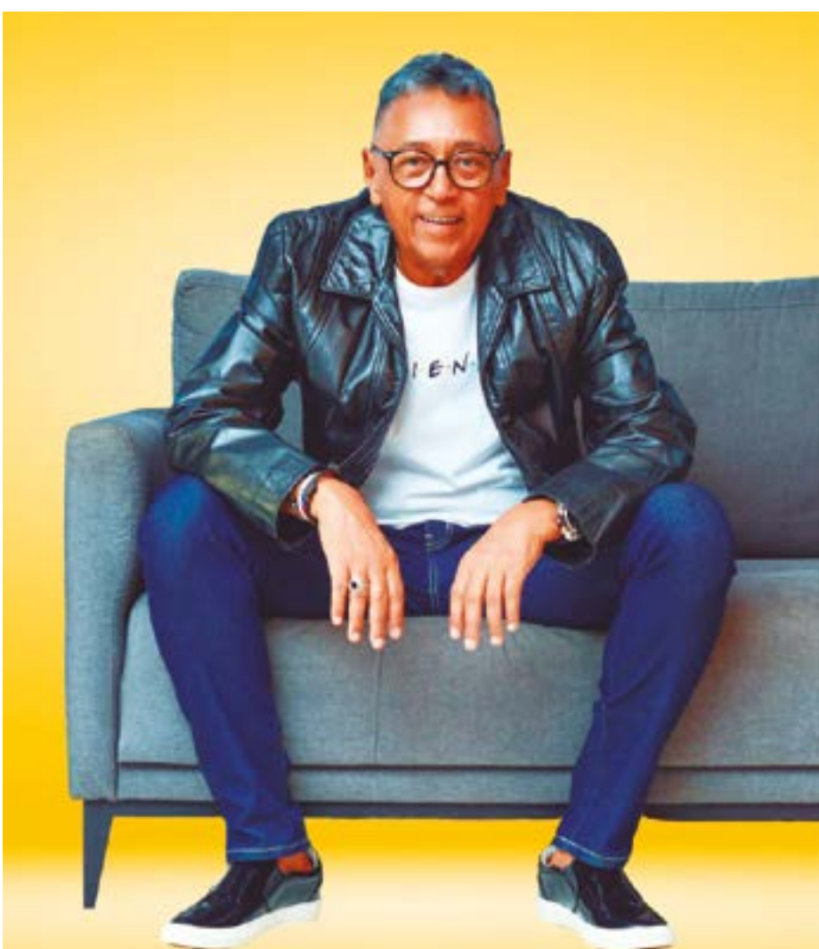
Grande amigo e padrinho da coluna, o famoso DJ Vasco Neves

Após 4 décadas de existência, a transferência via Documento de Ordem de Crédito (DOC) acabará na próxima segunda-feira, tanto para pessoas físicas como jurídicas. Além do DOC, deixará de ser oferecida a Transferência Especial de Crédito (TEC), modalidade por meio da qual empresas podem pagar benefícios a funcionários e que também está em desuso. Nos últimos anos, o DOC e a TEC perderam espaço para o Pix, sistema de transferência instantânea do Banco Central sem custo para pessoas físicas.