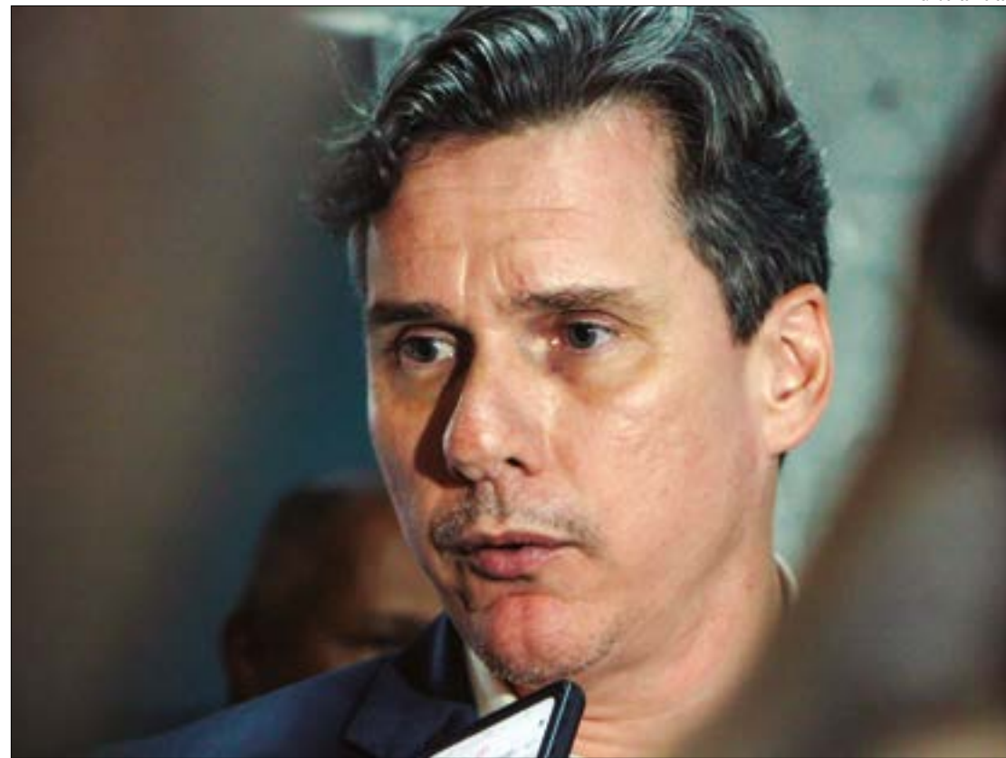
Gallo aponta que governo quitou dívidas significativas nos últimos anos, melhorando sua situação fiscal

Em 2023, pelo terceiro ano consecutivo, Mato Grosso foi avaliado com a nota máxima em todos os indicadores relacionados à Capacidade de Pagamento. Além da capacidade de endividamento, a STN analisa dados da poupança corrente e da liquidez do Estado. Para obter a CAPAG o indicador de endividamento tem que ser menor que 60%.