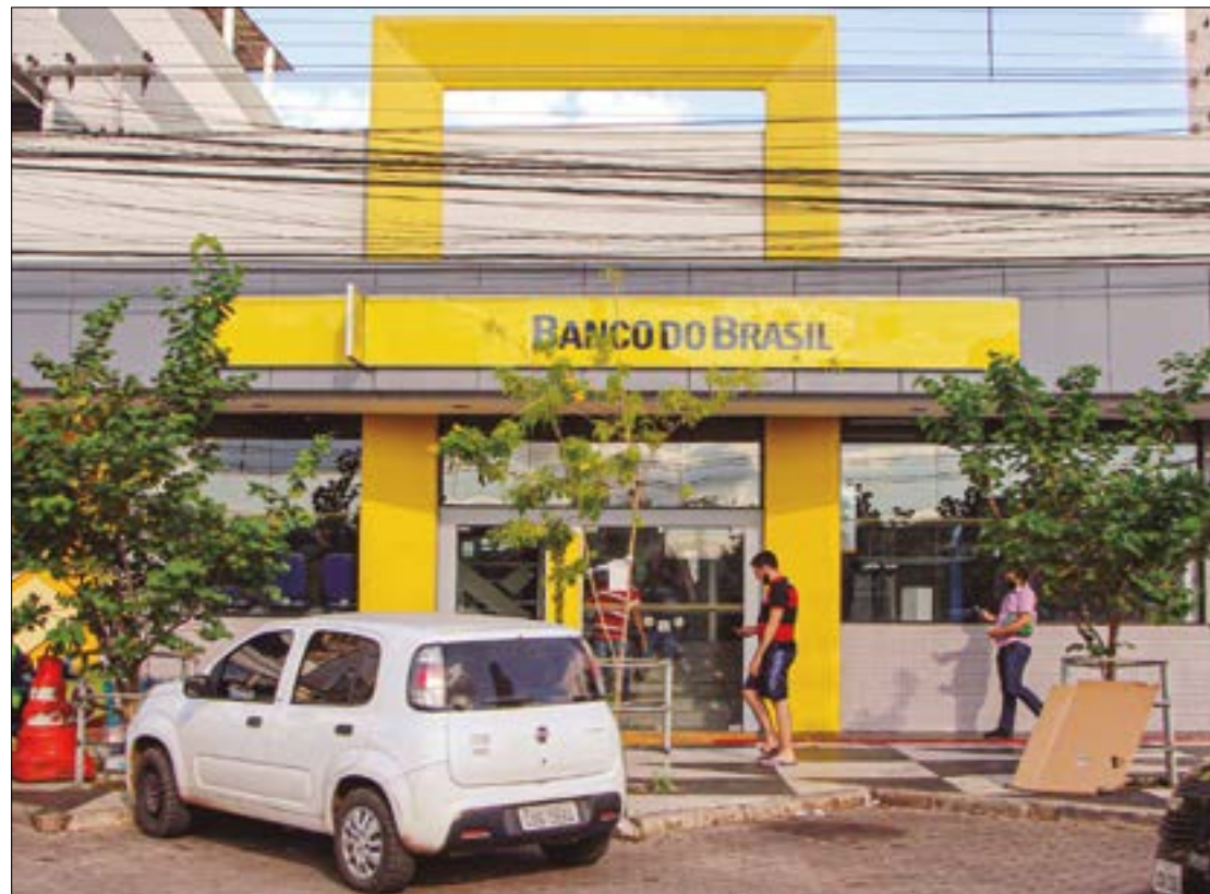
Data máxima de agendamento do DOC vai até 29 de fevereiro