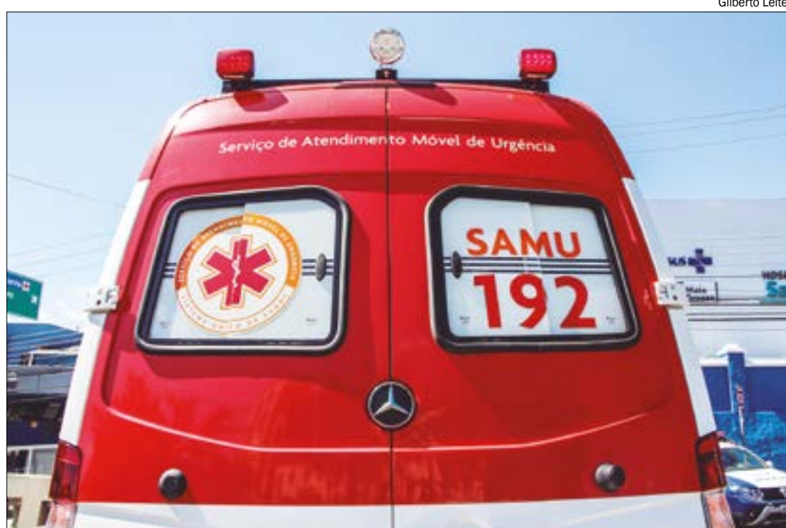
Atualmente, os motoristas do SUS recebem R$ 1.462, pouco a mais que o salário mínimo, reajustado em 2024 para R$ 1.412,00

Segundo Michael, o projeto acabou sendo arquivado e a Secretaria de Saúde passou a argumentar que o