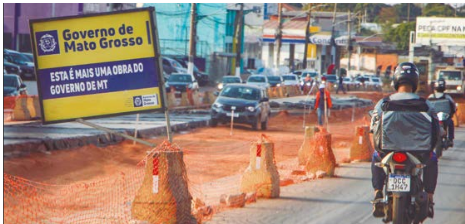
A Ponte Júlio Müller, que liga as duas cidades, passará a ter apenas uma via de mão dupla

Para diminuir o impacto no trânsito, diversas rotas alternativas foram definidas